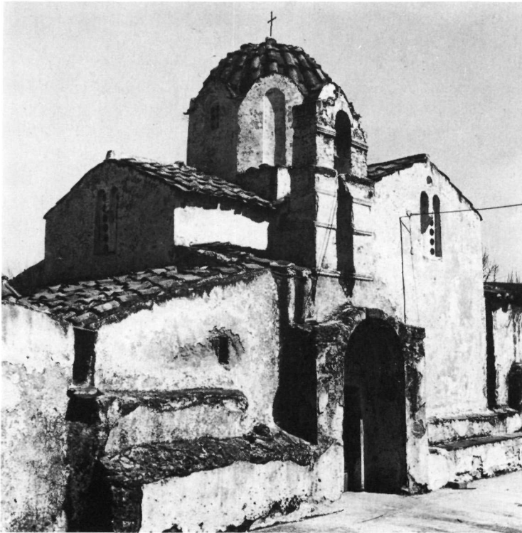
Εικ. 1. 'Ο ναός τῷ Ἁγίου Νικολάου στὸν Ἅγιο Νικόλαο Μονεμβασίας. Ἡ νότια πλευρὰ τοῦ κυρίως ναοῦ.

Στὴν ἀρχὴ τῆς μελέτης (σ. 35-37) παραλείφθηκε νὰ σημειωθεῖ ὅτι στὸ νότιο τοῖχο τοῦ κυρίως ναοῦ, στὴν ἐξωτερικὴ πλευρὰ, χαμηλά, ὑπάρχει βαθυιδωτὸ πεζούλι, διαφορετικοῦ ὕψους, δυτικὰ τοῦ τόξου πού, προστατευτικό, διαμορφώνεται ἔξω ἀπὸ τὴ νότια θύρα (Εἰκ. 1). Στὸ ἐσωτερικὸ τοῦ νότιου τοῖχου τῆς ἐκκλησίας, ἀνατολικά τῆς θύρας, προεξέχει κατὰ 0,19 μ. σὲ μῆκος 1,99 μ. ἔως τὸ τέμπλο γένεση ἡμικυλινδρικοῦ θόλου. Δόντι στὸ δυτικὸ ἄκρο τῆς προεξοχῆς ἴσως μαρτυρεῖ πὼς ὑπῆρχε ἐκεῖ ἐνισχυτικὴ ζώνη. Τὰ στοιχεῖα αὐτὰ προδίδουν ἀρχαιότερη ἀπὸ τὴν τωρινὴ φάση τοῦ μνημείου. Συνηγορεῖ καὶ τὸ παλαιότερο στρώμα τοιχογραφήσεως, πού φαίνεται μέσα στὸ ἱερό, πάντα στὸ νότιο τοῖχο, πλάι στὸν ἅγιο τοῦ πίν. 9 (ΔΧΑΕ, ὁ.π.), ὁ ὁποῖος ἐκ παραδρομῆς ἐκεῖ, ὅπως καὶ στὴ σ. 37, θεωρήθηκε ὡς ἀνήκων στὸ α' στρώμα. Κι ἂς σημειωθεῖ ὅτι σύμφωνα μὲ ντόπια παράδοση,