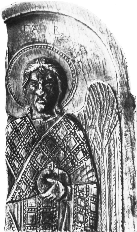
Εικ. 4. Ελεφαντοστό. Ο αρχάγγελος Γαβριήλ. Ονάσιγκτον, Συλλογή W. R. Tyler.

Δύο αρχάγγελοι, οι Μιχαήλ και Γαβριήλ, με αυτοκρατορική στολή πλαισιώνουν το Θρόνο της Ετοιμασίας σε πλάκα από στεατίτη, του τέλους του 10ου-αρχών του 11ου αιώνα, που βρίσκεται στο Μουσείο του Λούδρου 22 , αρχάγγελοι με αυτοκρατορική στολή εικονίζονται και σε ελεφαντοστέινα κιβωτίδια του 10ου αιώνα 23 .