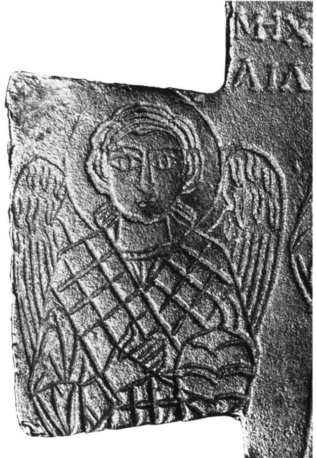
Εικ. 6. Λιτανικός σταυρός. Αθήνα, Μουσείο Κανελλοπούλου (λεπτομέρεια).

ώνα της Temple Gallery 31 , καθώς και σε επιγραφές μετάλλινων αντικειμένων της ίδιας εποχής 32 . Ανάλογη γραφή επιγραφής σε μπρούντζινο δίσκο του Μουσείου Ιστορίας και Τέχνης της Γενεύης συγκρίνεται με τη μεγαλογράμματη γραφή του κώδικα Garrett 14, φ. 295r στη Βιβλιοθήκη του Πανεπιστημίου του Princeton, που χρονολογείται στο 955 33 .