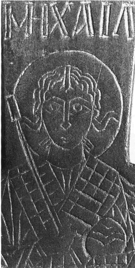
Εικ. 5. Λιτανικός σταυρός Συλλογής Γ. Τσολοζίδη (λεπτομέρεια).