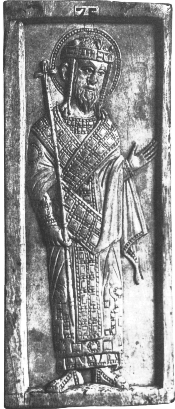
Εικ. 3. Ελεφαντοστό. Ο άγιος Κωνσταντίνος. Νέα Υόρκη, Συλλογή Arthur Sachs.

Βαρύτιμη διάλιθη διακόσμηση φέρει και ο λώρος του αρχαγγέλου Γαβριήλ σε φύλλο ελεφαντοστέινου διπτύχου της Συλλογής Tyler, που χρονολογείται γύρω στο 1000 21 (Εικ. 4). Μετωπικός, κρατεί με το αριστερό του χέρι σφαίρα που διαγράφεται συμπαγής και πεπλεγμένη στο άνω τμήμα της, όπου στηρίζεται σταυρός. Η κόμη του χωρίζεται σε δύο μέρη με κάθετη ταινία που κατεβαίνει στο μέτωπο, όπως στον αρχάγγελο του σταυρού που εξετάζουμε.