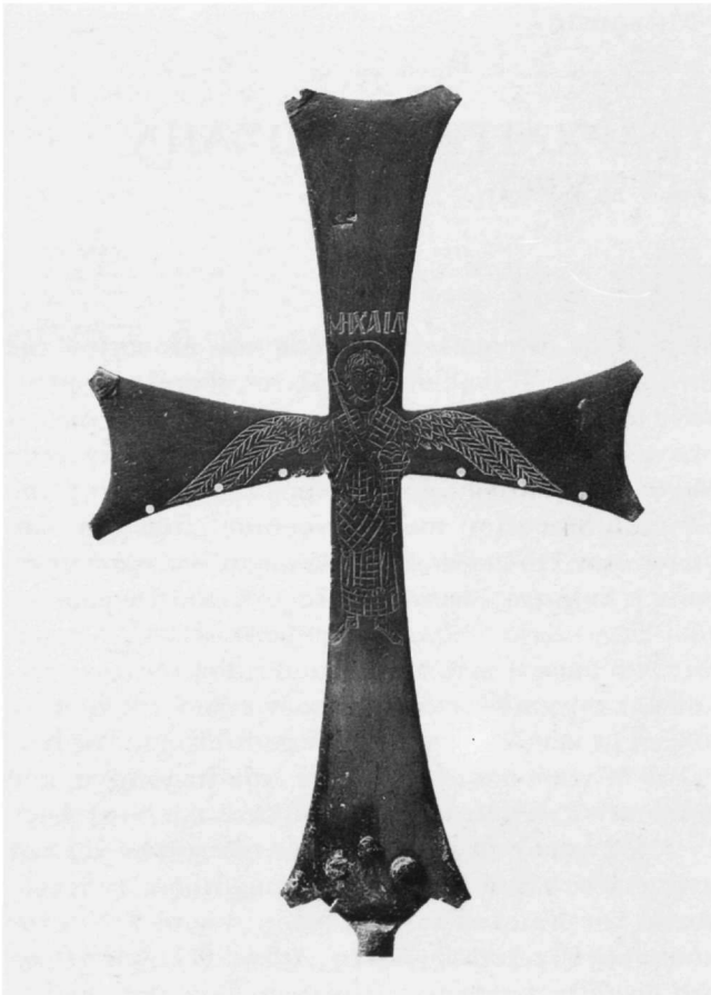
Εικ. 1. Λιτανικός σταυρός. Αθήνα, Συλλογή Γ. Τσολοζίδη.