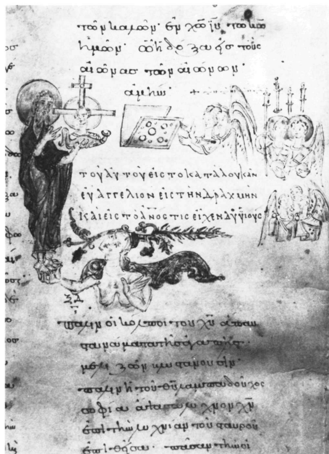
Εἰκ. 1. Χειρόγραφο τῆς Ἐθνικῆς Βιβλιοθήκης τῆς Ἑλλάδος 211, φ. 34ν

Ἡ ἐνσάρκωση τοῦ θεοῦ Λόγου καὶ ἡ ἐξίσωση τοῦ σεσωσμένου ἀνθρώπου πρὸς τοὺς ἀγγέλους εἶναι θέματα πολὺ ἀγαπητὰ τὴν ἐποχὴ τῆς ἀναστήλωσης τῶν εἰκόνων μετὰ τὸ 843. Τὴν Κυριακὴ τῆς Ὁρθοδοξίας δοξολογοῦνται οἱ ἄγγελοι, τὰ λειτουργικὰ τάγματα πού διακονοῦν τὸ Θεὸ γιὰ τὴ σωτηρία τοῦ ἀνθρώπου καὶ μόνο αὐτὰ βλέπουν τὸ πρόσωπό του. Ἡ ἐνσάρκωση δίνει στὸν ἀνθρώπο τὴ δυνατότητα νὰ ταυτιστεῖ μὲ τοὺς ἀγγέλους καὶ νὰ βλέπει τὴ Σοφία τοῦ Θεοῦ.