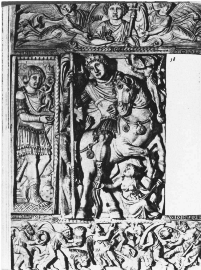
Είκ. 2. Δίπτυχο Barberini Μουσείου Λούβρου

τάς γείτονας λέγουσα, συγχαρητέ μοι ὅτι εὔρον τὴν δραχμὴν ἣν ἀπόλεσα. Ἡ Ὁμιλία τοῦ Στουδίτη τελειώνει μὲ τὸ ἀπολωλὸς πρόβατον: ... τὸ πεπλανημένον εἰς οὐρανοὺς ἀναγαγὼν συνηρίθμησε καὶ τῆς βασιλείας τῆς αἰωνίου κατηξίωσεν· ἥς γένοιτο πάντα ἡμᾶς ἐπιτυχεῖν... 16 εὐχεται ὁ Στουδίτης στοὺς ἀκροατὲς του. Καὶ ἐδῶ χρησιμοποιεῖται ἡ λέξη συνηρίθμησε μὲ τοὺς ἀγγέλους τὸν πεπλανημένον στὸν οὐρανό, ὅπως καὶ στὴν Ὁμιλία τοῦ Χρυσόστομου. Αὐτὸ τὸ θέμα τῆς σωτηρίας τοῦ ἀνθρώπου καὶ ἡ ἐξύψωσή του μεταξὺ τῶν ἀγγέλων πού βλέπουν τὸ Θεό, πιστεύουμε ὅτι εἰκονογραφεῖ ἡ μικρογραφία μας. Θὰ μπορούσε νὰ ἔχει ὡς τίτλο τὴν ὡραία φράση ἀπὸ τὴν περικοπὴ τοῦ Εὐαγγελίου τοῦ Λουκᾶ (κεφ. 15, 10-11), τὴν ὁποία ἐρμηνεύει ὁ Χρυσόστομος στὴν Ὁμιλία αὐτή: οὕτω λέγω ὑμῖν, χαρὰ γίνεται ἐνώπιον τῶν ἀγγέλων τοῦ Θεοῦ ἐπὶ ἐνὶ ἁμαρτωλῶ μετανοοῦντι.