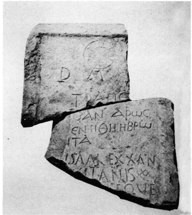
Εἰκ. 4. Τράπεζα Ἀλεξάνδρου ἀπό τό Mactar.

Ἄς ξαναγυρίσουμε ὅμως στά μνημεῖα. Οἱ πλάκες μέ τήν ἐπιγραφή mensa martyrum ἢ μερικές φορές memoria sancta 30 εἶναι συνήθως μεγάλου πάχους καί ποικίλων μορφῶν 31 : τετράγωνες, ὀρθογώνιες, ἡμικυκλικές. Εἶναι κυρίως ἀδρῆς κατασκευῆς καί πολλές φορές φέρουν ὑψωμένο πλαίσιο ἢ καί κοιλότητες, ἀνάλογες μέ ἐκεῖνες τῆς τράπεζας τοῦ Βυζαντινοῦ Μουσείου (Εἰκ. 5-6). Ἡ ἐπιγραφή μπορεῖ νά περιορίζεται σέ ἀπλή ἀναφορά mensa martyrum χωρίς κᾶν νά ἀναφέρει τά ὀνόματα τῶν μαρτύρων 32 . Ἀλλά αὐτό εἶναι σπά-