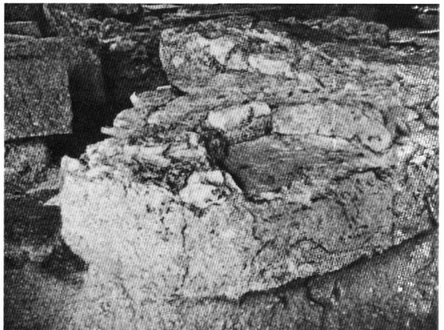
Εἰκ. 1. Τράπεζα μαρτύρων. Βυζαντινὸ Μουσεῖο Ἀθηνῶν, ἀριθ. 128.