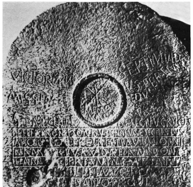
Εἰκ. 5. Τράπεζα μαρτύρων ἀπό τό Tixter (ἀπό Υ. Duval).

Οἱ τράπεζες αὐτές, πού στήν ἐλληνική βιβλιογραφία