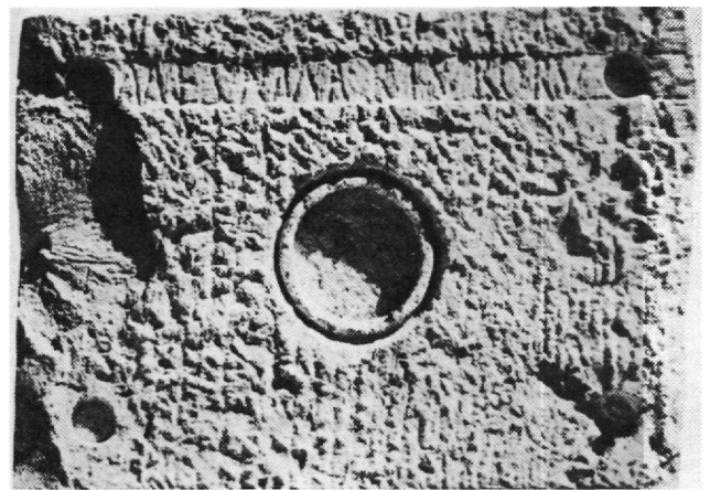
Εἰκ. 6. Τράπεζα μαρτύρων ἀπό τό Bou Takrematen.

ὀνομάζονται, ὅπως εἶδαμε, «τράπεζες μαρτύρων», στή διεθνή βιβλιογραφία ἀναφέρονται συχνά ὡς «ἅγιες τράπεζες» 41 , ἔστω καί ἂν καμιά τους δέν βρέθηκε ποτέ κατά χώραν. Καί αὐτό τό γεγονός, τό νά θεωροῦνται δηλαδή de facto λειτουργικά σκευῆ, ἔδωσε πολλές φορές ἀφορμή σέ ταύτιση κτιρίων, στά ὁποῖα βρέθηκαν, μέ ἐκκλησίες, χωρίς νά ὑπάρχει καμιά εἰδική ἔνδειξη γι' αὐτό, πέρα ἀπό τήν εὑρεση τῆς τράπεζας 42 . Μόνο σέ πολύ πρόσφατες μελέτες 43 γίνεται σαφές ὅτι ὁ τόσο διαδεδομένος αὐτός τύπος τράπεζας δέν προορίζεται