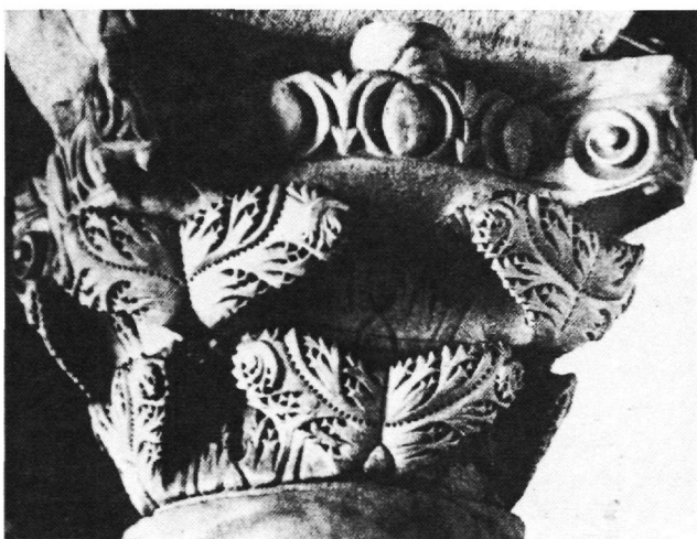
Εικ. 6. Ραβέννα. Κιονόκρανο στο S. Apollinare in Classe (Farioli, Corpus III , εικ. 40).