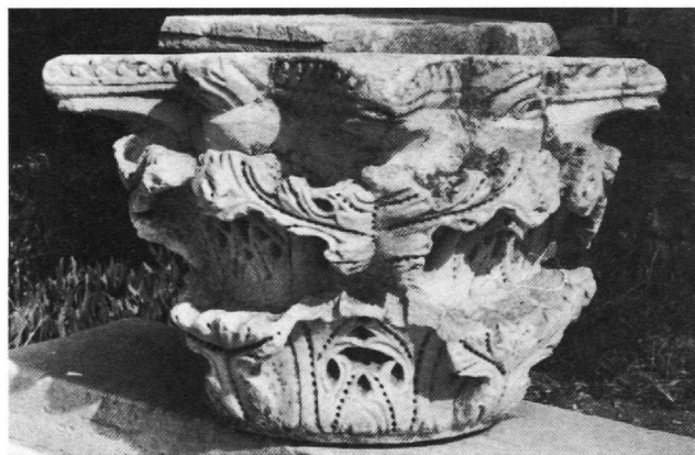
Εικ. 1-2. Κιονόκρανο στο Μουσείο Πυθαγορείου Σάμου.

άβακα, χαρακτηριστικό που από τα γνωστά παραδείγματα ξέρουμε ότι συνδυαζόταν με την άκανθα στην κλασική της μορφή 9 . Για τη χρονολόγηση αυτού του