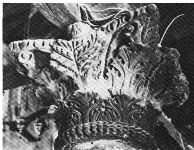
Εικ. 7. Άρτα. Κιονόκρανο στην Αγία Θεοδόρα.

τερους και άλλοτε με νεότερους τύπους κιονοκράνων. Τα διπλής όψεως κιονόκρανα της Κωνσταντινούπολης και της Αντιόχειας, καθώς και το κιονόκρανο της Σάμου, επιβεβαιώνουν ακριβώς αυτό το γεγονός. Στα κιονόκρανα διπλής όψεως, συγκεκριμένα, παρατηρούμε ότι γίνεται μία πρώτη προσπάθεια ένταξης της νέας μορφής άκανθας στο κορινθιακό κιονόκρανο. Όμως ο τεχνίτης, παρόλο που χρησιμοποιεί τα στοιχεία αυτά στο ίδιο κιονόκρανο, τα βάζει σε διαφορετικές όψεις. Αυτή την καινοτομία τολμά ο γλύπτης του κιονοκράνου που μελετάμε: το κορινθιακό κιονόκρανο ενός σπάνιου τύπου (τύπος VII) συνδυάζεται για πρώτη φορά με την άκανθα «πεταλούδα», χαρακτηριστική των σύνθετων κιονοκράνων.