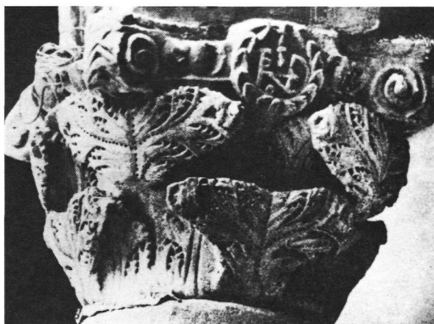
Εικ. 4. Ραβέννα. Κιονόκρανο στην Piazza del Popolo (F. W. Deichmann, Ravenna I, εικ. 35).