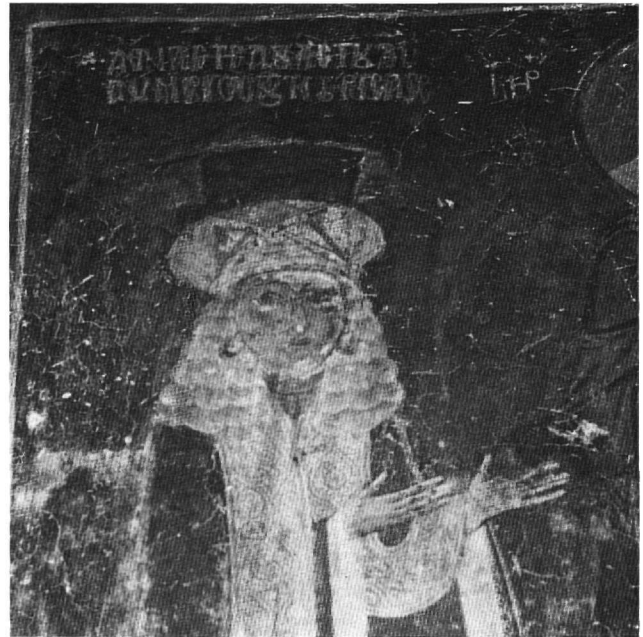
Εἰκ. 4. Ἁγιοὶ Ἀνάργυροι, βόρειο κλίτος. Ἡ Ἄννα Ραδηνή.

Ἡ πληροφορία πού εἶχε στηριζεῖ τή σύνδεση τοῦ τόπου κλαυθμώνος τῆς Καστοριάς καί τοῦ τόπου ἐξορίας προέρχεται ἀπὸ ἕνα χωρίο τοῦ Κεδρηνοῦ, σύμφωνα μέ τό ὁποῖο ἡ Εἰρήνη ἢ Ἄθηναία (797-802) τὸν δὲ μάγιστρον καὶ Θεόδωρον πατρικίον τὸν Καμουλιανὸν καὶ