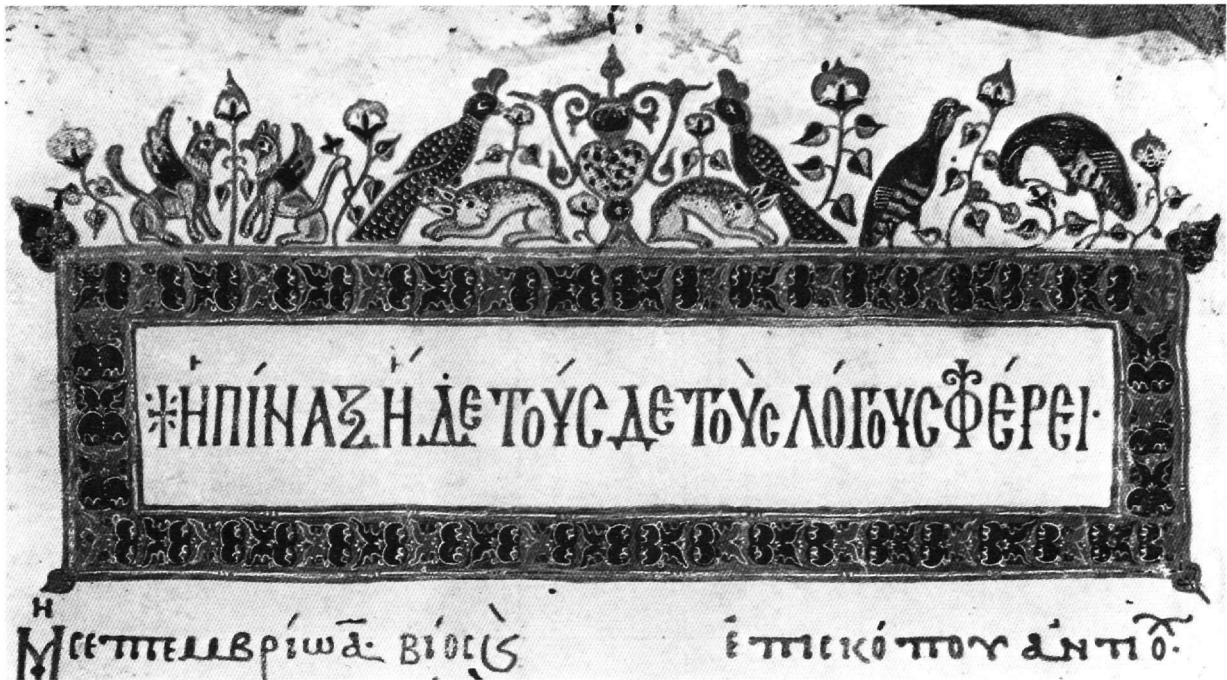
Εικ. 8. Άθως, Λαύρας 446, φ. 1v.

ženko 44 , αυτή την οποία ακολουθήσαμε σε γενικές γραμμές στην εργασία μας.