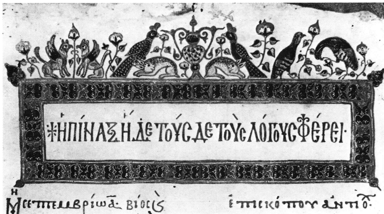
Εικ. 8. Άθως, Λαύρας 446, φ. 1v.

ženko 44 , αυτή την οποία ακολουθήσαμε σε γενικές γραμμές στην εργασία μας.