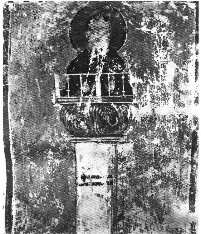
Εικ. 1. Ἄθως, Λαύρας Δ46, φ. 4ν. Ο ἅγιος Συμεών ο Στυλίτης.

Ωστόσο, ο απλούστατος εικονογραφικός τύπος που παραδίδεται από το χειρόγραφο μας είναι περισσότερο συνηθισμένος στη μνημειακή ζωγραφική. Ο Συμεών ο Στυλίτης εικονίζεται μοναχικός σε πολύ λίγες μι-