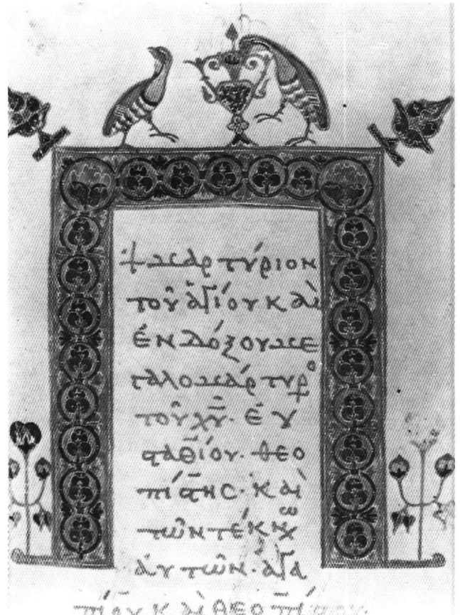
Εικ. 9-10. Ἄθως, Λαύρας Δ46, φ. 5r και 174r.

τουργικές συγκυρίες, που να συνδέονται με συγκεκριμένο τόπο παραγωγής χειρογράφων 45 .