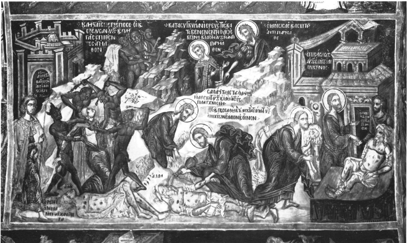
Εικ. 8. Μονή των Φιλανθρωπηγών. Η Παραβολή του Καλού Σαμαρείτη στο Ιερό.

Είναι σημαντικό για την έρευνα ότι από τις δεκαοχτώ συνολικά διακοσμήσεις οι δώδεκα είναι ακριβώς χρονολογημένες με επιγραφές από το 1539 (μονή της Μυρτιάς) 31 (Εικ. 2) μέχρι το 1592/93 ή 1595/96 (τοιχογραφίες του τρούλου στη μονή της Ζάβορδας) 32 , που δίνουν πολύτιμα στοιχεία για τους πάτρωνες και συνεργούς και μερικές για τη διάρκεια των εργασιών. Τέσσερις μόνο, κι αυτές στο δεύτερο μισό του αιώνα και με κάλυψη εννιά χρόνων στην εξητάχρονη παρουσία της σχολής, έχουν το όνομα των ζωγράφων: του εκ Θηβών της Βοιωτίας Φράγγου Κατελάνου (παρεκκλήσι Αγίου Νικολάου στο καθολικό της μονής της Λαύρας, 1560), των Θηβαίων, επίσης, αδελφών ιερέα Γεωργίου και Φράγγου Κονταρή (Άγιος Νικόλαος της Κράψης, 1563· λιτή στο καθολικό της μονής Βαρλαάμ, 1566) και μόνου του Φράγγου Κονταρή (Μεταμόρφωση της Βελτισίστας, 1568). Οι άλλοι τεχνίτες παραμένουν ανώνυμοι, όπως συνήθως αυτήν ακόμη