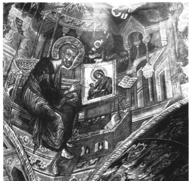
Εικ. 6. Μονή των Φιλανθρωπητών. Άποψη των τοιχογραφιών στην ανατολική πλευρά του ναού.

αναπτύσσουν το 16ο αιώνα αξιοσημείωτη δραστηριότητα σε έργα θρησκευτικής ευποιίας στο Νησί και στα Μετέωρα, όπου ιδρύουν ή ανακαινίζουν μονές, κοπιάζουν και δαπανούν για τη διακόσμησή τους από ζωγράφους της τοπικής ηπειρωτικής σχολής 6 .