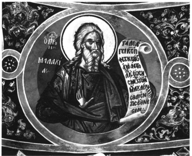
Εικ. 3. Μονή των Φιλανθρωπηνών. Ο προφήτης Μαλαχίας στο θόλο του ναού.