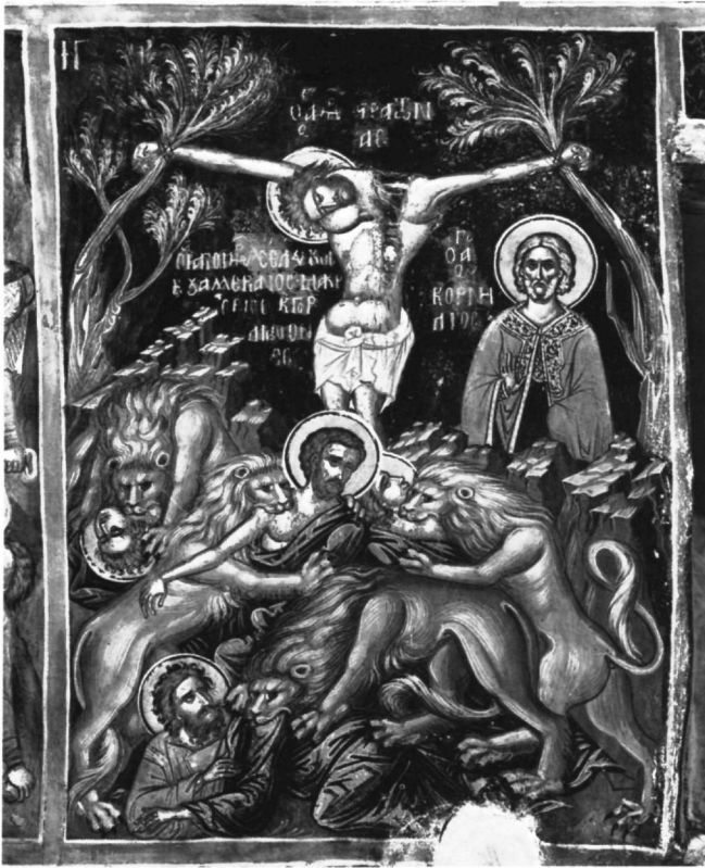
Εικ. 12. Μονή των Φιλανθρωπητών. Παράσταση μνηολογίου στο νάρθηκα, νότια πλευρά.