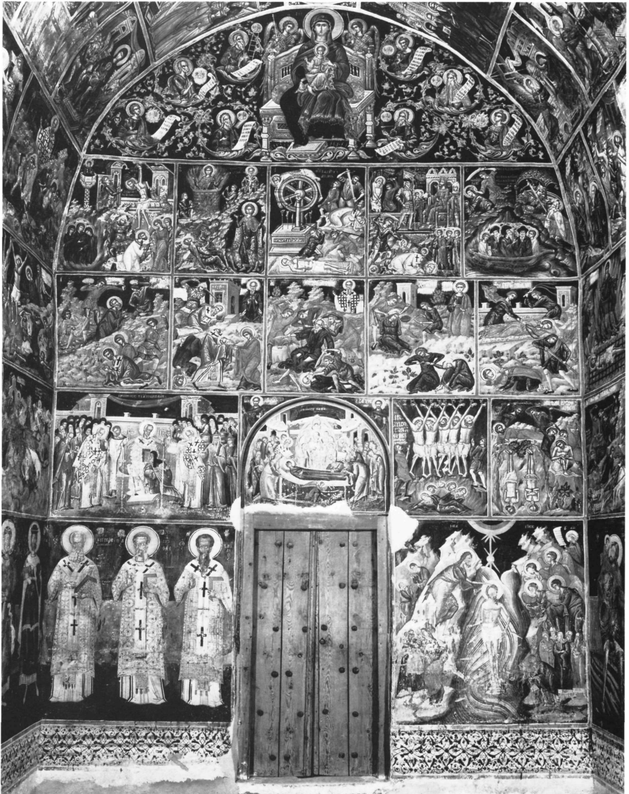
Εικ. 11. Μονή των Φιλανθρωπινών. Ο διάκοσμος στην ανατολική πλευρά του νάρθηκα.