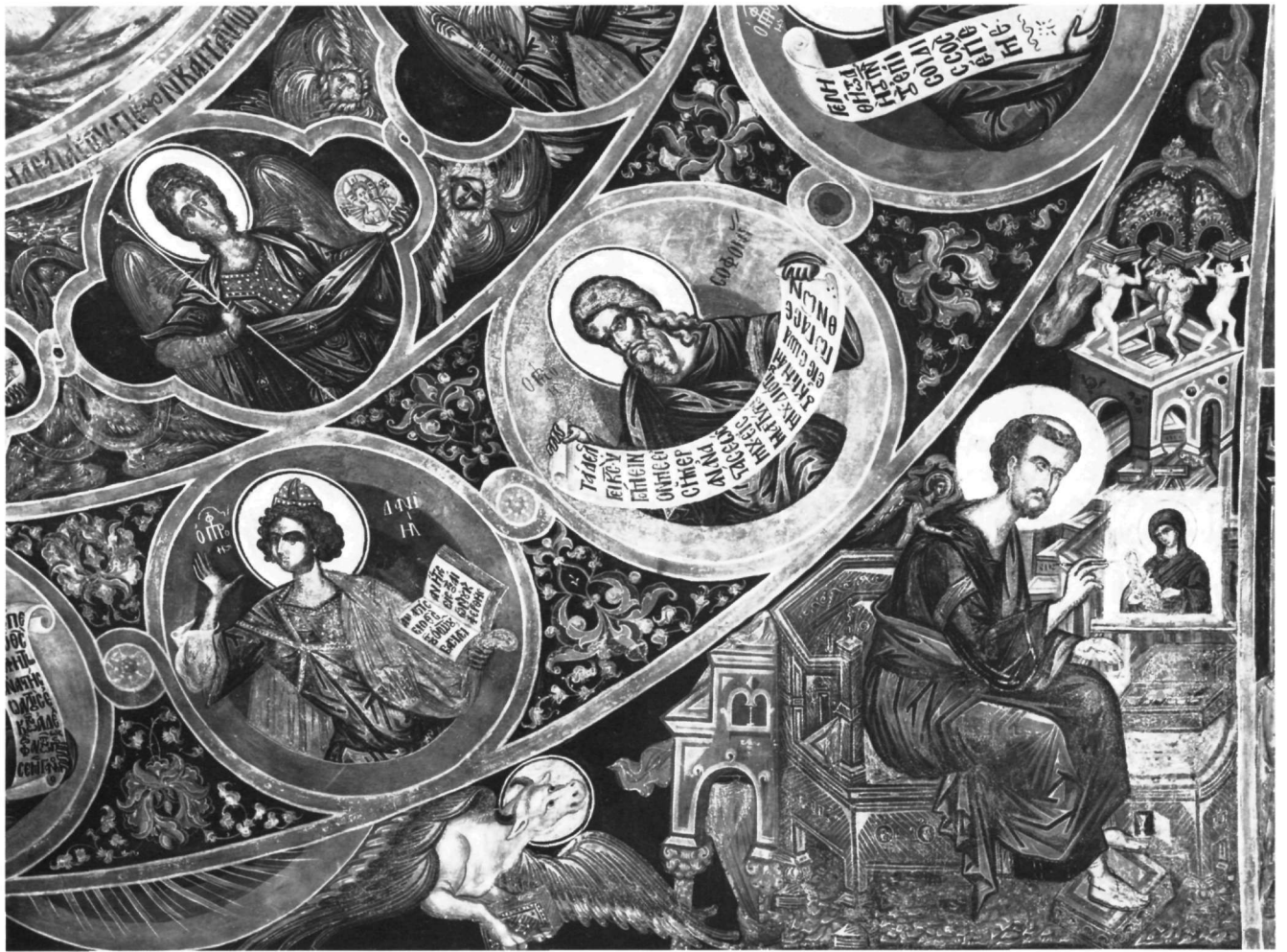
Εικ. 4. Μονή των Φιλανθρωπητών. Μερική άποψη των τοιχογραφιών στο θόλο του ναού.