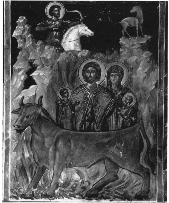
Εικ. 13. Μονή των Φιλανθρωπητών. Παράσταση μνηολογίου στο νάρθηκα, δυτική πλευρά.

σία της ως τοπικής της Ηπείρου και της ηπειρωτικής Ελλάδας, σε σχέση με άλλες που έχουν προταθεί (σχολή των Θηβών, της ΒΔ. Ελλάδας) 34 .