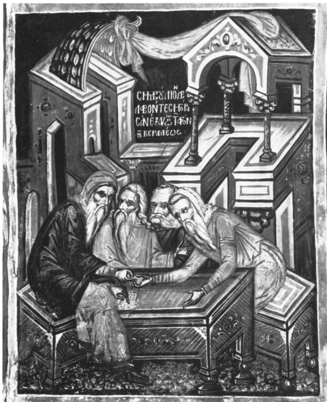
Εικ. 9. Μονή των Φιλανθρωπητών. Το Συνέδριο των Αρχιερέων στο θόλο του ναού (ΒΔ.).