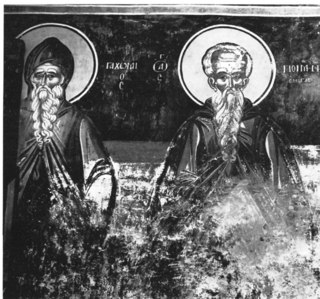
Εικ. 22. Ναός του Αγίου Νικολάου στην Κράψη. Άγιοι στο νάρθηκα, λεπτομέρεια.

Το 1542 και 1560 το καθολικό της μονής των Φιλαν-