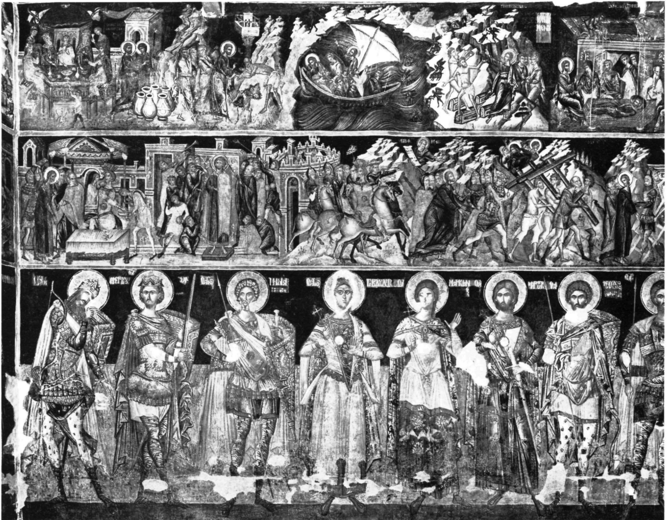
Εικ. 1. Μονή των Φιλανθρωπηνών στο Νησί των Ιωαννίνων. Ο αρχικός διάκοσμος στη βόρεια πλευρά του ναού.

την εμφάνιση δύο, αντίστοιχα, ζωγραφικών συστημάτων, της κρητικής και της τοπικής ηπειρωτικής σχολής, που θα επικρατήσουν στην ηπειρωτική Ελλάδα το 16ο αιώνα. Το πρώτο γνωστό έργο του Κρητικού ζωγράφου και μοναχού Θεοφάνη στο μικρό μοναστήρι των Μετεώρων το 1527 και λίγο αργότερα, πιθανώς το 1531/32, οι τοιχογραφίες ανώνυμου ζωγράφου στο μοναστήρι των Φιλανθρωπηνών (Εικ. 1) δείχνουν ολάνθιστη, πράγματι, την αρχή μιας μακράς και πλούσιας διαδρομής μέχρι τα τέλη του αιώνα των δύο σχολών, που θα υπερσχύσουν στα μεγάλα μοναστικά κέντρα και σε πολλά μοναστήρια και εκκλησίες της τουρκοκρατούμενης χώρας, από την Ήπειρο ως την Εύβοια και από τη Μακεδονία ως τη Βοιωτία. Η γεωγραφική έκταση, η χρονική διάρκεια, η συνοχή των εικονολογικών και το εύρος των εικονογραφικών απόψεων, το