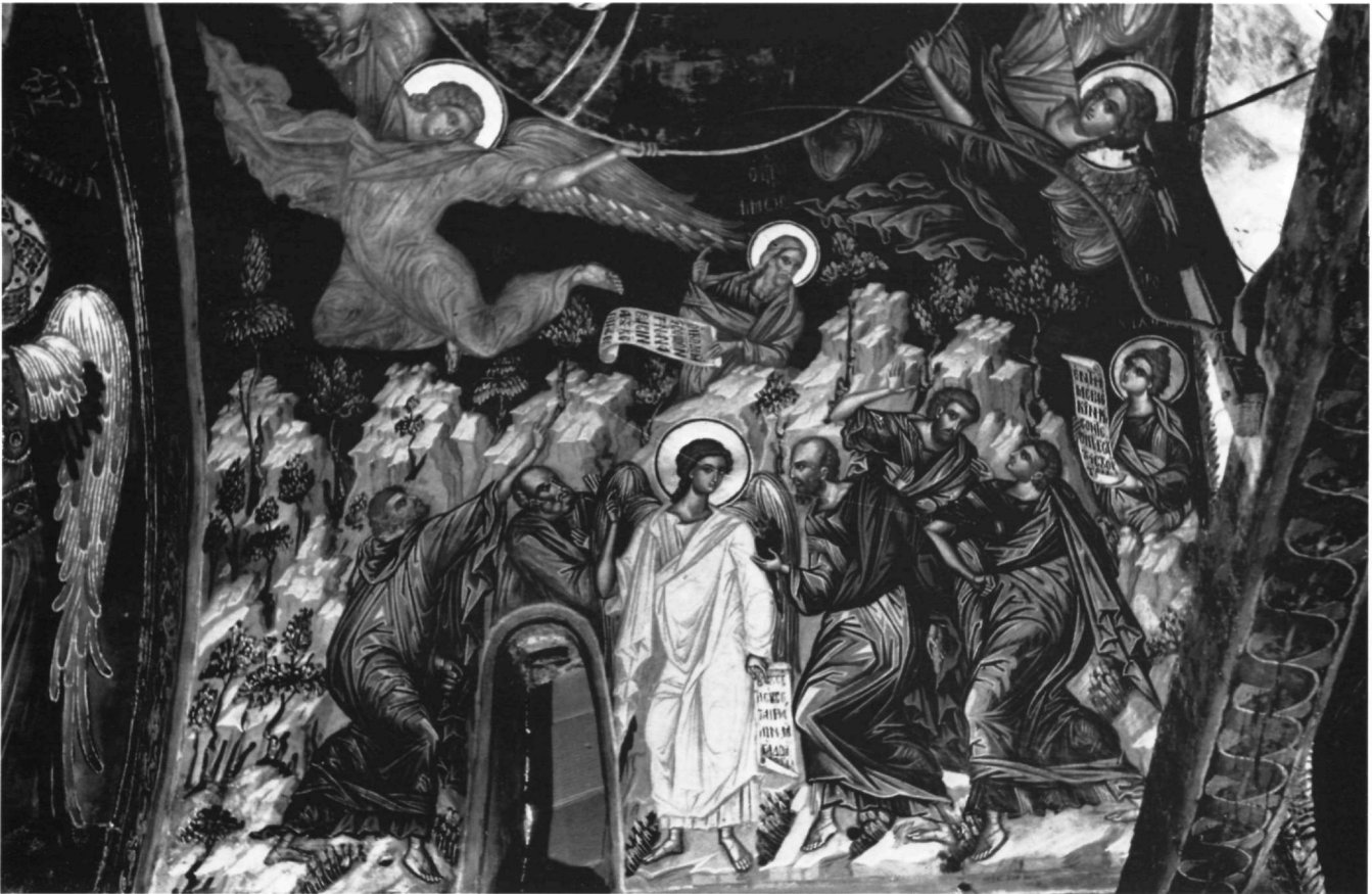
Εικ. 7. Μονή Βαρλαάμ. Η Ανάληψη, λεπτομέρεια.

Θ' (1961), σ. 103 κ.ε., πίν. 10-13. Αχειμάστου-Ποταμιάνου, Η μονή των Φιλανθρωπητών, σ. 173 κ.ε., 179 και σποραδικά, πίν. 75-76. Α. Δ. Παλιούρας, Βυζαντινή Αιτωλοακαρνανία, Αθήνα 1985, σ. 126 κ.ε., εικ. 118-124. Garidis, ό.π., σ. 172 κ.ε. και σποραδικά, εικ. 179-181.