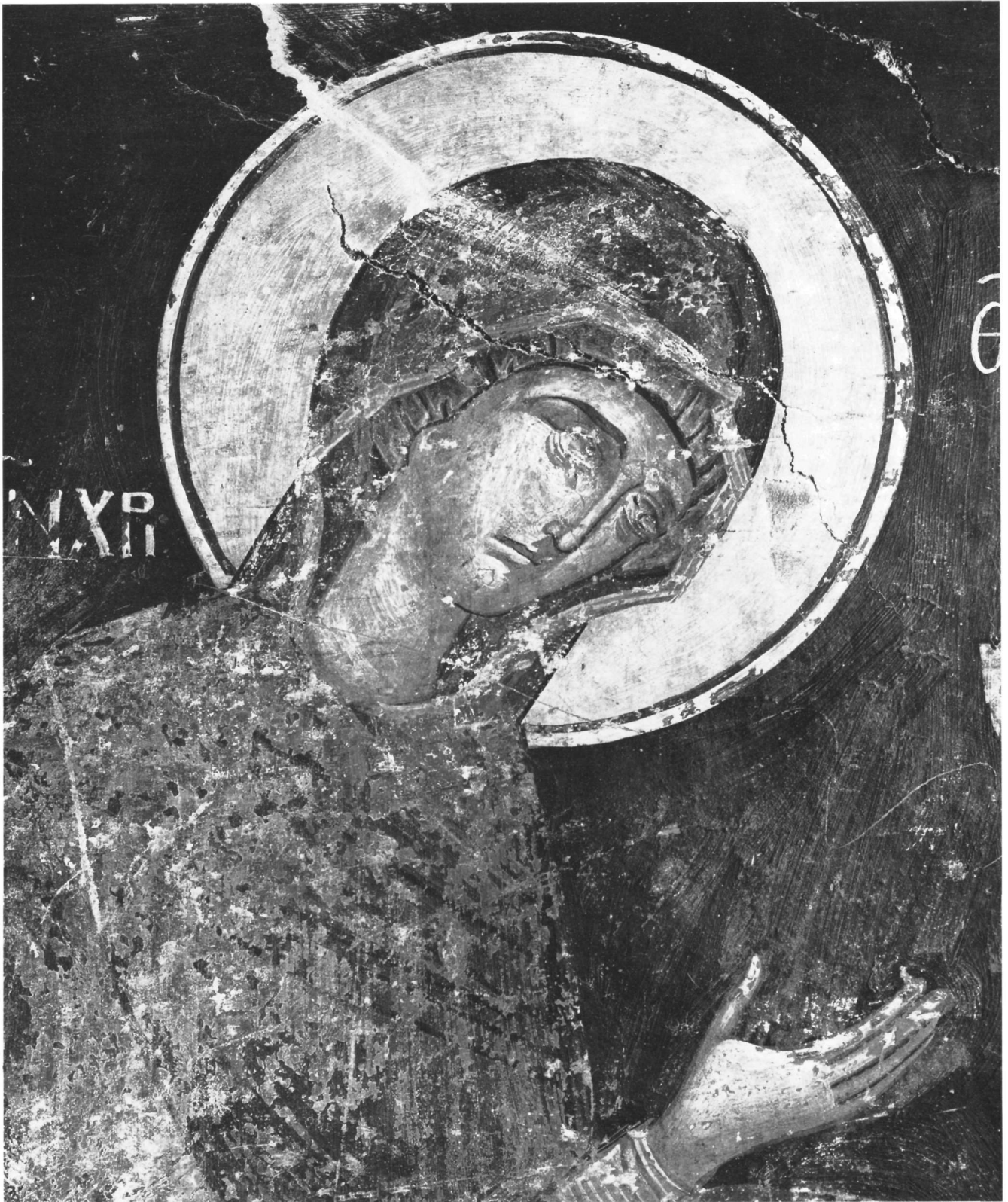
Εικ. 21. Μονή των Φιλανθρωπινών. Η Παναγία «Η Μεσίτρια των Χριστιανών», λεπτομέρεια της Δέησης στο νότιο εξαρτικό.