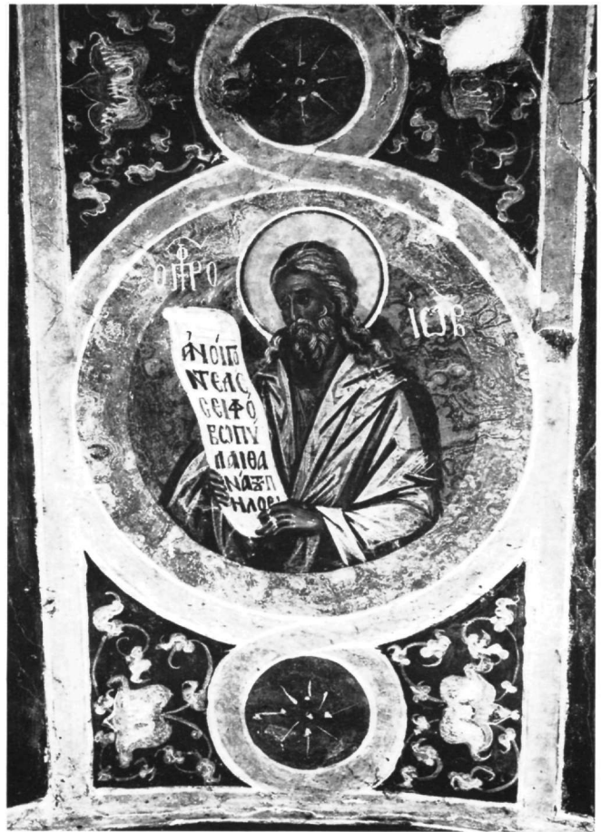
Εικ. 2. Μονή Μυρτιάς στην Αιτωλία. Ο προφήτης Ιώβ.