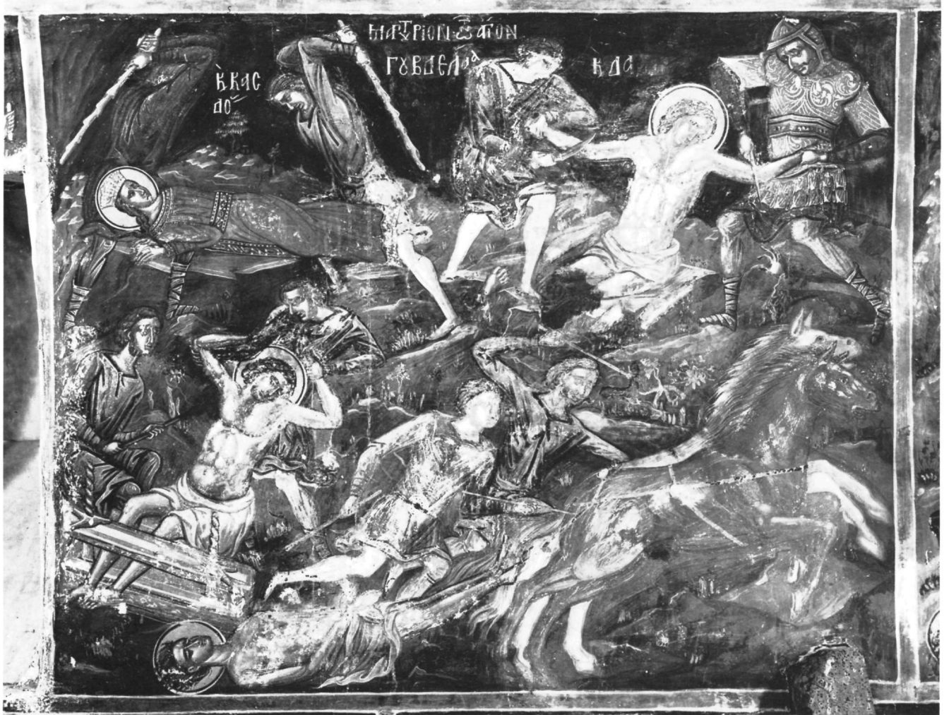
Εικ. 14. Μονή των Φιλανθρωπηών. Παράσταση μηνολογίου στο νάρθηκα, βόρεια πλευρά.