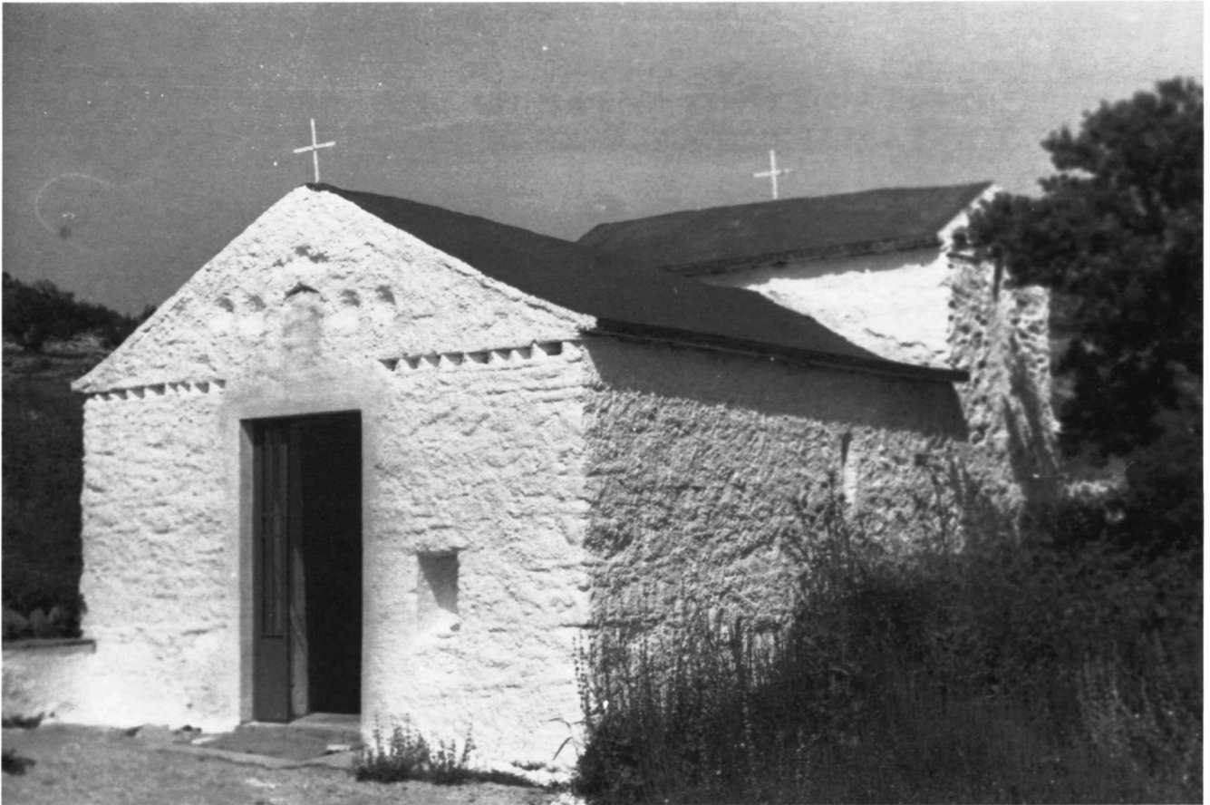
Εικ. 1. Ο ναός των Ταξιαρχών. Εξωτερική άποψη από ΝΔ.