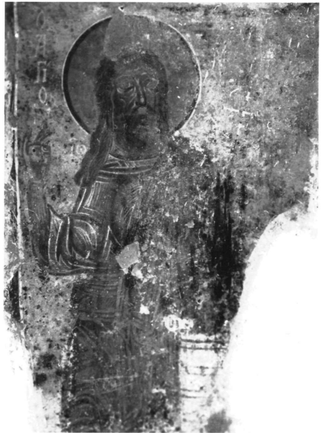
Εικ. 3. Ναός Ταξιαρχών. Ο άγιος Ιωάννης ο Πρόδρομος.

Στις τριγωνικές επιφάνειες κάτω από την εγκάρσια καμάρα εικονίζονται τα σύμβολα των ευαγγελιστών 11 που ταυτίζονται με επιγραφές. Επιπλέον πλάι σε κάθε ένα από αυτά και αρχίζοντας από τον άγγελο-σύμβολο του ευαγγελιστή Ματθαίου (Εικ. 8), στο βορειοανατολικό τρίγωνο, διαβάζουμε ΑΔΟΝΤΑ , ΒΩΝΤΑ , πλάι στο λιοντάρι του Μάρκου, ΚΑΙΚΡΑΓΩΤΑ , πλάι στο βόδι του Λουκά. Η τέταρτη λέξη, πλάι στον αετό του Ιωάννη του Θεολόγου, είναι κατεστραμμένη. Συμπληρώνουμε: Τὸν ἐπινίκιον ὕμνον ᾄδοντα βοῶντα κεκραγότα καὶ λέγοντα . Τούτο εκφωνείται σε καίρια στιγμή του καθαγιασμού των Τιμίων Δώρων στη διάρκεια της θείας λειτουργίας 12 . Έτσι, το εικονογραφικό πρόγραμμα της εγκάρσιας καμάρας σχετίζεται με τη λειτουργία που ψάλλεται στο Ιερό, γιατί και η σκηνή της Πεντηκοστής συνδέεται με αυτή: ο ιερέας, κατά την τέλεσή της, ζητεί με την ευχή της επίκλησης να κατέλθει το Άγιον Πνεύμα για να μετουσιώσει τον άρτο και τον οίνο σε σώμα και αίμα του Χριστού 13 . Γι' αυτό το λόγο και η σκηνή της Πεντηκοστής συχνά εικονίζεται στο Ιερό Βήμα, όπως στον Όσιο Λουκά, στη