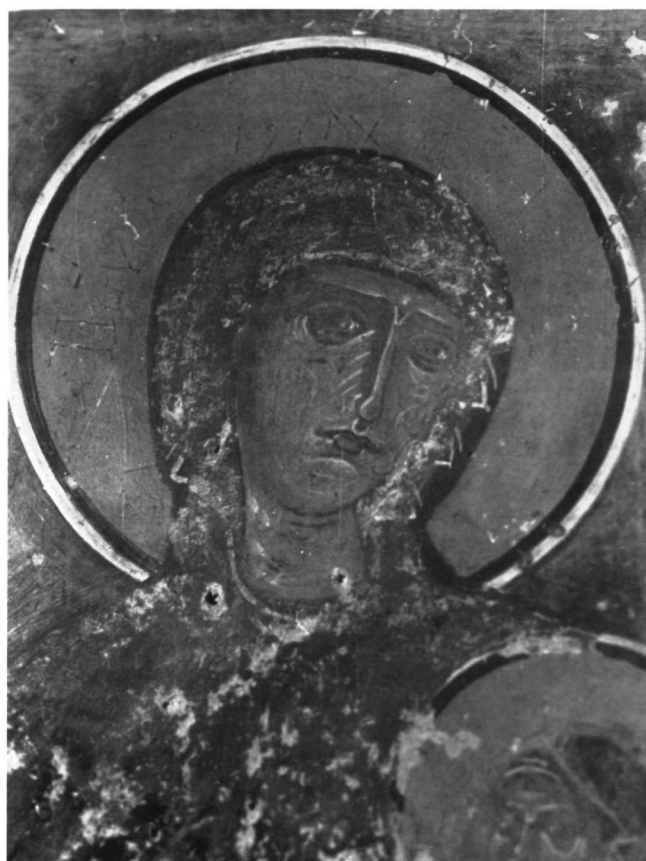
Εικ. 10. Ναός Ταξιαρχών. Η αγία Άννα, λεπτομέρεια.

ζει άλλοτε τις τοιχογραφίες των Αγίων Αναργύρων της Κηπούλας στη Μάνη (1265) 17 (Εικ. 7), λ.χ. το ένδυμα του Χριστού στη Μεταμόρφωση (Εικ. 6) και της Παναγίας στη Γέννηση (Εικ. 4), και άλλοτε μερικές τοιχογραφίες του ναού του Σωτήρα κοντά στο Αλεποχώρι (1260-1280) 18 , όπου όμως υπάρχει εντονότερη πλαστικότητα.