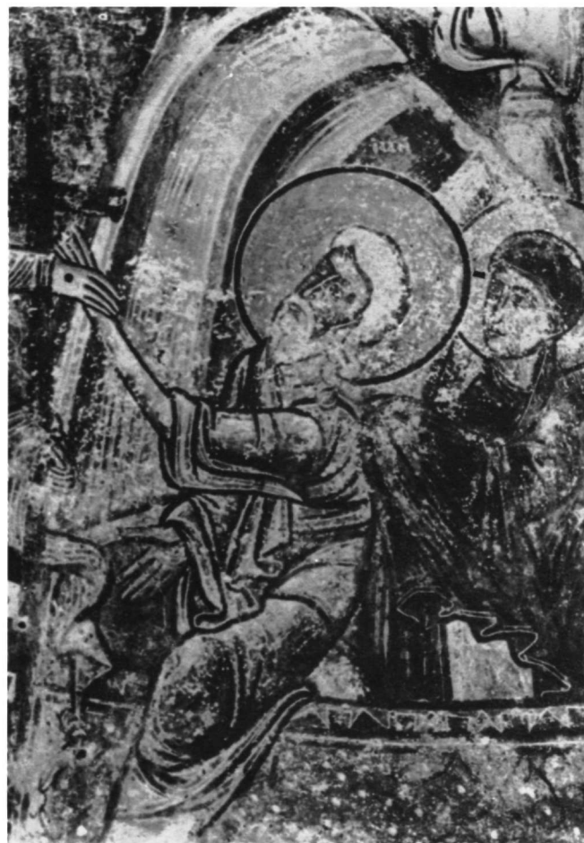
Εικ. 7. Κηπούλα Μάνης, ναός Αγίων Αναργύρων. Η εις Άδου Κάθοδος, λεπτομέρεια.

5). Η τελευταία μορφή μοιάζει φυσιογνωμικά με άγγελο στον Άι-Στράτηγο Μπουλαριών στη Μάνη, του τέλους του 12ου αιώνα 16 , όπου όμως το πλάσιμο είναι πιο σφιχτό.