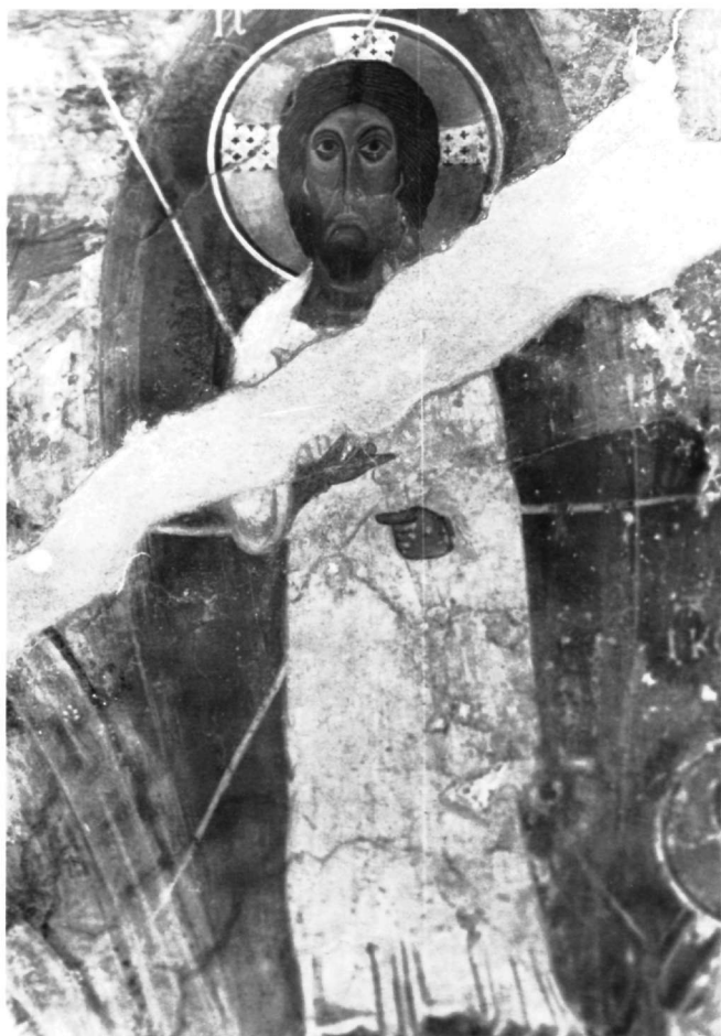
Εικ. 6. Ναός Ταξιαρχών. Η Μεταμόρφωση του Χριστού, λεπτομέρεια.