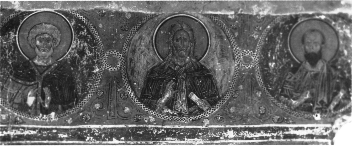
Εικ. 14. Ναός Ταξιαρχών. Προφήτες.