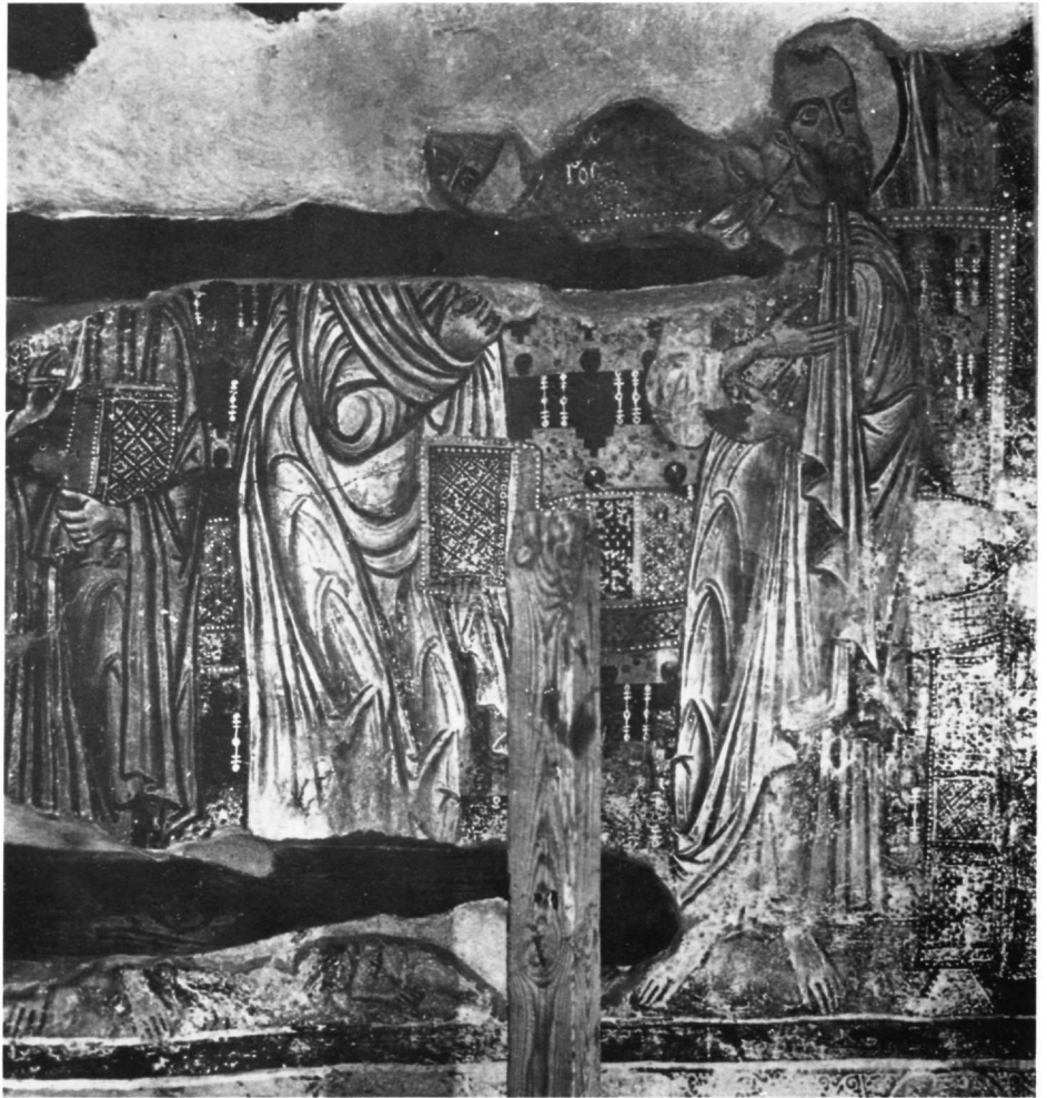
Εικ. 17. Άγιος Γεώργιος κοντά στον Κουβαρά Αττικής. Η Δευτέρα Παρουσία, λεπτομέρεια.

Ο άγιος Ευστάθιος — το πρόσωπό του είναι τελείως κατεστραμμένο — φορεί κατάκοσμη στρατιωτική στολή. Η τριγωνική του ασπίδα μαρτυρεί δυτική επίδραση 27 και οι ιμάντες της, που θα χρησίμευαν για την ανάρτησή της, προδίδουν κάποια ρεαλιστική διάθεση του βυζαντινού τεχνίτη.