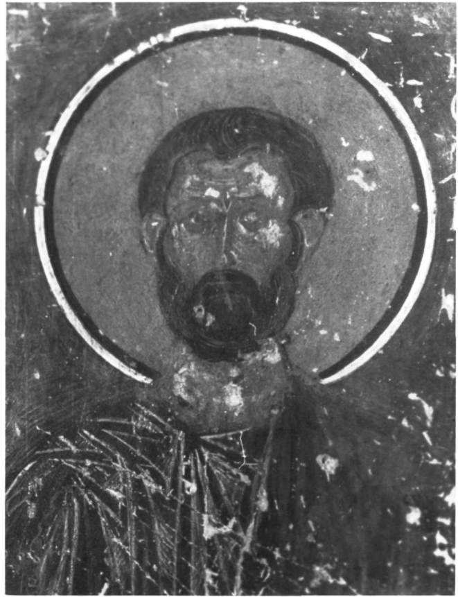
Εικ. 11. Ναός Ταξιαρχών. Ο άγιος Ιωακείμ.

Η αγία Άννα (Εικ. 9 και 10) κλίνει ελαφρά το κεφάλι προς τα αριστερά. Το φόρεμά της είναι κατάκοσμο (κακά διατηρημένο) και το μαφόριο κόκκινο. Πάνω στον κίτρινο προπλασμό του προσώπου οι σκιές δηλώνονται με καστανό και πράσινο χρώμα και τα φώτα με λεπτές λευκές γραμμές. Κρατάει σχεδόν ξαπλωμένη στην αγκαλιά της τη μικρή Παναγία. Η αγία Άννα με την Παναγία απαντάται στη βυζαντινή τέχνη υπό δύο εικονογραφικούς τύπος: είτε κρατώντας απλώς την Παναγία στην αγκαλιά της είτε θηλάζοντάς την 23 . Στην πρώτη περίπτωση, μέχρι και το 13ο αιώνα, εντοπίζονται παραδείγματα όπου η Παναγία, ντυμένη με χιτώ-