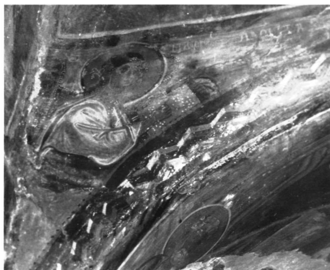
Εικ. 8. Ναός Ταξιαρχών. Το σύμβολο του ευαγγελιστή Ματθαίου.