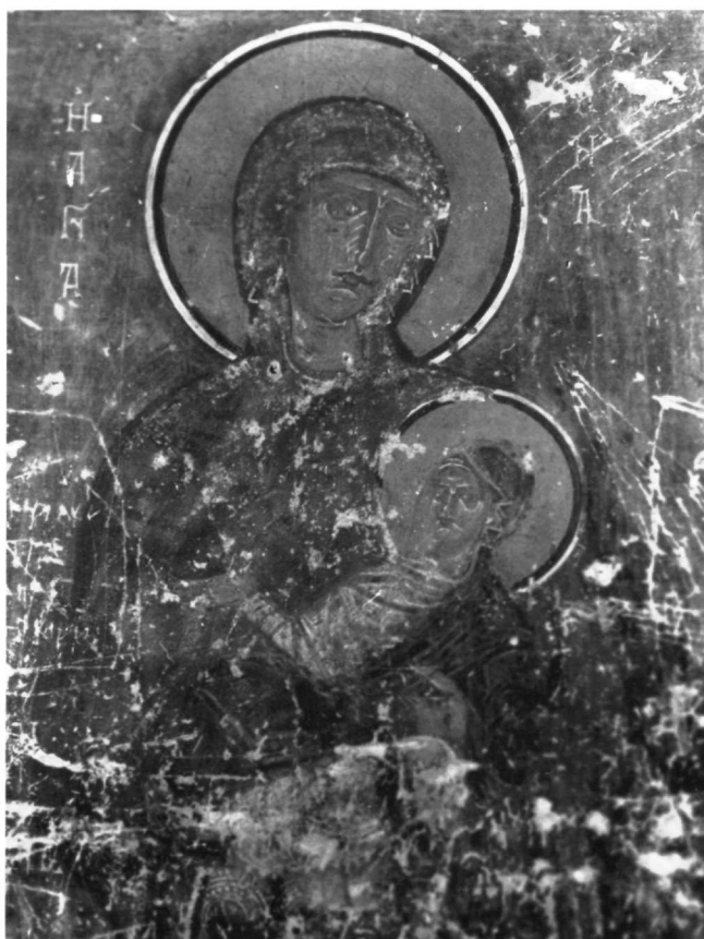
Εικ. 9. Ναός Ταξιαρχών. Η αγία Άννα με την Παναγία.