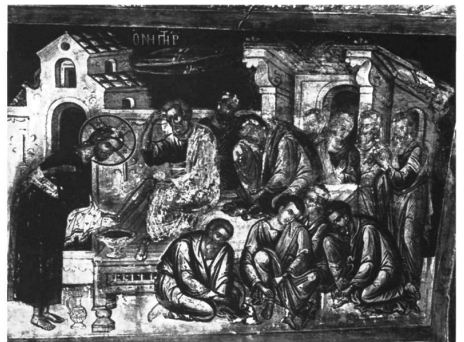
Εικ. 6. Μετέωρα, καθολικό μονής Αναπαυσά. Ο Νιπήρας.

Έτσι ο Μυστικός Δείπνος (Εικ. 3) του επιστυλίου της