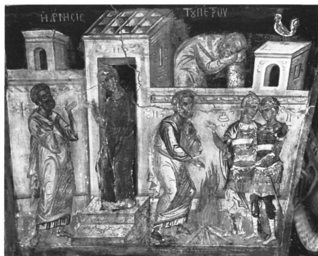
Εικ. 11. Επιστύλιο μονής Ιβήρων. Η Άρνηση του Πέτρου. Εικ. 12. Μετέωρα, καθολικό μονής Αναπαυσά. Η Άρνηση του Πέτρου.

Ειδικότερα η Κρίση των Αρχιερέων (Εικ. 10) του επιστυλίου της μονής Ιβήρων είναι ταυτόσημη στο γενικό εικονογραφικό και συνθετικό σχήμα, αλλά και στις λεπτομέρειες, με την ίδια παράσταση στη μονή Αναπαυσά (Εικ. 9) και στο καθολικό της μονής της Λαύρας 17 . Αξιοσημείωτο από την άποψη αυτή είναι η πανομοιότητα επανάληψη στο επιστύλιο και στο καθο-