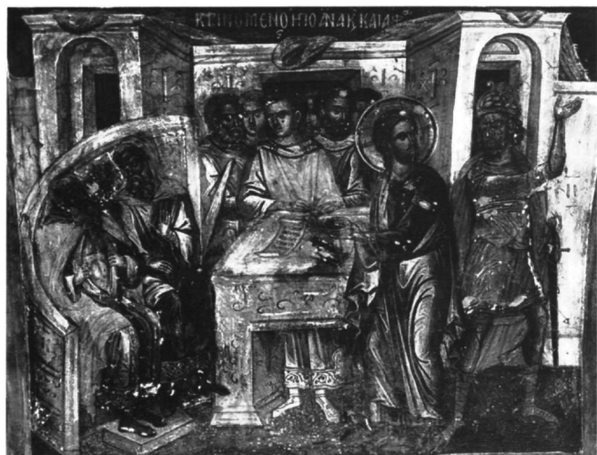
Εικ. 9. Μετέωρα, καθολικό μονής Αναπαυσά. Η Κρίση των Αρχιερέων.

τοιχογραφία του καθολικού της μονής της Λαύρας και κυρίως της μονής Σταυρονικήτα 15 , που αφορά όχι μόνο στην εικονογραφία και στη συγκρότηση της σκηνής, αλλά και στην επανάληψη των ίδιων εικονογραφικών τύπων, των καθιερωμένων από την παράδοση. Η μόνη ασήμαντη διαφορά είναι η στάση του δούλου πίσω από τον Χριστό, που στην εικόνα δεν είναι βίαιη, όπως στη μονή Σταυρονικήτα, αλλά σχεδόν συμβατική, όπως ακριβώς και στο καθολικό της μονής της Λαύρας. Στοιχείο επίσης κοινό στα δύο έργα, στο καθολικό της μονής της Λαύρας και στο επιστύλιο της μονής Ιθήρων, είναι ότι κανείς από την ομάδα που