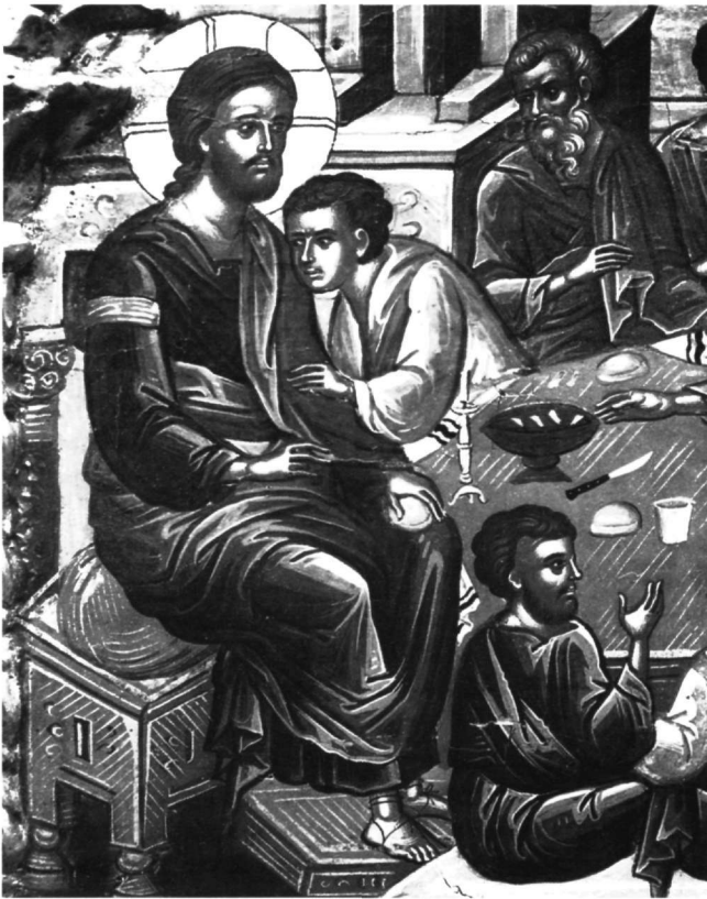
Εικ. 21-22. Επιστόλιο μονής Ιβήρων. Λεπτομέρειες από τον Μυστικό Δείπνο.