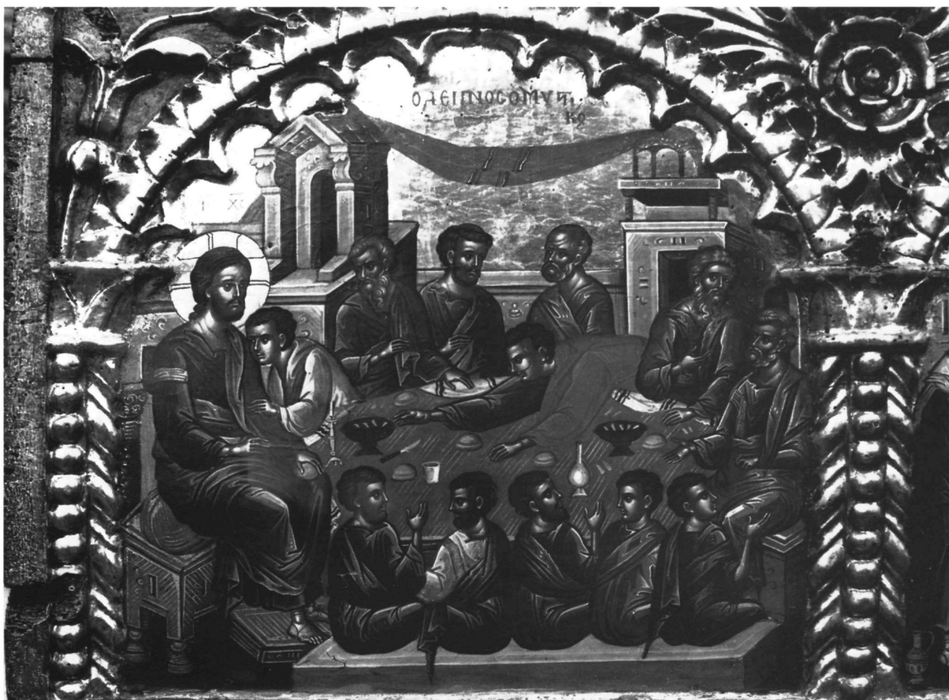
Εικ. 3. Επιστύλιο μονής Ιβήρων. Ο Μυστικός Δείπνος.

317-318, εικ. 17-24, Garidis, ό.π. (υποσημ. 4), σ. 139 και 140-158 σποράδην.