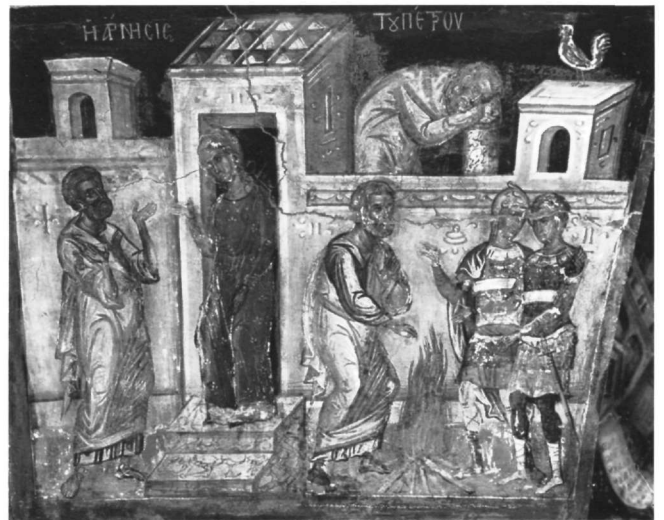
Εικ. 11. Επιστύλιο μονής Ιβήρων. Η Άρνηση του Πέτρου. Εικ. 12. Μετέωρα, καθολικό μονής Αναπαυσά. Η Άρνηση του Πέτρου.

Ειδικότερα η Κρίση των Αρχιερέων (Εικ. 10) του επιστυλίου της μονής Ιβήρων είναι ταυτόσημη στο γενικό εικονογραφικό και συνθετικό σχήμα, αλλά και στις λεπτομέρειες, με την ίδια παράσταση στη μονή Αναπαυσά (Εικ. 9) και στο καθολικό της μονής της Λαύρας 17 . Αξιοσημείωτο από την άποψη αυτή είναι η πανομοιότητα επανάληψη στο επιστύλιο και στο καθο-