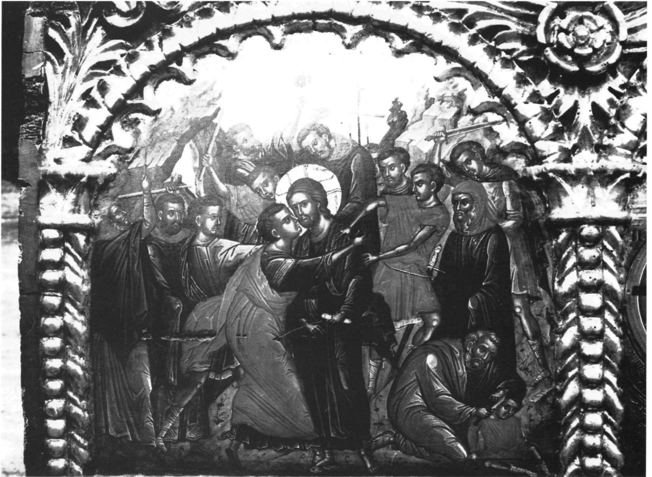
Εικ. 8. Επιστύλιο μονής Ιβήρων. Η Προδοσία του Ιούδα.

Έτσι, το σύμπλεγμα του Χριστού με τον απόστολο Πέτρο, η ομάδα των αποστόλων που σε πρώτο επίπεδο είναι γονατιστοί και λύνουν τα σανδάλια τους, καθώς και οι απόστολοι που εικονίζονται όρθιοι πίσω από το έδρανο, επαναλαμβάνονται πανομοιότυπα στο επιστύλιο και στα καθολικά των Μετεώρων και του Αγίου Όρους που αναφέραμε. Μόνο στην παράσταση του Αναπαυσά ο κατά κρόταφον απόστολος του πρώτου επιπέδου του επιστυλίου της μονής Ιβήρων εικονίζεται ενταγμένος στην ομάδα των αποστόλων του τρίτου επιπέδου.