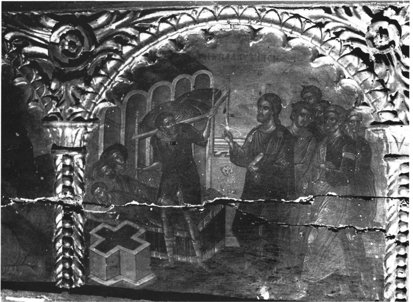
Εικ. 15. Επιστύλιο μονής Ιβήρων. Η Ίαση του Παραλύτου (προ των εργασιών συντηρήσεως).

Τέλος, στην Ίαση του Τυφλού (Εικ. 20), στην οποία αναγνωρίζονται βασικά στοιχεία της εικονογραφίας του καθολικού της μονής Αναπαυσά, επαναλαμβάνεται πιστά το εικονογραφικό σχήμα και η τυπολογία των μορφών της παράστασης του καθολικού της μονής Σταυρονικήτα 31 , με τη διαφορά ότι στην τοιχογραφία ο όμιλος των αποστόλων συμπύσσεται και οι μορφές έχουν αποκτήσει πιο ραδινές αναλογίες. Βασικό όμως στοιχείο, που διαφοροποιεί τις δύο σκηνές, είναι ότι στο επιστύλιο της μονής Ιβήρων έχει παραλειφθεί το αρχιτεκτόνημα, το οποίο στην τοιχογραφία εικονίζεται πίσω από τον ορεινό όγκο, και στη θέση του έχει αναπτυχθεί φυσικό τοπίο, με κτίσματα δυτικής εμπνεύσεως. Το στοιχείο αυτό, που εισάγεται διακριτικά στο επιστύλιο, δεν είναι ξένο προς τη ζωγραφική του Θεοφάνη, καθώς το ίδιο ακριβώς θέμα παρατηρείται στην τοιχογραφία του Χριστού με τη Σαμαρείτιδα στο καθολικό της μονής Σταυρονικήτα 32 .