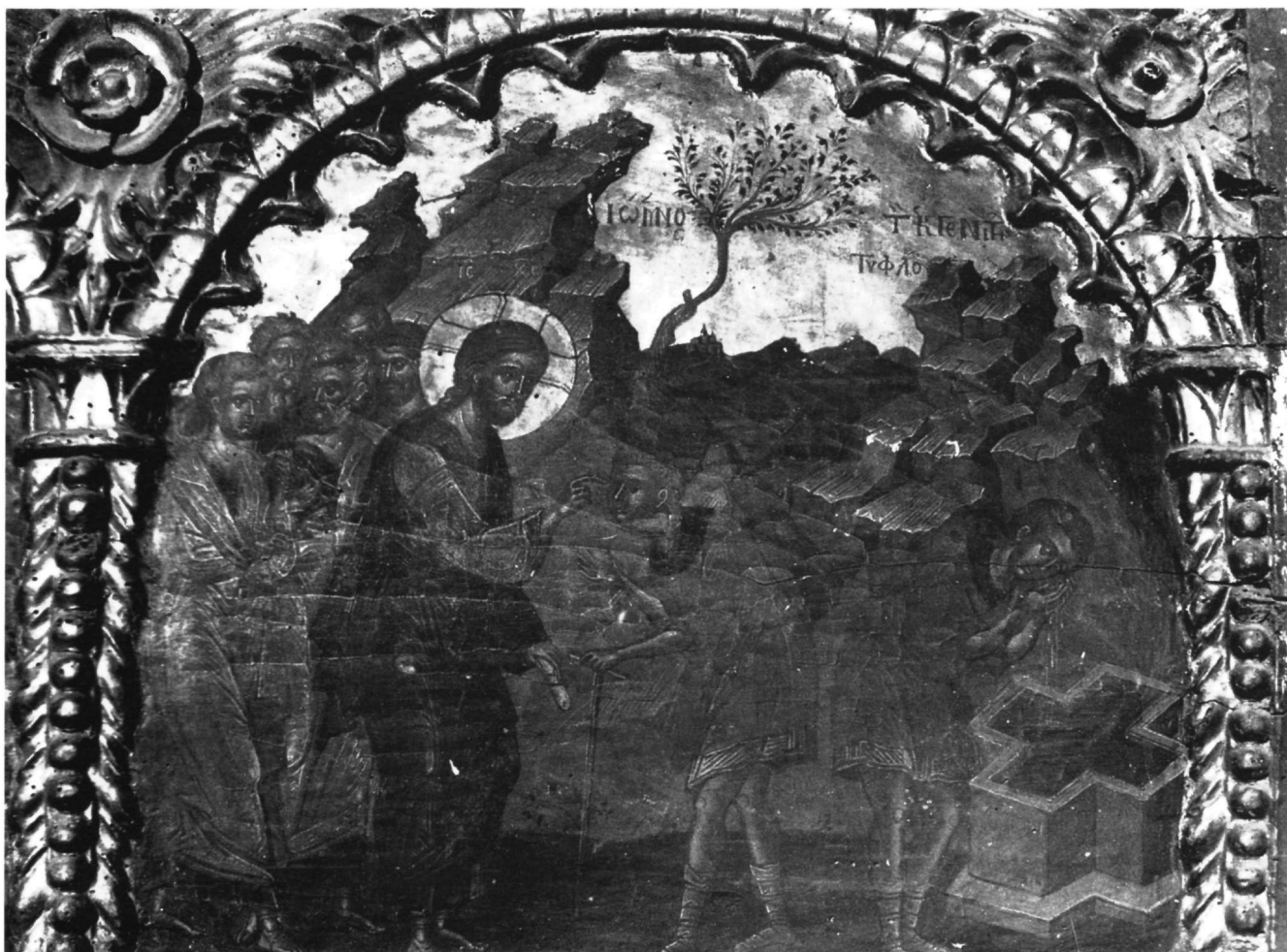
Εικ. 20. Επιστύλιο μονής Ιβήρων. Η Ίαση του εκ γενετής Τυφλού (προ των εργασιών συντηρήσεως).

Ακόμα, στο επιστύλιο της μονής Ιβήρων έχουν επισημανθεί στοιχεία δυτικής εικονογραφίας και τέχνης που απαντούν σε ορισμένες παραστάσεις. Από εικονογραφική άποψη τα στοιχεία αυτά είναι η ανοιχτή δεξιά πλευρά με το τραύμα της λόγχης στον Χριστό στη σκηνή της Απιστίας του Θωμά και στο Χαίρε των Μυροφόρων 38 . Από τεχνοτροπική άποψη τα δυτικά στοιχεία του επιστυλίου είναι επίσης περιορισμένα και αφορούν στο ζωγραφικό ή γλυπτικό χαρακτήρα του ρούχου της Μαρίας Μαγδαληνής και της Παναγίας αντίστοιχα στο Χαίρε των Μυροφόρων 39 , καθώς και σε ορισμένα στοιχεία τοπίου, με προοπτική φυγής, ιταλικής καταγωγής, τα οποία εισάγει διακριτικά ο καλλιτέχνης σε δευτερεύουσες παραστάσεις, όπως στο Χαίρε των Μυροφόρων (Εικ. 14) και στην Ίαση του Τυφλού 40 (Εικ. 20). Ιδιαίτερα στην Ίαση του Τυφλού ο καλλιτέχνης έχει εντάξει στο βάθος ένα ειδυλλιακό