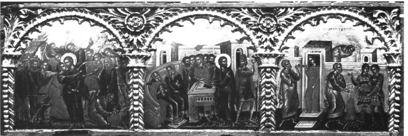
Εικ. 2. Επιστύλιο μονής Ιβήρων. Προδοσία του Ιούδα, Κρίση των Αρχιερέων, Άρνηση του Πέτρου.

έργου του ακαδημαϊκός Μαν. Χατζηδάκης, φορέας στα μεγάλα αυτά μοναστηριακά κέντρα της τουρκοκρατούμενης ηπειρωτικής Ελλάδος κατά το δεύτερο τέταρτο του 16ου αιώνα «μιας υψηλής ποιότητας καλλιτεχνικής παράδοσης καλλιεργημένης στην ενετοκρατούμενη Κρήτη» από το 15ο αιώνα 5 .