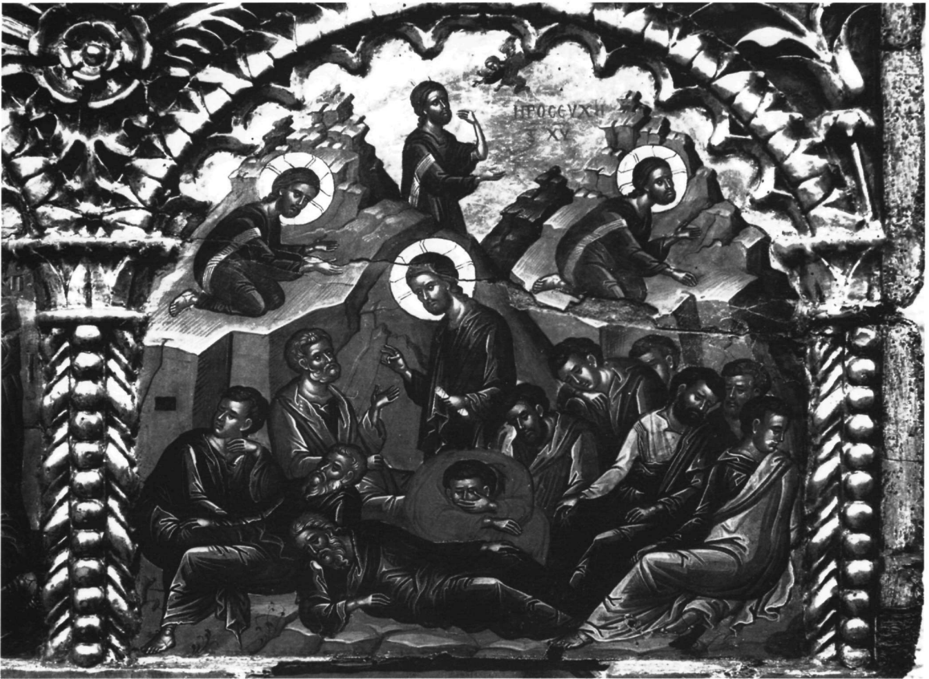
Εικ. 7. Επιστύλιο μονής Ιβήρων. Η Προσευχή στο Όρος των Ελαιών.

μονής Ιβήρων έχει ένα εικονογραφικό σχήμα ταυτόσημο μ' αυτό του Μυστικού Δείπνου της μονής Αναπαυσά (Εικ. 4), αλλά και του καθολικού της μονής Σταυρονικήτα 11 . Η διάταξη του Χριστού και των αποστόλων γύρω από το τραπέζι, οι στάσεις, οι χειρονομίες και οι μεταξύ τους σχέσεις είναι πανομοιότυπες στα τρία αυτά έργα. Μόνο ο Χριστός στο Μυστικό Δείπνο της μονής Σταυρονικήτα δεν στρέφεται προς τον Ιωάννη, όπως συμβαίνει στο καθολικό της μονής Αναπαυσά και στο επιστύλιο της μονής Ιβήρων, αλλά εικονίζεται σχεδόν μετωπικά, κρατώντας κλειστό ειλητήριο και όχι άρτο.