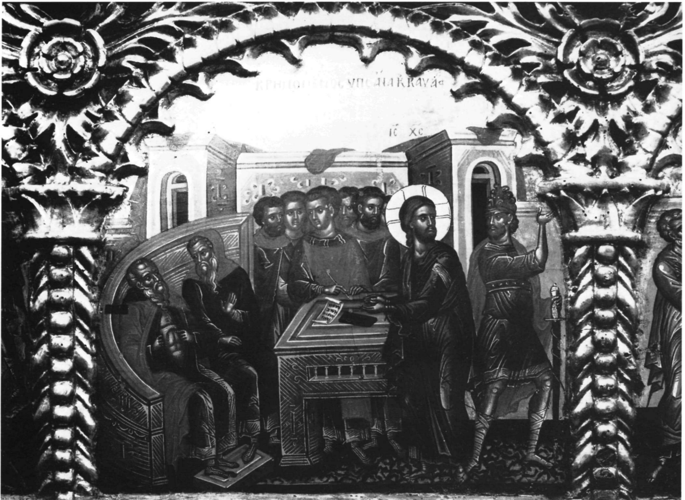
Εικ. 10. Επιστύλιο μονής Ιθήρων. Η Κρίση των Αρχιερέων.