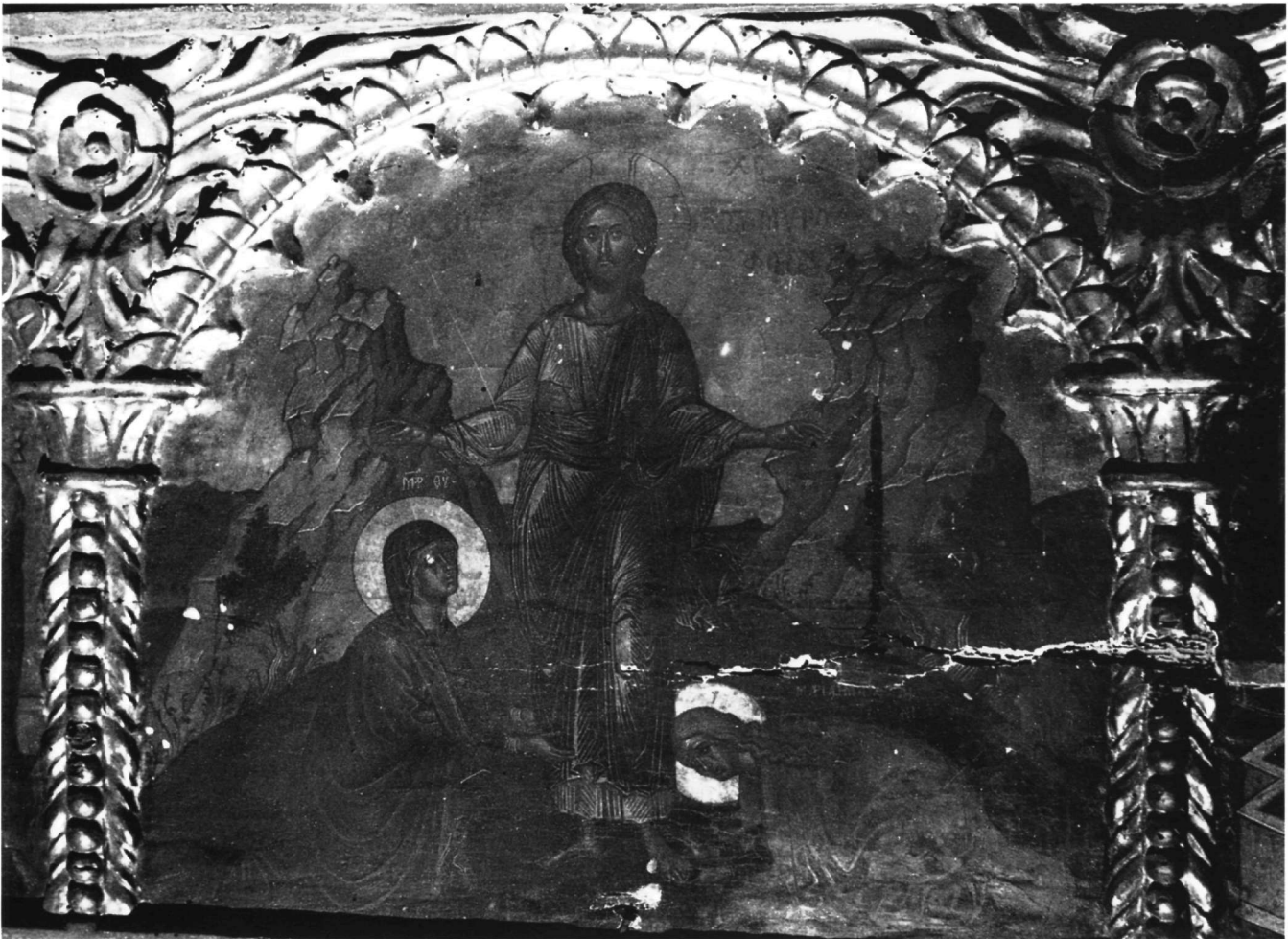
Εικ. 14. Επιστύλιο μονής Ιβήρων. Το Χαίρει των Μυροφόρων (προ των εργασιών συντηρήσεως).

της μονής Αναπαυσά (Εικ. 19) και του καθολικού της μονής Σταυρονικήτα 26 , αλλά δημιουργεί μια σύνθεση πιο σφιχτή, καθώς μετατοπίζει τους αποστόλους αριστερά, πίσω από τον Χριστό και από τον αριστερό βράχο, και τοποθετεί πίσω και ανάμεσα στις κορυφές των δύο ορεινών όγκων τα τείχη της πόλεως. Ακόμα, στην παράσταση του επιστυλίου της μονής Ιβήρων περιορίζονται ορισμένα δυτικά στοιχεία στην ανάπτυξη του τοπίου, που απεικονίζονται στην τοιχογραφία της μονής Σταυρονικήτα 27 . Αυτά σχετίζονται με τη θέση και τη μορφή του φυσικού τοπίου, με προοπτική φυγής, που απεικονίζεται στο βάθος, πίσω από τους ορεινούς όγκους, αλλά και με το απότομο κόψιμο του εδάφους σε πρώτο επίπεδο, που υπάρχει στην τοιχογραφία, αλλά όχι στο επιστύλιο της μονής Ιβήρων. Το τελευταίο αυτό στοιχείο, που παρατηρείται επίσης και στη ζωγραφική του Θεοφάνη στη μονή Αναπαυσά 28 ,