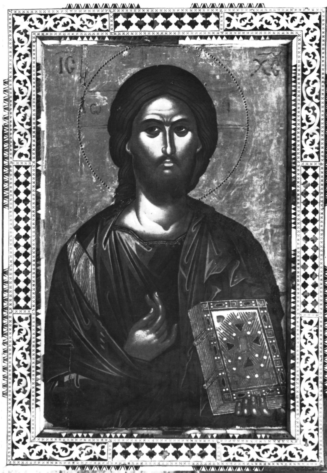
Εικ. 29. Μονή Ιβήρων. Εικόνα του Χριστού.