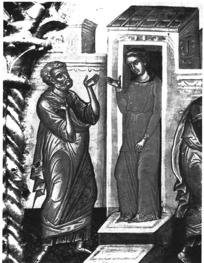
Εικ. 25-26. Επιστύλιο μονής Ιβήρων. Λεπτομέρειες από την Προσευχή στο Όρος των Ελαιών.