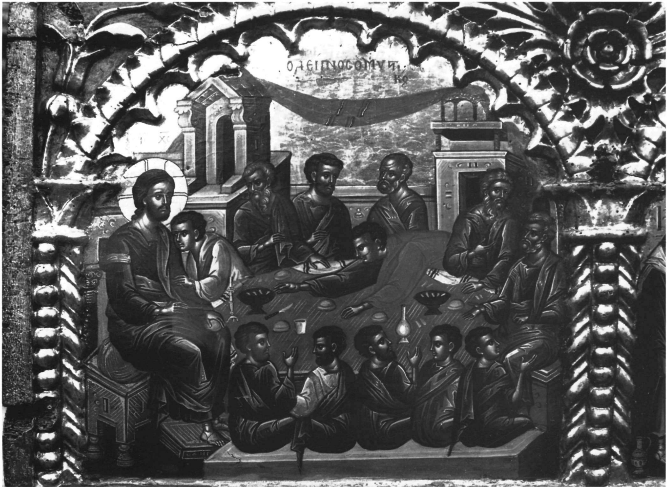
Εικ. 3. Επιστύλιο μονής Ιβήρων. Ο Μυστικός Δείπνος.

317-318, εικ. 17-24, Garidis, ό.π. (υποσημ. 4), σ. 139 και 140-158 σποράδην.