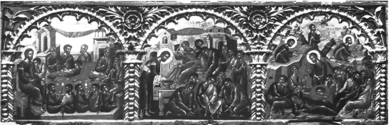
Εικ. 1. Επιστύλιο μονής Ιβήρων. Μυστικός Δείπνος, Νιπήρας, Προσευχή στο Όρος των Ελαιών.