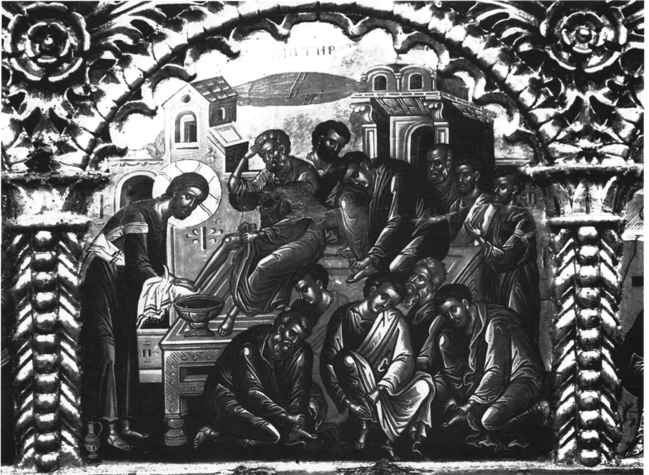
Εικ. 5. Επιστύλιο μονής Ιβήρων. Ο Νιπήρας.

επιγραφικά ή αρχαιικά στοιχεία αποδίδονται ανα- ντίρρητα στον Θεοφάνη.