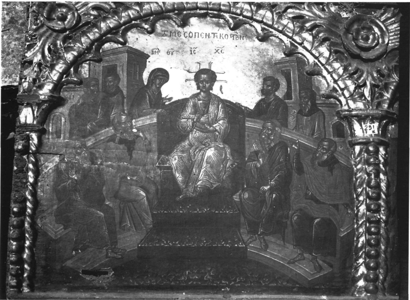
Εικ. 16. Επιστύλιο μονής Ιβήρων. Η Μεσοπεντηκοστή.