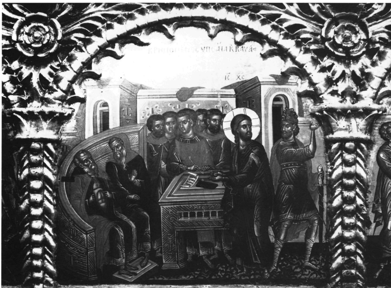
Εικ. 10. Επιστύλιο μονής Ιθήρων. Η Κρίση των Αρχιερέων.