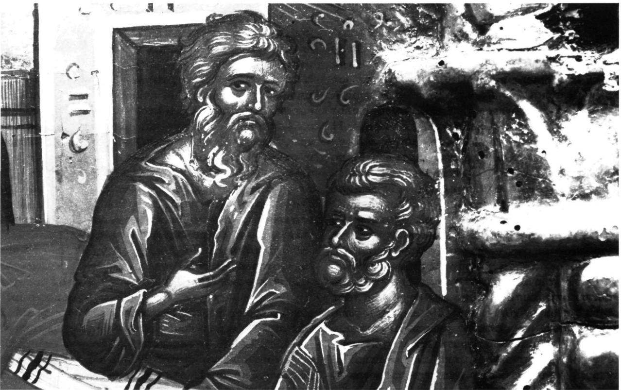
Εικ. 23-24. Επιστόλιο μονής Ιβήρων. Λεπτομέρειες από τον Νιπήρα.