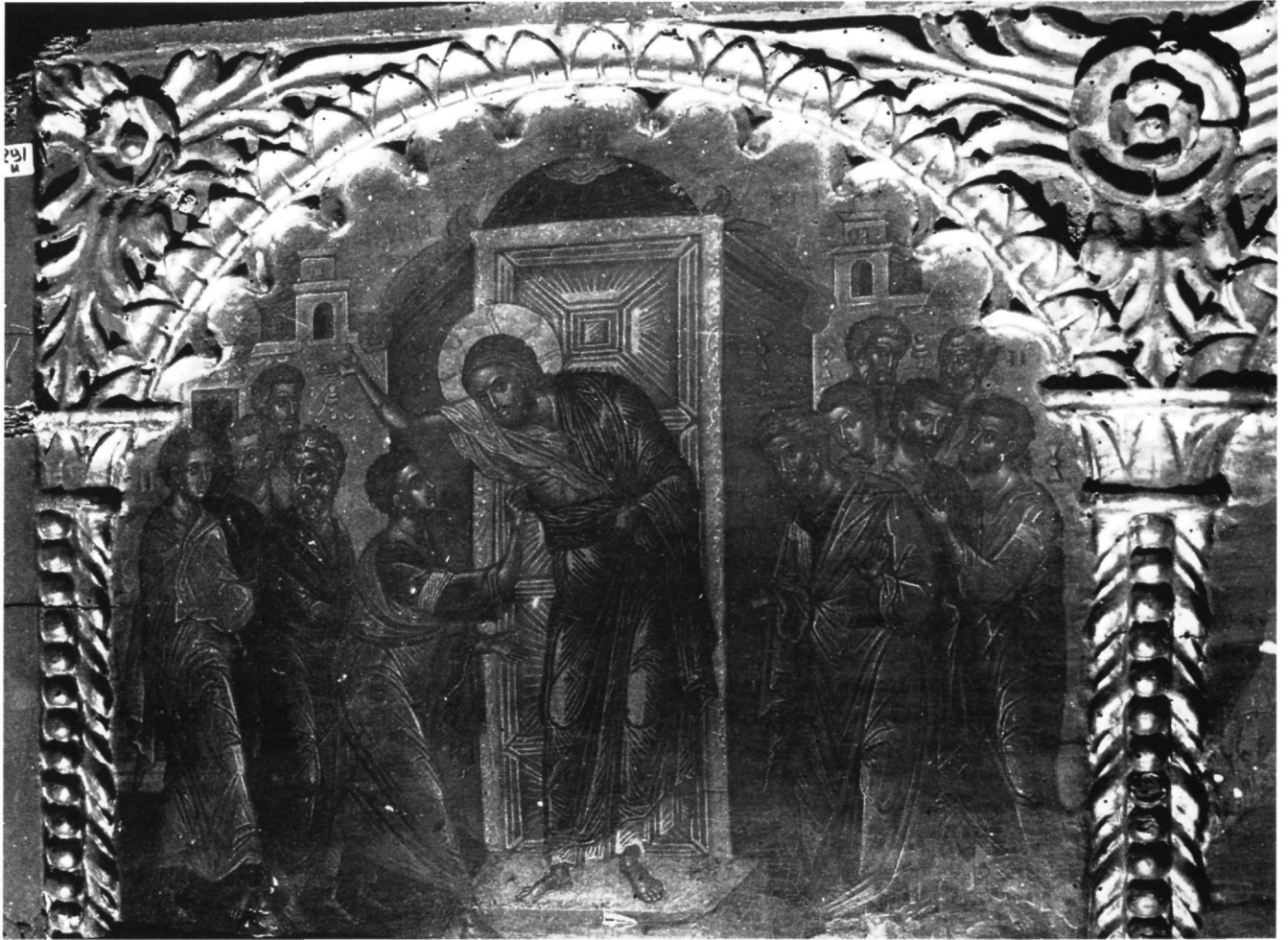
Εικ. 13. Επιστύλιο μονής Ιβήρων. Η Απιστία του Θωμά (προ των εργασιών συντηρήσεως).

(Εικ. 19) και στο καθολικό της μονής Σταυρονικήτα 24 , με μόνη τη διαφορά ότι στο επιστύλιο ο όμιλος των αποστόλων που συνοδεύει τον Χριστό είναι περισσότερο ανεπτυγμένος.