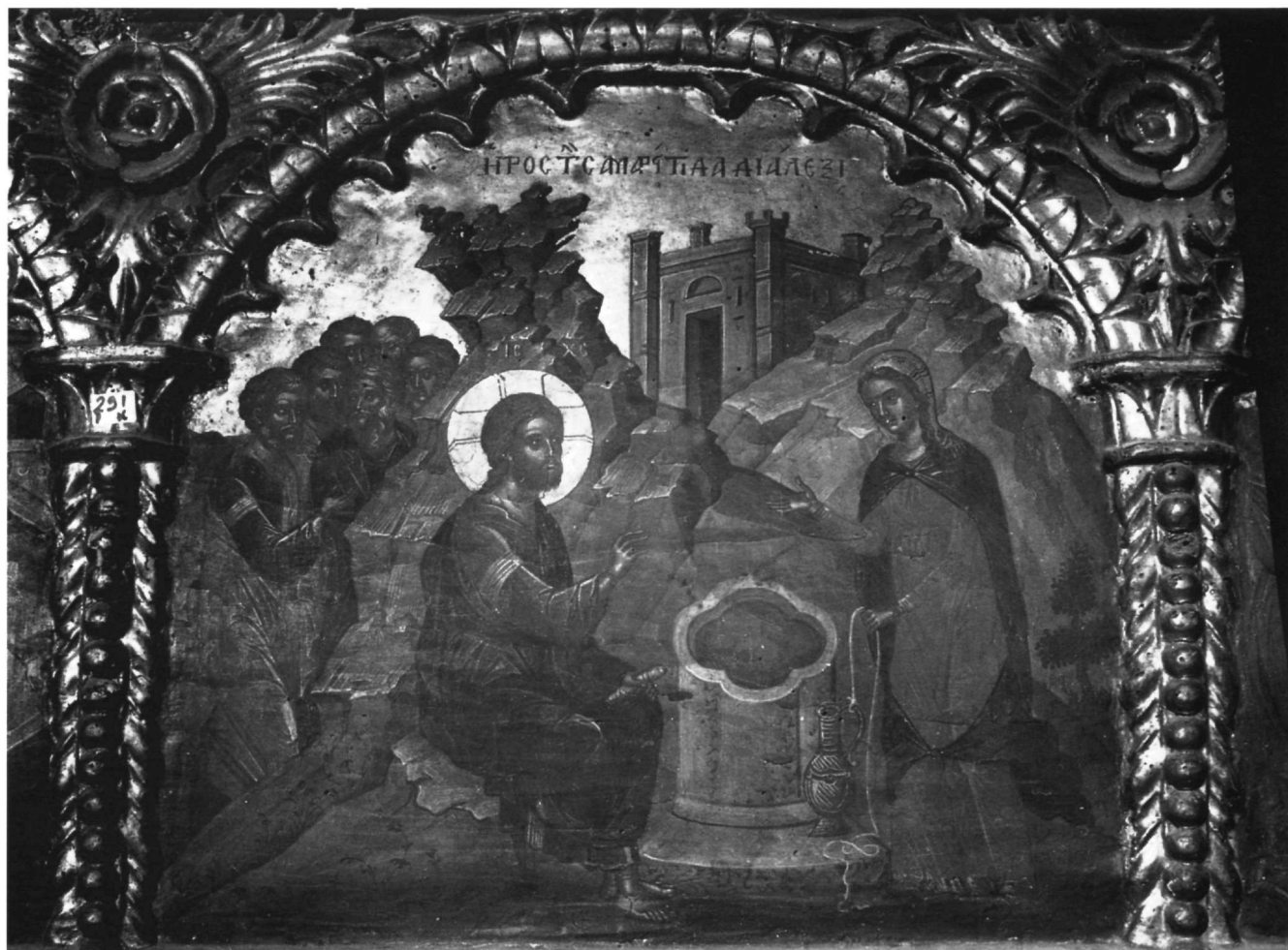
Εικ. 18. Επιστύλιο μονής Ιβήρων. Η Σαμαρείτιδα με τον Χριστό.

Ιδιαίτερα η κλειστή και στέρεη σύνθεση των σκηνών του επιστυλίου (βλ. κυρίως Εικ. 3, 5, 7 και 8), με την ισόρροπη και σύμμετρη διάταξη των μορφών γύρω από το κεντρικό πρόσωπο της παράστασης, η ανταποδοτικότητα των στάσεων και των κινήσεων, που υπακούουν σ' ένα κυματιστό, γαλήνιο ρυθμό που συνέχει τις μορφές και τις εντάσσει αρμονικά στη σύνθεση, η χρωματική ευαισθησία και η εναλλαγή των χρωμάτων, που υποτάσσεται στο ανταποδοτικό πνεύμα που διακρίνει τις σκηνές, είναι χαρακτηριστικά που έχουν αποδοθεί στη συνθετική δύναμη και αρετή του Θεοφάνη, του μεγάλου αυτού καλλιτέχνη, που αφομοίωσε δημιουργικά και εμπλούτισε με το ταλέντο του τις κατακτήσεις της κρητικής σχολής του 15ου αιώνα 34 .