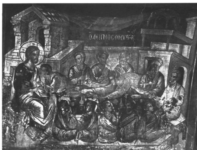
Εικ. 4. Μετέωρα, καθολικό μονής Αναπαυσά. Ο Μυστικός Δείπνος.

9. Για τα επιστύλια της μονής Λαύρας και της μονής Σταυρονικήτα βλ. Chatzidakis, Théophane, ό.π. (υποσημ. 4), σ. 323-327, εικ. 34-45 και 63-83. Για το επιστύλιο της μονής Σταυρονικήτα βλ. Πατρινέλης - Καρακατσάνη - Θεοχάρη, ό.π., σ. 57-60, εικ. έγχρ. 15-29. Η Καρακατσάνη, ό.π., σ. 57-58, διαχωρίζει το επιστύλιο του καθολικού της μονής της Λαύρας από το έργο του Θεοφάνη. Πολύ καλές έγχρωμες απεικονίσεις των εικόνων του επιστυλίου της μονής Σταυρονικήτα βλ. Το Δωδεκάορτο της Ιεράς Μονής Σταυρονικήτα (λεύκωμα των εικόνων που εκδόθηκε από την ιερά μονή). Θα πρέπει να σημειώσουμε ότι από το επιστύλιο της Λαύρας σώζονται έντεκα εικόνες Δωδεκαόρτου, από τις οποίες θεματικά καμιά δεν ανταποκρίνεται στις εικόνες του επιστυλίου της μονής Ιβήρων. Στις εικόνες του επιστυλίου της Λαύρας μπορεί να ενταχθεί ακόμα μία εικόνα, της Κοιμήσεως της Θεοτόκου, που καθαρίστηκε το καλοκαίρι το 1991 από συνεργείο του ΥΠΠΟ. Από το επιστύλιο της μονής Σταυρονικήτα σώζονται είκοσι τρεις εικόνες, από τις οποίες μόνο η εικόνα της εμφανίσεως του Χριστού στις Μυροφόρες και η εικόνα της Απιστίας του Θωμά έχουν θεματική αντιστοιχία με το επιστύλιο της μονής Ιβήρων.