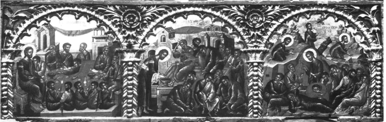
Εικ. 1. Επιστύλιο μονής Ιβήρων. Μυστικός Δείπνος, Νιπήρας, Προσευχή στο Όρος των Ελαιών.