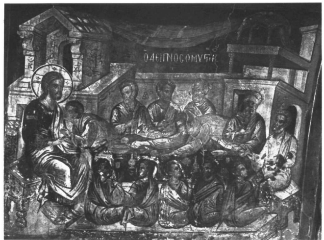
Εικ. 4. Μετέωρα, καθολικό μονής Αναπαυσά. Ο Μυστικός Δείπνος.

9. Για τα επιστύλια της μονής Λαύρας και της μονής Σταυρονικήτα βλ. Chatzidakis, Théophane, ό.π. (υποσημ. 4), σ. 323-327, εικ. 34-45 και 63-83. Για το επιστύλιο της μονής Σταυρονικήτα βλ. Πατρινέλης - Καρακατσάνη - Θεοχάρη, ό.π., σ. 57-60, εικ. έγχρ. 15-29. Η Καρακατσάνη, ό.π., σ. 57-58, διαχωρίζει το επιστύλιο του καθολικού της μονής της Λαύρας από το έργο του Θεοφάνη. Πολύ καλές έγχρωμες απεικονίσεις των εικόνων του επιστυλίου της μονής Σταυρονικήτα βλ. Το Δωδεκάορτο της Ιεράς Μονής Σταυρονικήτα (λεύκωμα των εικόνων που εκδόθηκε από την ιερά μονή). Θα πρέπει να σημειώσουμε ότι από το επιστύλιο της Λαύρας σώζονται έντεκα εικόνες Δωδεκαόρτου, από τις οποίες θεματικά καμιά δεν ανταποκρίνεται στις εικόνες του επιστυλίου της μονής Ιβήρων. Στις εικόνες του επιστυλίου της Λαύρας μπορεί να ενταχθεί ακόμα μία εικόνα, της Κοιμήσεως της Θεοτόκου, που καθαρίστηκε το καλοκαίρι το 1991 από συνεργείο του ΥΠΠΟ. Από το επιστύλιο της μονής Σταυρονικήτα σώζονται είκοσι τρεις εικόνες, από τις οποίες μόνο η εικόνα της εμφανίσεως του Χριστού στις Μυροφόρες και η εικόνα της Απιστίας του Θωμά έχουν θεματική αντιστοιχία με το επιστύλιο της μονής Ιβήρων.