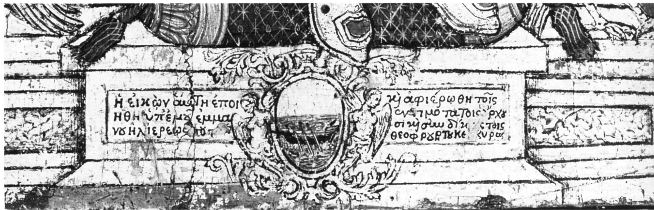
Εικ. 5. Αθήνα. Βυζαντινό Μουσείο. Η αφιερωματική επιγραφή της εικόνας της αγίας Θεοδώρας.