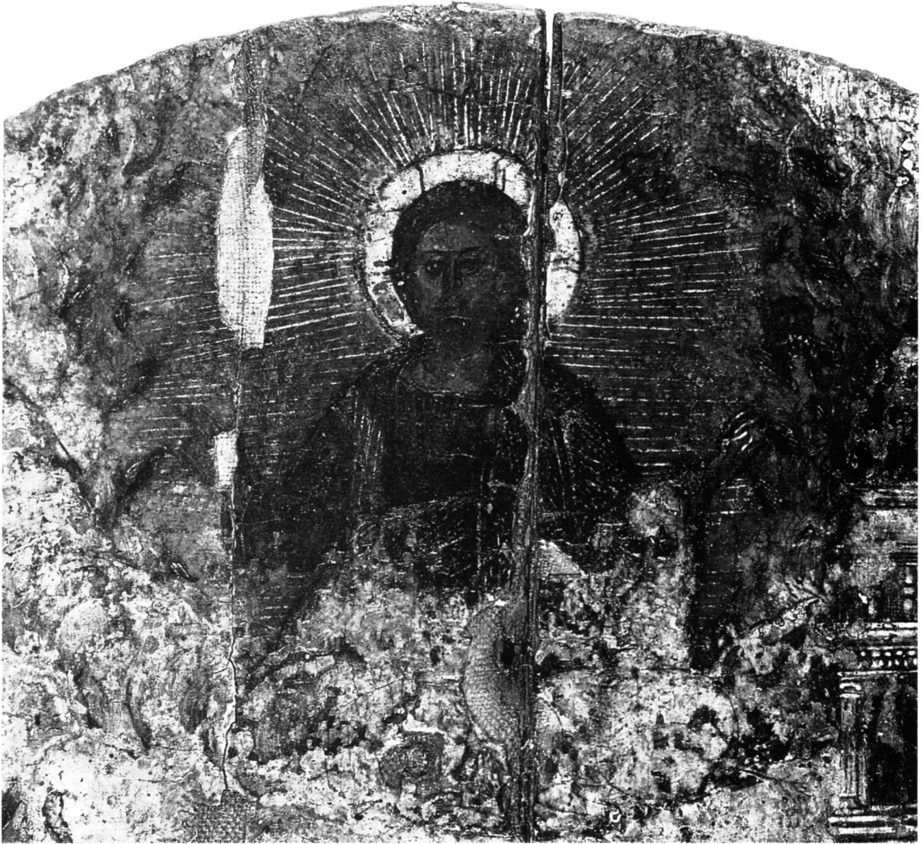
Εικ. 2. Ο Χριστός Παντοκράτωρ. Λεπτομέρεια της εικόνας με την παράσταση της εκκλησίας του Αγίου Γεωργίου των Ελλήνων.

του αγίου Νικολάου και στους χιτώνες του Χριστού και του δεξιού αγγέλου. Ενδιαφέρον παρουσιάζουν και τα μικροσκοπικά αγγελάκια, τα μισοκρυμμένα μέσα στα σύννεφα που περιβάλλουν τον Χριστό, ζωγραφισμένα τα περισσότερα από κόκκινη λάκα κατά τρόπο τελείως σχηματικό. Ο κάμπος της παράστασης είναι από στιλβωτό χρυσό με μπόλο σκούρο πορτοκαλί. Οι άψογα εκτελεσμένες χρυσοκοντυλιές έχουν γίνει με φύλλο χρυσού και την τεχνική της μίχιση, κατά τον τρόπο πιθανώς που περιγράφεται στην Ερμηνεία του Διονυσίου