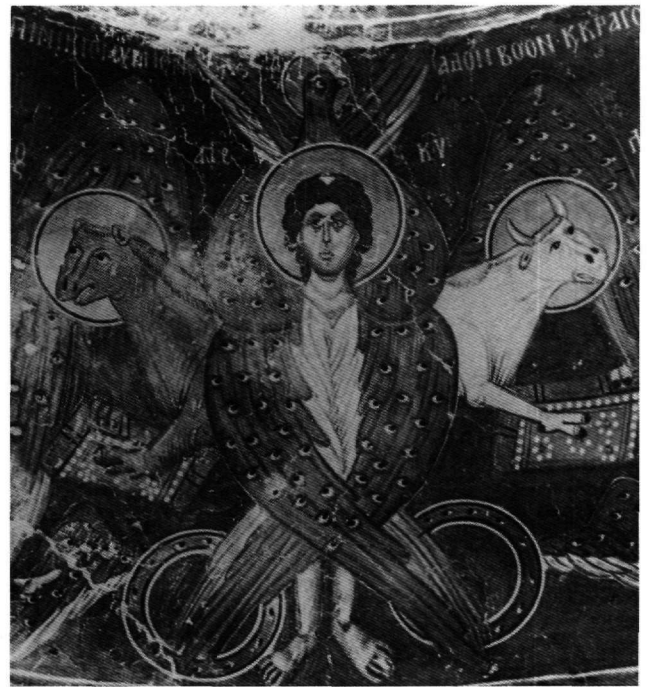
Εικ. 7. Πελέντρι Κύπρου, ναός του Τιμίου Σταυρού. Τετράμορφο χερουβείμ στον τρούλλο.

Στις τριγωνικές ἐπιφάνειες που δημιουργούνται στα σημεία διασταύρωσης με την κατὰ μήκος καμάρα του σταυρεπίστεγου ναοῦ των Ταξιαρχῶν στο Κρανίδι Αργολίδας (περί τα μέσα του 13ου αι.) εικονίζονται τα σύμβολα των ευαγγελιστών που ταυτίζονται με επιγραφές: ο ἄγγελος με τον ευαγγελιστὴ Ματθαῖο (στο βορειοανατολικό τρίγωνο), ο λέων με το Μάρκο, ο μόσχος με το Λουκά και ο αετός με τον Ἰωάννη (η ἀντιστοιχία αὐτή ἀκολουθεῖ την τάξη του Επιφανίου