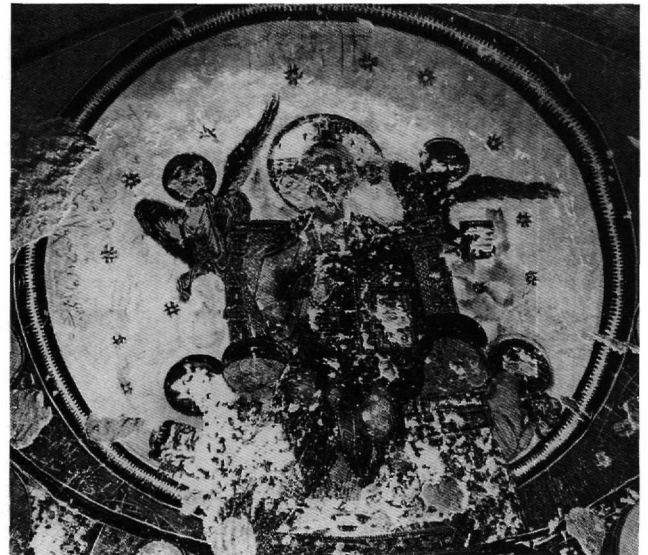
Εικ. 3. Μπαουίτ Αιγύπτου, παρεκκλήσιο αριθ. 51. Ο Χριστός εν δόξῃ στην αψίδα, λεπτομέρεια.