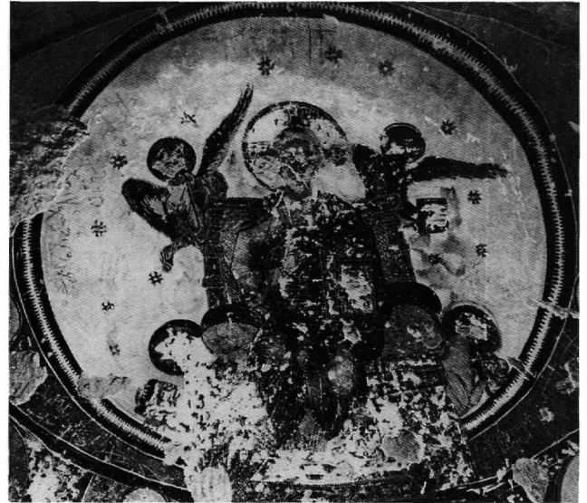
Εικ. 3. Μπαουίτ Αιγύπτου, παρεκκλήσιο αριθ. 51. Ο Χριστός εν δόξῃ στην αψίδα, λεπτομέρεια.