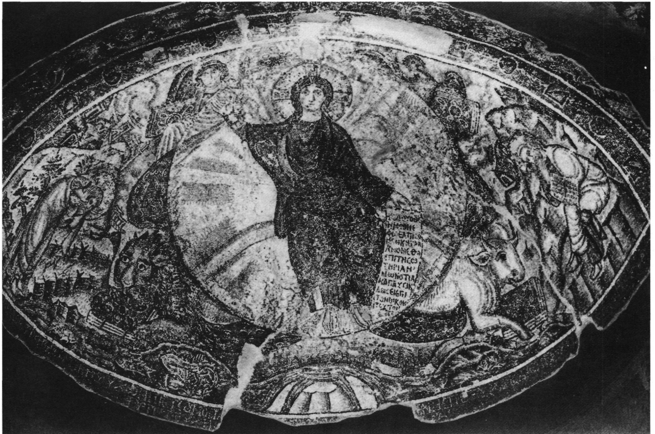
Εικ. 1. Θεσσαλονίκη, Όσιος Δαβίδ ή μονή Λατόμου, ψηφιδωτό αγίδας. Όραμα προφητών.

Στους πλαϊνούς τοίχους του ιερού στον Άγιο Βιτάλιο της Ραβέννας (6ος αι.) τα σύμβολα των ευαγγελιστών, ολόσωμα, συνοδεύουν τις ίδιες τις μορφές των ευαγγελιστών, συνδεόμενα ο αετός με τον Ιωάννη, ο άγγελος με το Ματθαίο, ο λέων με το Μάρκο, ο μόσχος με το Λουκά κατά την τάξη του Επιφανίου της Κύπρου 6 . Εντάσσονται στο γενικό πρόγραμμα διακόσμησης του ιερού που έχει ως κεντρικό θέμα το μυστήριο της θείας ευχαριστίας.