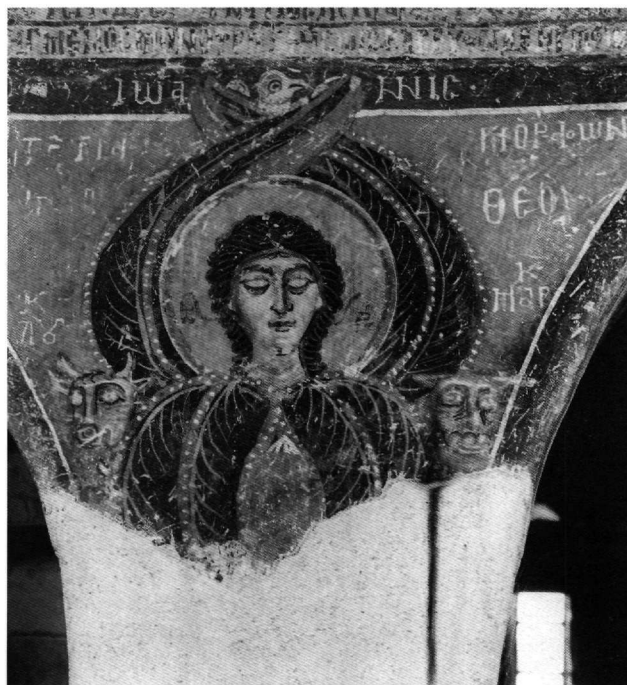
Εικ. 8. Αττική, Άγιος Πέτρος Καλυβίων Κουβαρά. Τετράμορφο χερουβείμ στο νάρθηκα.