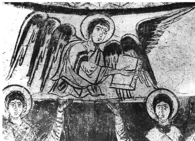
Εικ. 6. Άγγελος, σύμβολο ευαγγελιστή, λεπτομέρεια της Εικ. 5.

17. M. Restle, Byzantine Wall Paintings in Asia Minor , Recklinghausen 1967, I, σ. 139, III, πίν. XXVIII, 333-335. J. Lafontaine-Dosogne, Théophanies-visions auxquelles participent les prophètes dans l'art byzantin après la restauration des images , Synthronon, Paris 1968, εικ. 1.