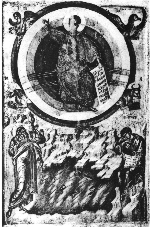
Εικ. 2. Αρχαιολογικό Μουσείο Σόφιας. Πρόσθια όψη αμφιπρόσωπης εικόνας: 'Όραμα των προφητών Ιεζεκιήλ και Αββακούμ.

11. Grabar, ό.π., σ. 847 κ.ε. και Xyngopoulos, ό.π., σ. 341 κ.ε.