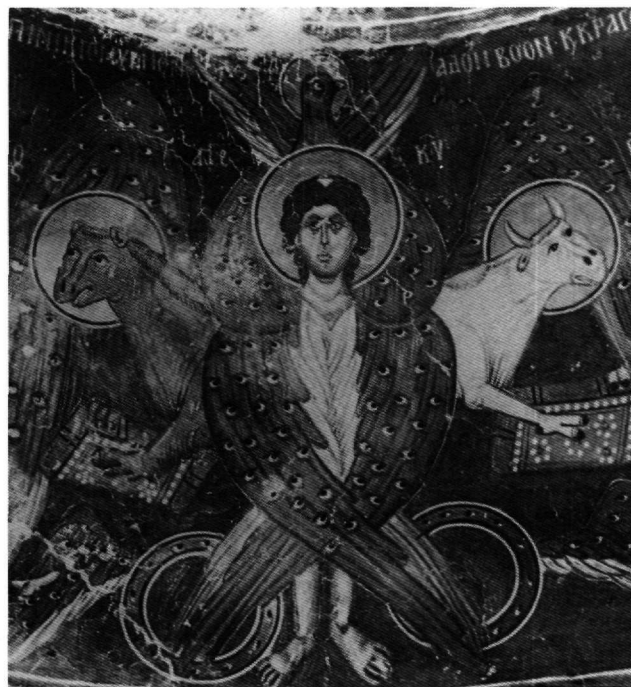
Εικ. 7. Πελέντρι Κύπρου, ναός του Τιμίου Σταυρού. Τετράμορφο χερουβεῖμ στον τρούλλο.

Στις τριγωνικές ἐπιφάνειες που δημιουργούνται στα σημεία διασταύρωσης με την κατὰ μήκος καμάρα του σταυρεπίστεγου ναοῦ των Ταξιαρχῶν στο Κρανίδι Αργολίδας (περί τα μέσα του 13ου αι.) εικονίζονται τα σύμβολα των ευαγγελιστών που ταυτίζονται με επιγραφές: ο ἄγγελος με τον ευαγγελιστὴ Ματθαῖο (στο βορειοανατολικὸ τρίγωνο), ο λέων με το Μάρκο, ο μόσχος με το Λουκά και ο αετός με τον Ἰωάννη (η ἀντιστοιχία αὐτὴ ἀκολουθεῖ την τάξη του Επιφανίου