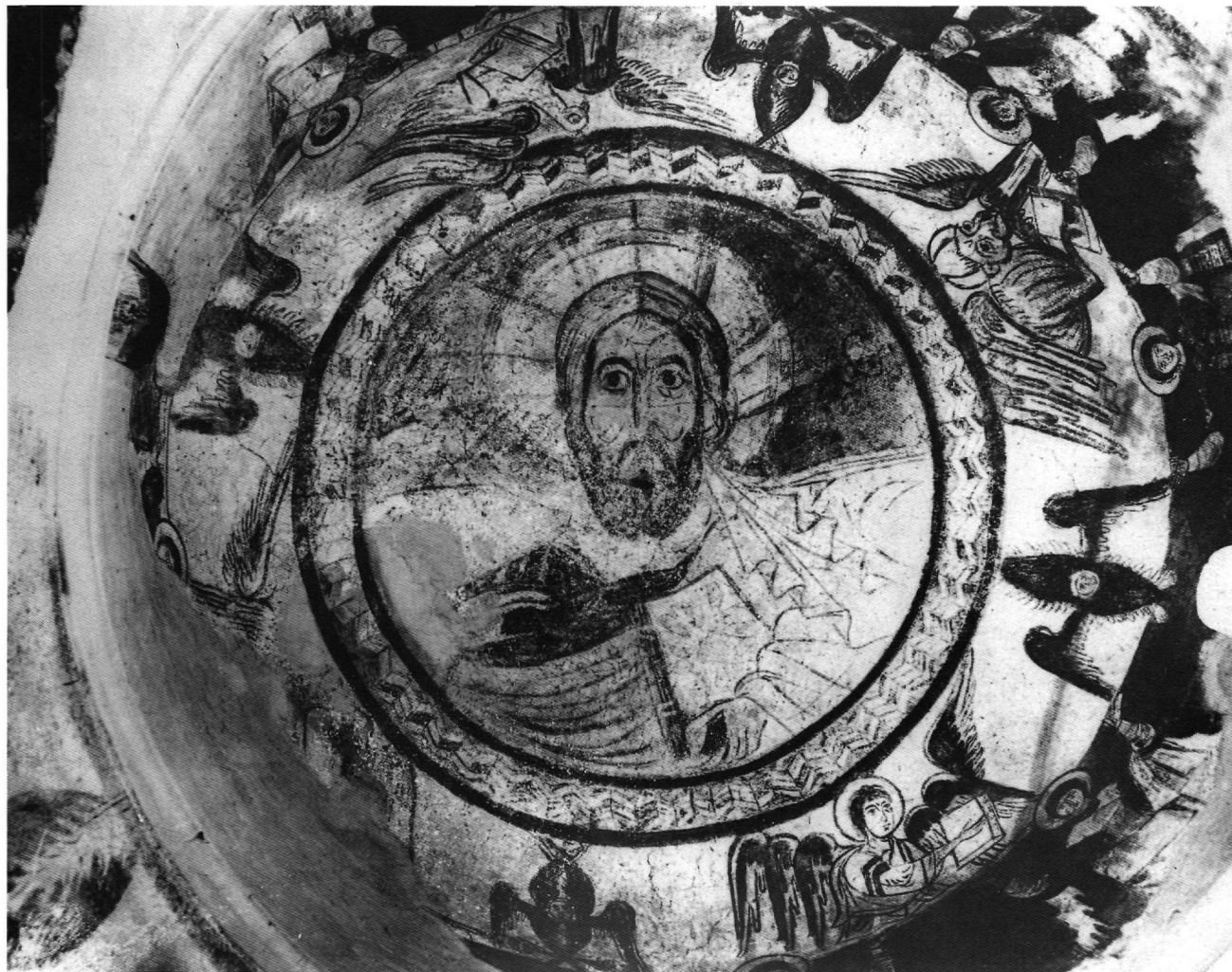
Εικ. 5. Κορωπί Αττικής, ναός του Σωτήρος. Τοιχογραφία του τρούλλου.