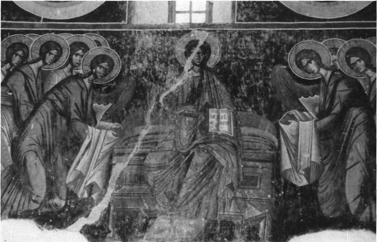
Fig. 1. Akhali Šouamta. Le Christ Emmanuel entouré d'anges.