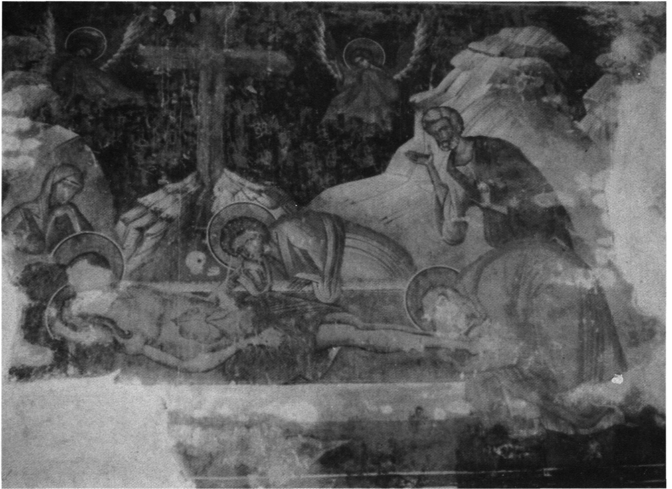
Fig. 4. Akhali Šouamta. Thrène.

dans diverses autres parties de l'église qui ne sont pas spécialement proches du chœur. Autrement dit, l'emplacement de l'Annonciation à Gremi représente un rapprochement avec les programmes byzantins classiques. Comme à Zarzma (XIVe s.), où il s'agissait d'une innovation, le Pantocrator (détruit) figurait au centre de la coupole. La Dormition décore le mur Ouest. Une curiosité distingue cette composition, puisque ce n'est pas la petite personification de l'âme de la Vierge qui est ailée, comme on le voit parfois dans les Balkans à l'époque des Paléologues, notamment à la Péribleptos à Ohrid 13 , mais le Christ.