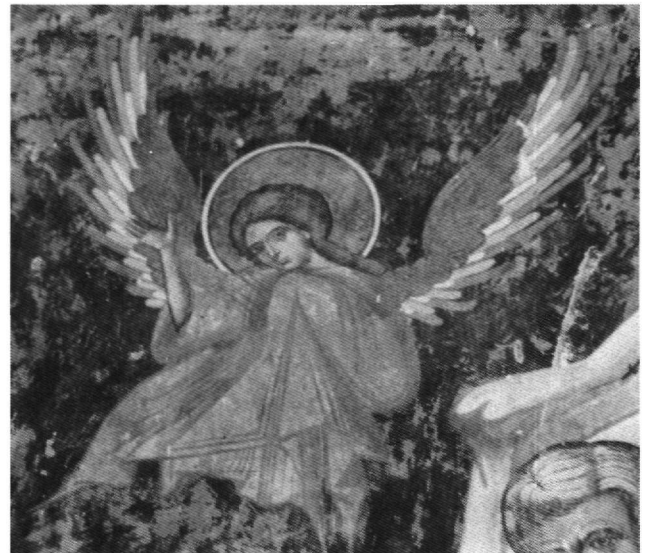
Fig. 5. Akhali Šouamta. Thrène, détail.

L'église de la Nouvelle Šouamta ou Akhali Šouamta, dédiée à la Nativité de la Vierge, se trouve également en Kakhétie. Ses peintures datent de la seconde moitié du XVIe, et certaines d'entre elles sont probablement du début du XVIIe siècle 14 . G. N. Čubinašvili a établi que l'architecture de l'église e été remaniée en 1565, ce qui donne un terminus post quem pour la peinture. Bien que la programme iconographique comporte certaines curiosités ces fresques doivent être considérées, aussi