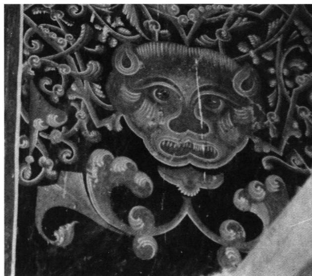
Fig. 6. Akhali Šouamta. Masque de lion.