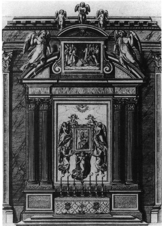
Εικ. 6. Χαρακτικό του P. de Angelis: Εικόνα της Παναγίας Οδηγήτριας στην Cappella Paolina της Santa Maria Maggiore στη Ρώμη (H. Belting, Bild und Kult , εικ. 293).

Το εικονογραφικό πρόγραμμα είναι σαφές, το ίδιο και οι στόχοι του. Είναι επίσης συνηθισμένο σε άλλα πολλά θρησκευτικά χαρακτηριστικά, που εξέδιδαν μοναστήρια 32 . Εικονογραφικά στερεότυπα, τα οποία απεικονίζουν ιδιαίτερα τιμώμενες εικόνες σε σκηνές αποθέω-