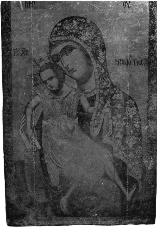
Εικ. 1. Μονή του Κύκκου. Εικόνα. 1757.

Byzanz und der Westen. Studien zur Kunst des europäischen Mittelalters, Wien 1984, σ. 142-170, ιδίως σ. 148 κ.ε.