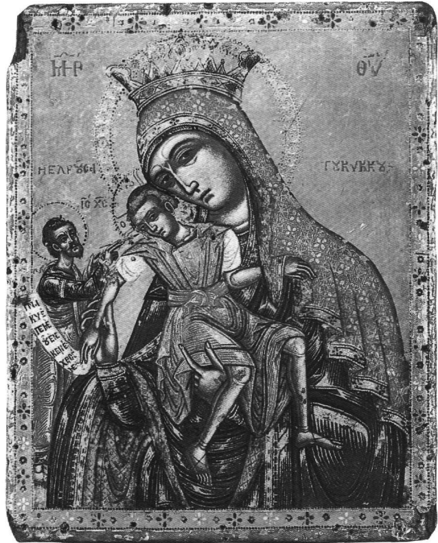
Εικ. 9. Αθήνα, Μουσείο Μπενάκη. Εικόνα ΤΑ 101.

33. Η καθολική εκκλησία υπεραμύνθηκε της λατρείας των εικόνων από την επίθεση της Μεταρρύθμισης. Για την εξίσωση της ιδιαίτερα τιμωμένης εικόνας με άγιο λείψανο και την ιδιαίτερη εικονογραφία που δημιουργήθηκε από την καθολική εκκλησία βλ.