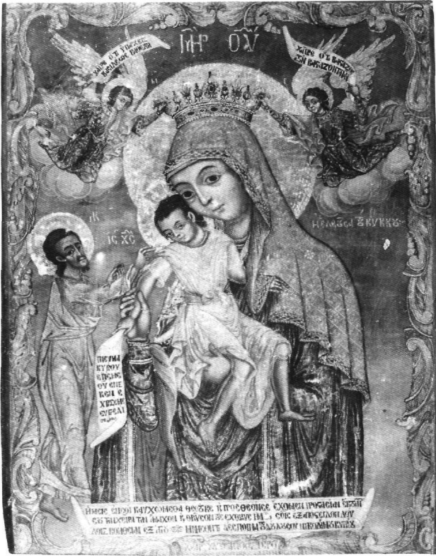
Εικ. 8. Μονή Σινά. Εικόνα. 1788.