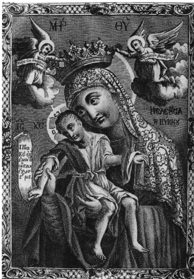
Εικ. 7. «Περιγραφή» μονής Κύκκου, Βενετία 1782. Προμετωπίδα.

σης κατάγονται από το δυτικοευρωπαϊκό μπαρόκ και ιδιαίτερα από τη θρησκευτική τέχνη της Αντιμεταρρύθμισης, που προώθησε, όπως είναι γνωστό, τη λατρεία των εικόνων και των λειψάνων 33 . Χαρακτηριστικό παράδειγμα ένα χαρακτηριστικό του Pietro de Angelis, του 1622, στο οποίο εικονίζεται η διευθέτηση που έγινε το 1613 στην Capella Paolina της Santa Maria Maggiore στη Ρώμη για να τοποθετηθεί το παλλάδιο της εκκλησίας, η προεικονομαχική εικόνα της Οδηγήτριας (Εικ. 6) 34 . Το εικονογραφικό σχήμα του χαρακτηριστικού του Κύκκου εκφράζει ιδέες ανάλογες με το χαρακτηριστικό αυτό του de Angelis. Ανήκει σε μια τεράστια ομάδα εικονογραφικών στερεοτύπων που γνωρίζουν μεγάλη διάδοση με τα θρησκευτικά χαρακτηριστικά σε Ανατολή και Δύση 35 .