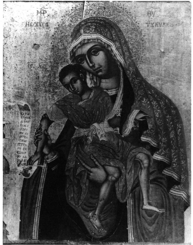
Εικ. 2. Αθήνα, Βυζαντινό Μουσείο. Εικόνα T 1703.

Πολύ κοντά στην κυπριακή εικόνα βρίσκεται ως προς τα εικονογραφικά χαρακτηριστικά μια εικόνα του Βυζαντινού Μουσείου (Εικ. 2) 22 . Οι διαφορές της με την εικόνα του 1757 αφορούν κάποιες λεπτομέρειες, που όμως είναι αρκετά διαφωτιστικές. Το παιδί κρατεί ανοιχτό ειλητό με την επιγραφή Πνεῦμα Κυρίου ἐπ' ἐμὲ οὐ ἔνεκεν ἔχρισέ με, εὐαγγελίσασθαι πτωχοῖς ἀπέσταλκέ με 23 . Ο κεντητός πέπλος της Παναγίας δεν πέφτει λοξά πάνω από το μαφόριο, απλώς επικαλύπτει το πάνω μέρος του. Γύρω από το πρόσωπο πτυχώνεται ένα διάφανο λευκό εσωτερικό πέπλο, συνηθισμένο στις παραστάσεις της Madre della Consolazione . Κάτω από το εξωτερικό πέπλο διακρίνεται το μαφόριο, του οποίου η παρυφή, όπως κατεβαίνει προς το λαιμό, συγχέεται με το ανασηκωμένο μανίκι του παιδιού, ενώ χάνεται ο συσχετισμός του με την παρυφή που διατηρεί το μαφόριο από τα χέρια της Παναγίας και κάτω. Αυτή η ασυνήθιστη εκδοχή του ενδύματος μπορεί να ερμηνευθεί με τη βοήθεια της προμετωπίδας στην πρώτη έκδοση της «Περιγραφής», του 1751 (Εικ. 3). Πραγματικά στο χαρακτηριστικό η Παναγία αντί για το πέπλο που πέφτει λοξά πάνω από το μαφόριο στην κυπριακή εικόνα του 1757 και στα παλαιότερα παραδείγματα, φορεί ένα μαντίλι που καλύπτει συμμετρικά το κεφάλι και τους ώμους. Εκεί που το χέρι του παιδιού το ανασηκώνει, διακρίνεται η διάκοσμη παρυφή του μαφορίου που ακολουθεί τη φορά του λαιμού της Πα-