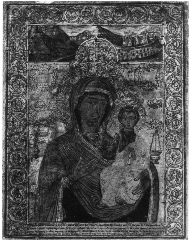
Εικ. 12. Αθήνα, Βυζαντινό Μουσείο. Συλλογή Λοβέρδου 139. Εικόνα. 1750.

τισσα υπήρξε μια από τις δημοφιλέστερες εικόνες της Παναγίας, όχι μόνο στα βυζαντινά χρόνια αλλά έως και τη νεότερη εποχή, και τα αντίγραφα είναι πολυάριθμα και οι παραλλαγές της ποικίλες.