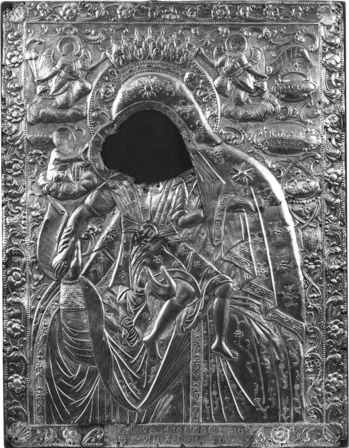
Εικ. 11. Αθήνα, Βυζαντινό Μουσείο. Επένδυση εικόνας ΜΤ 1477.