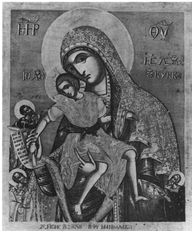
Εικ. 10. Ελβετία, ιδιωτική συλλογή. Εικόνα ( Les icones dans les collections suisses, 1968, αριθ. 131 ).