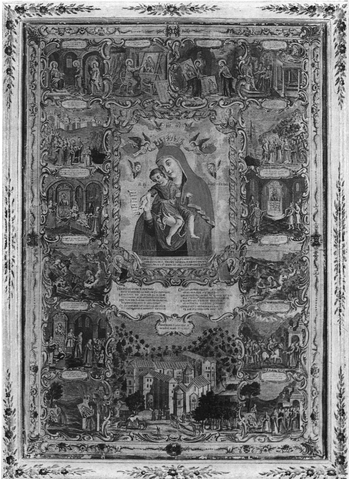
Εικ. 5. Χαριστικό μονόφυλλο. 1778.