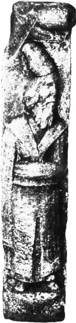
Εικ. 1. Αρχαιολογικό Μουσείο Κωνσταντινούπολης. Πεσίσκος αριθ. 279 (από Α. Grabar, βλ. υποσημ. 6).

έχει άνοιγμα σχήματος V γύρω από το λαιμό και ο εσωτερικός είναι ριγωτός. Στο 12ο αιώνα ανάγεται πιθανώς και η παράσταση του δεόμενου αφιερωτή που έχει ανάλογο ένδυμα από το ναό του Αγίου Γεωργίου του Διασορίτη της Νάξου 18 . Σημειώνεται ότι στον Άγιο Γεώργιο η φορεσιά συμπληρώνεται από το γνωστό μας από το γλυπτό της Κωνσταντινούπολης περιλαίμιο.