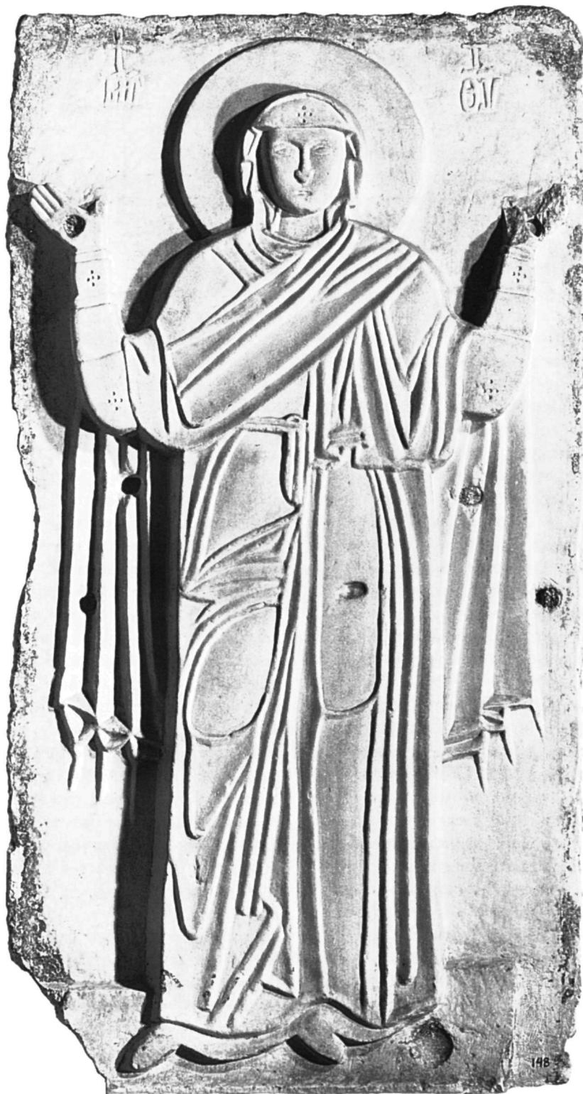
Εικ. 1. Μαρμάρινη εικόνα της Παναγίας.