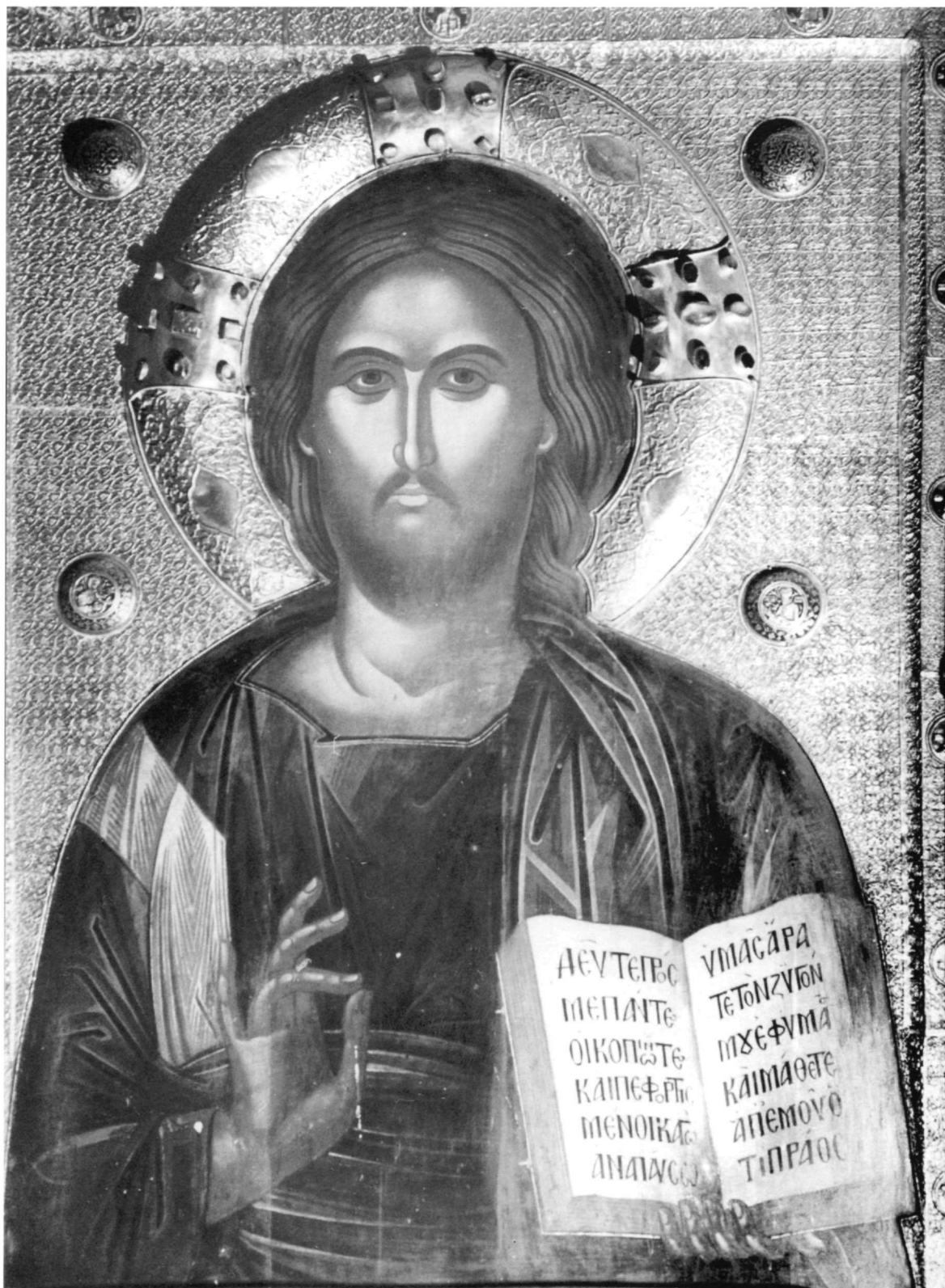
Εικ. 2. Μονή Μεγίστης Λαύρας. Χριστός Παντοκράτωρ.