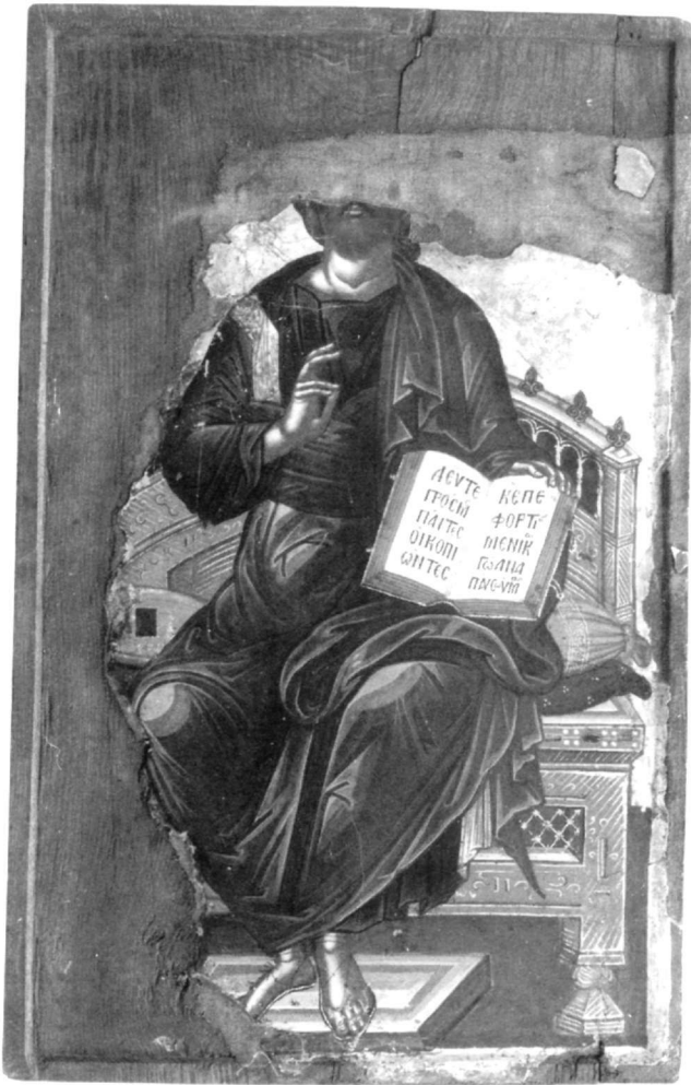
Εικ. 15. Μονή Γρηγορίου. Χριστός ἔνθρονος.

στην Κρήτη, στο Σεράγεβο, στο Μουσείο της Καστοριάς, στο Βυζαντινό Μουσείο Αθηνών 37 κ.ά.