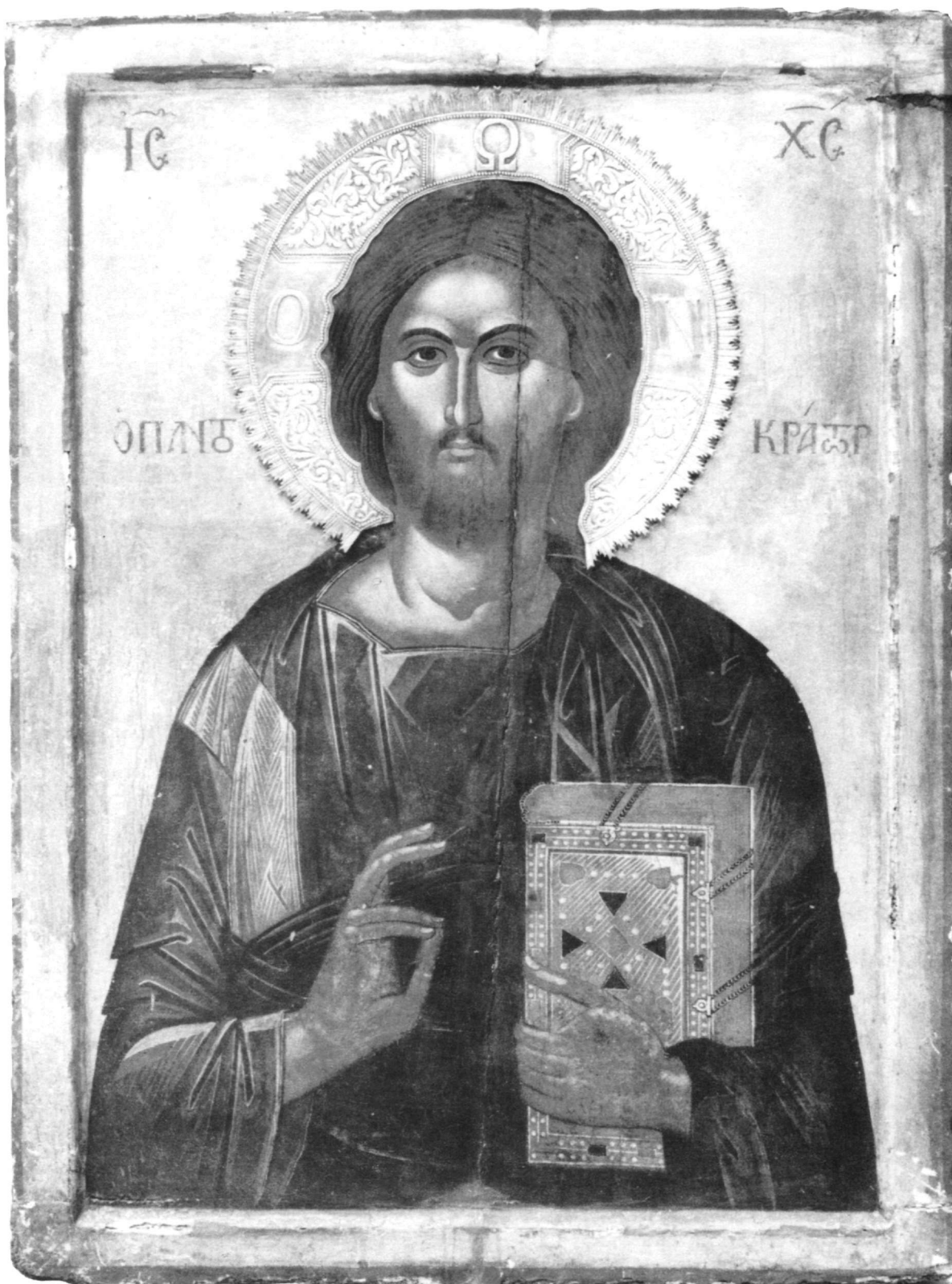
Εικ. 1. Μονή Παντοκράτορος. Χριστός Παντοκράτωρ.