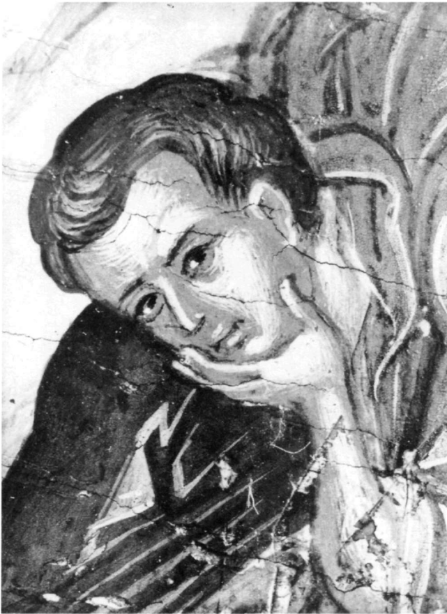
Εικ. 9. Μονή Παντοκράτορος. Η Μεταμόρφωση. Ο απόστολος Ιωάννης (λεπτομέρεια της εικ. 8).