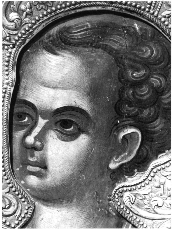
Εικ. 4. Μονή Παντοκράτορος. Παναγία Οδηγήτρια. Ο Χριστός (λεπτομέρεια της εικ. 3).

Οι παραπάνω παρατηρήσεις, σε συνδυασμό με την ποιτική υπεροχή της εικόνας της μονής Παντοκράτορος