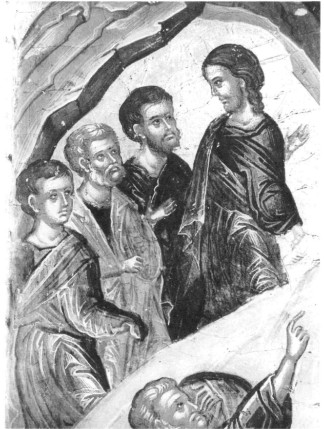
Εικ. 10. Μονή Παντοκράτορος. Η Μεταμόρφωση. Η ανάβαση του Χριστού και των Αποστόλων (λεπτομέρεια της εικ. 8).

εικόνων, που φθάνει ακόμη μέχρι του σημείου να επαναλαμβάνεται στα ίδια πρόσωπα η αυτή χρωματική κλίμακα, οδηγεί στο να αποδώσουμε την εικόνα της Βαπτίσεως της μονής Παντοκράτορος στον Θεοφάνη 30 και χρονικά να την εντάξουμε στην περίοδο της διακοσμήσεως του καθολικού της μονής Σταυρονικήτα (1545/6).