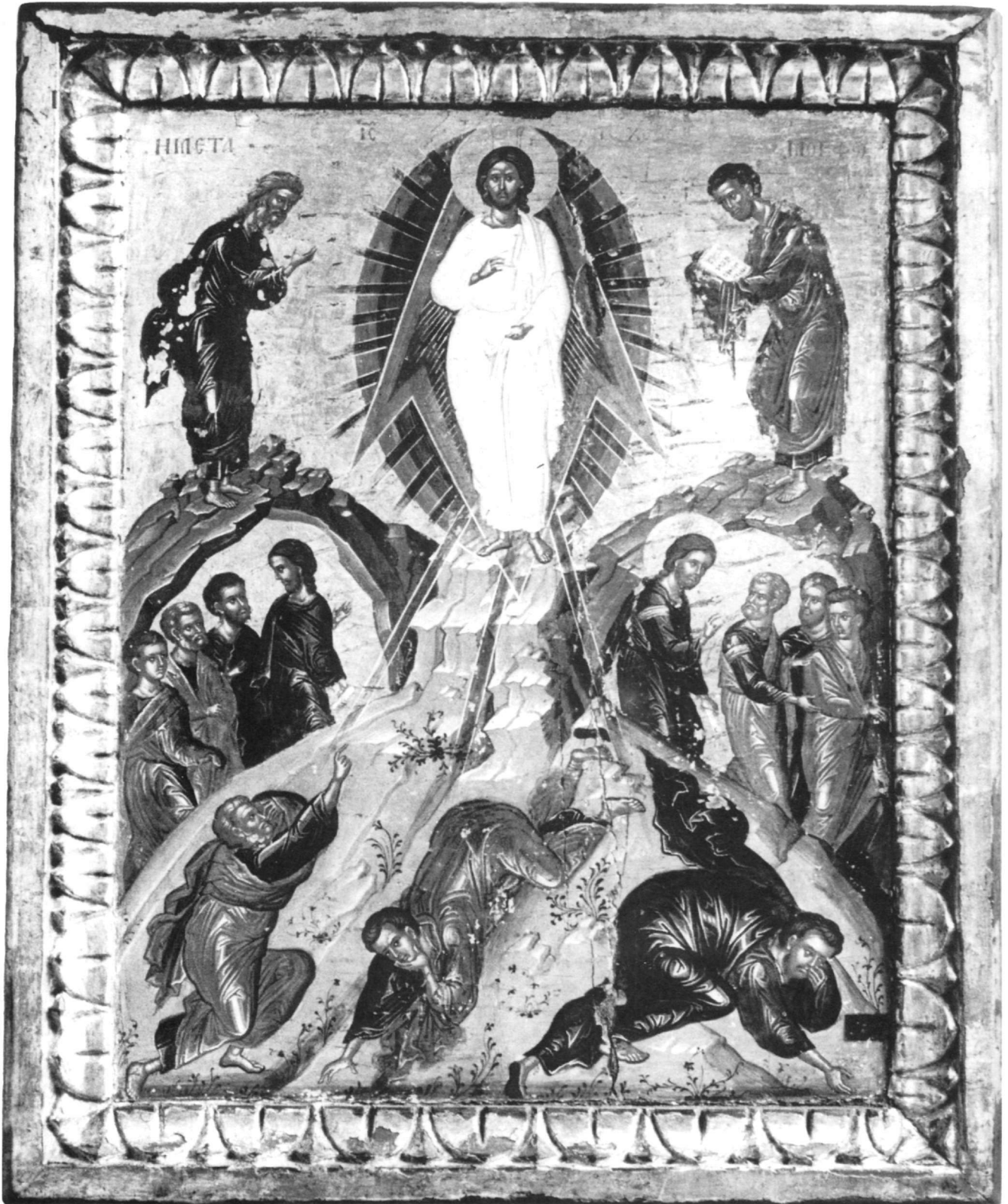
Εικ. 8. Μονή Παντοκράτορος. Μεταμόρφωση.