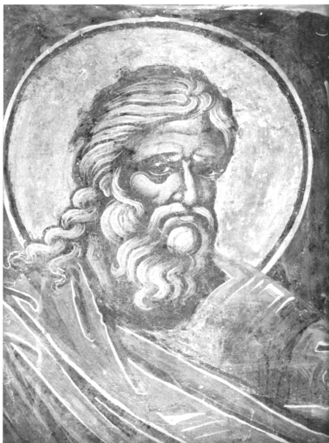
Εικ. 12. Μονή Παντοκράτορος. Ο προφήτης Ιεζεκιήλ (λεπτομέρεια της εικ. 13).

κής θα βρούμε το ίδιο πρόσωπο στις τοιχογραφίες του καθολικού της μονής Αναπαυσά, του καθολικού της Λαύρας, του καθολικού της μονής Σταυρονικήτα 32 , σύνολα που ανήκουν στον Θεοφάνη και χρονολογούνται στα 1527, 1535 και 1545/6 αντίστοιχα.