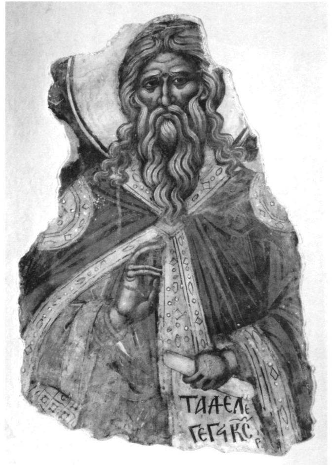
Εικ. 14. Πετρούπολη. Μουσείο Hermitage. Ο προφήτης Ιεζεκιήλ.

Ο εικονογραφικός τύπος του ένθρονου Χριστού της εικόνας της μονής Γρηγορίου έχει την καταγωγή του σε πρώιμα έργα της κρητικής ζωγραφικής του 15ου αι. και