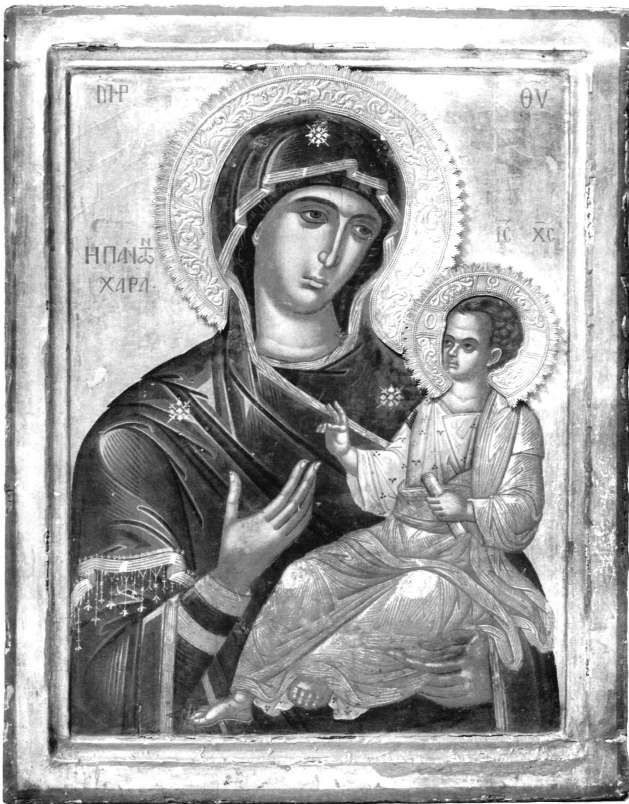
Εικ. 3. Μονή Παντοκράτορος. Παναγία Οδηγήτρια.