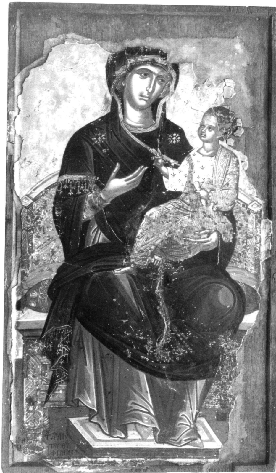
Εικ. 16. Μονή Γρηγορίου. Παναγία Οδηγήτρια.