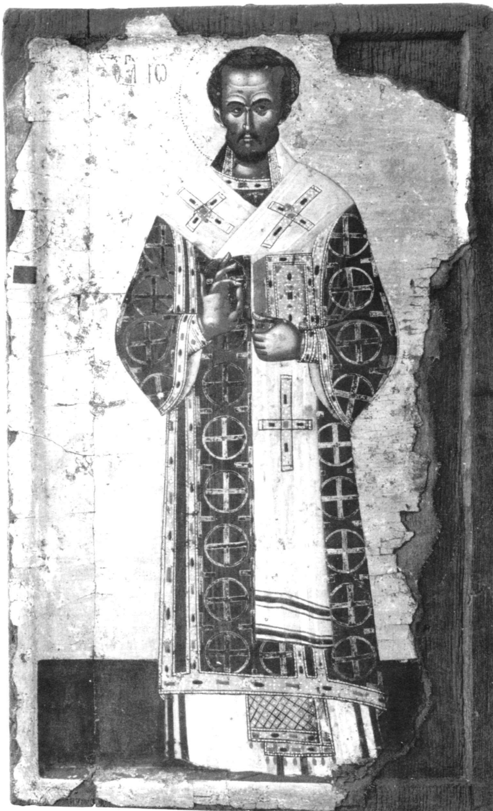
Εικ. 18. Μονή Γρηγορίου. Άγιος Ιωάννης ο Χρυσόστομος.