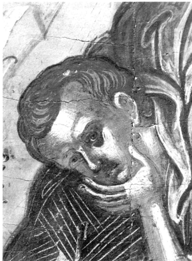
Εικ. 7. Μονή Παντοκράτορος. Μεταμόρφωση. Ο απόστολος Ιωάννης (λεπτομέρεια της εικ. 5).

Μια άλλη εικόνα της μονής Παντοκράτορος, μικρών διαστάσεων (0.43 x 0.32 εκ.), στην οποία απεικονίζεται η Βάπτιση 27 (εικ. 11), παρουσιάζει όχι μόνο παρόμοιο εικονογραφικό σχήμα μ' αυτό της Βαπτίσεως του καθολικού της μονής Σταυρονικήτα 28 , αλλά επαναλαμβάνει αυτούσια τα προσωπογραφικά χαρακτηριστικά, τη στάση, την