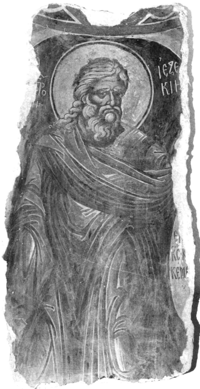
Εικ. 13. Μονή Παντοκράτορος. Ο προφήτης Ιεζεκιήλ.

Με βάση τα παραπάνω έχουμε τη γνώμη ότι η τοιχογραφία του Ιεζεκιήλ προσγράφεται στην καλλιτεχνική δραστηριότητα του Θεοφάνη στο Άγιον Όρος (1535-1546), χωρίς επί του παρόντος ακριβέστερο χρονολογικό προσδιορισμό, καθώς οι τοιχογραφίες του καθολι-