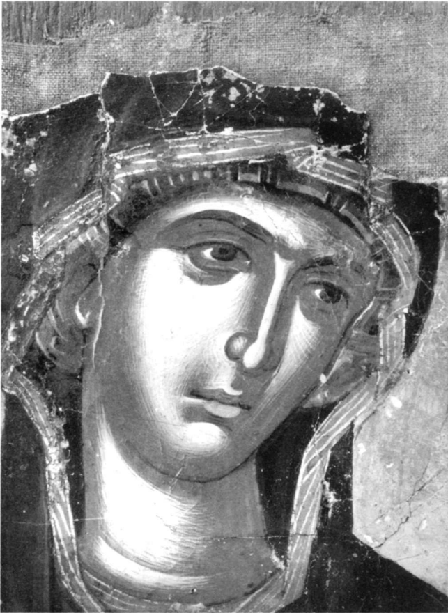
Εικ. 17. Μονή Γρηγορίου. Παναγία Οδηγήτρια (λεπτομέρεια της εικ. 16).

ο τρόπος αποδόσεως του προσώπου παρουσιάζουν εντυπωσιακή ομοιότητα με την εικόνα της μονής Παντοκράτορος και της μονής Σταυρονικήτα που αναφέραμε. Ακόμα η πτυχολογία στο πλούσιο μαφόριο με την περίτεχνη διάταξη των πτυχώσεων, που αναδεικνύει τους όγκους στο ύψος των γονάτων, έχει την καταγωγή σε έργα της κρητικής σχολής του δεύτερου μισού του 15ου αι., όπως είναι η εικόνα της Παναγίας Παντανάσσης της Πάτμου 40 . Σε εκφραστικό επίπεδο το γαλήνιο ειρηνικό πρόσωπο της Παναγίας και του Χριστού έχει το παράλληλό του στην εικόνα της Παναγίας Οδηγήτριας της μονής Παντοκράτορος (εικ. 3, 4), παρά σ' αυτήν της μονής Σταυρονικήτα.