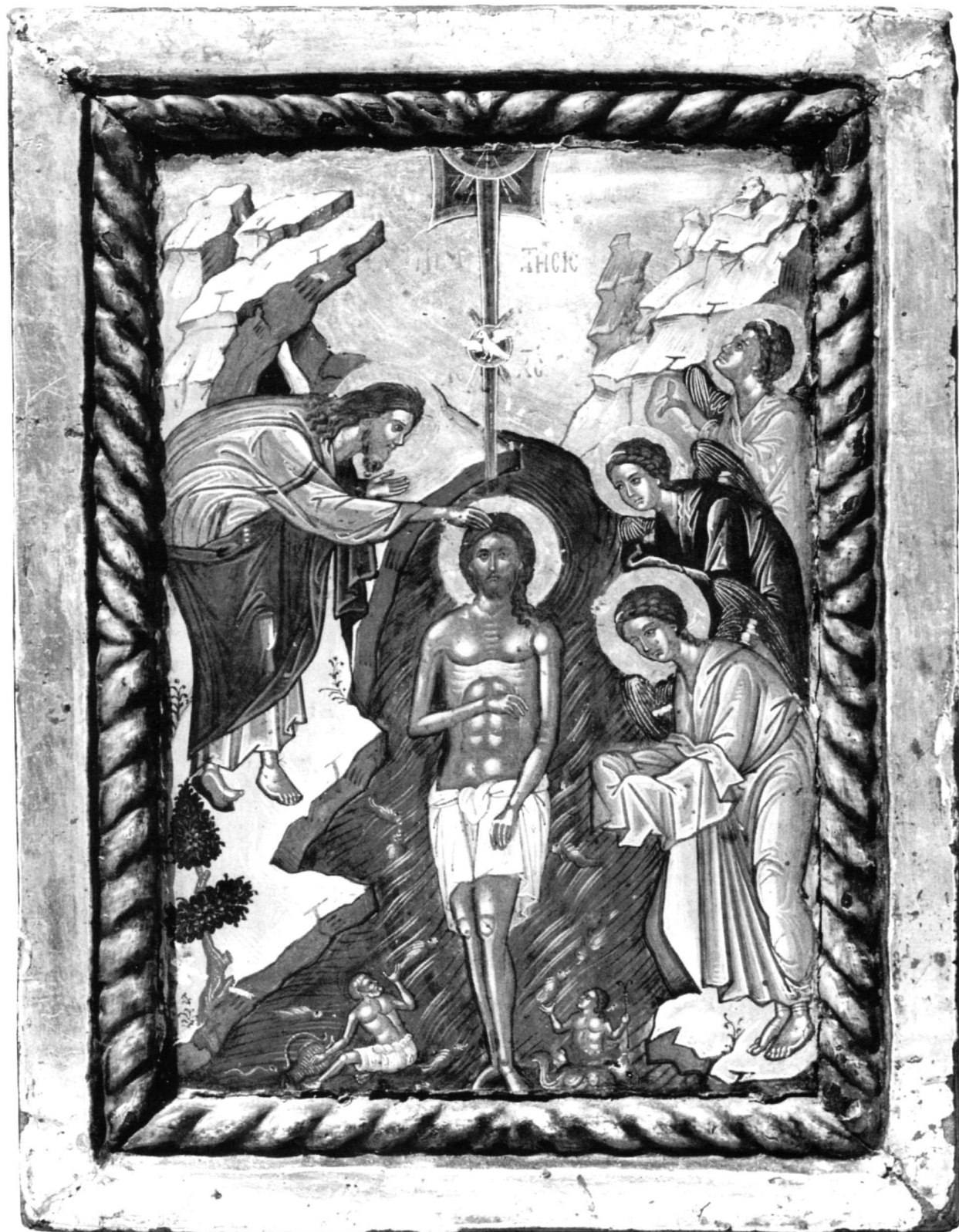
Εικ. 11. Μονή Παντοκράτορος. Η Βάπτιση.