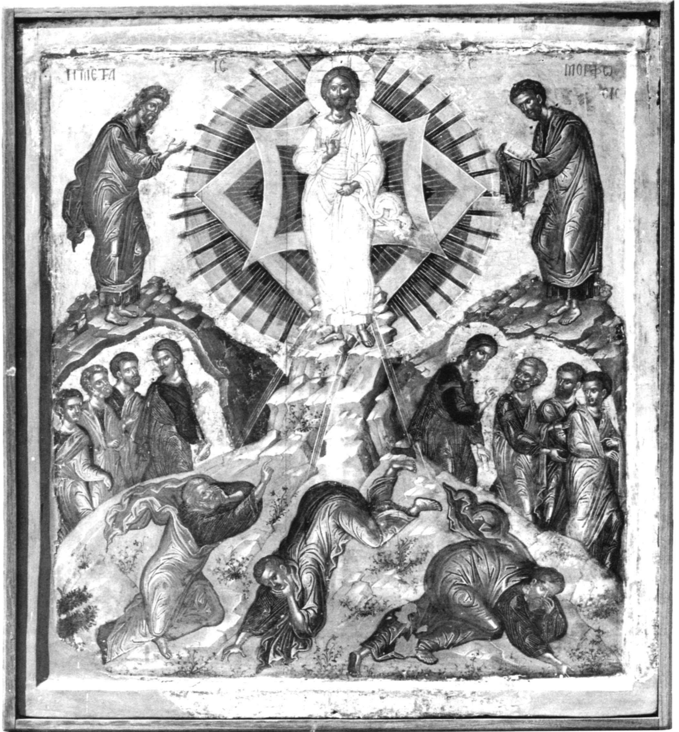
Εικ. 5. Μονή Παντοκράτορος. Μεταμόρφωση.