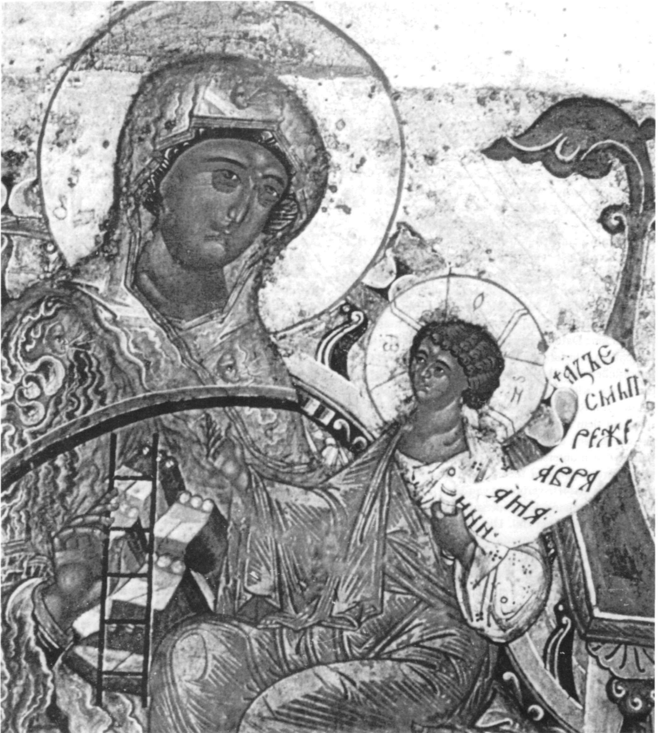
Abb. 3. Teilansicht der Ikone der Gottesmutter «Gora nerukosečnaja».