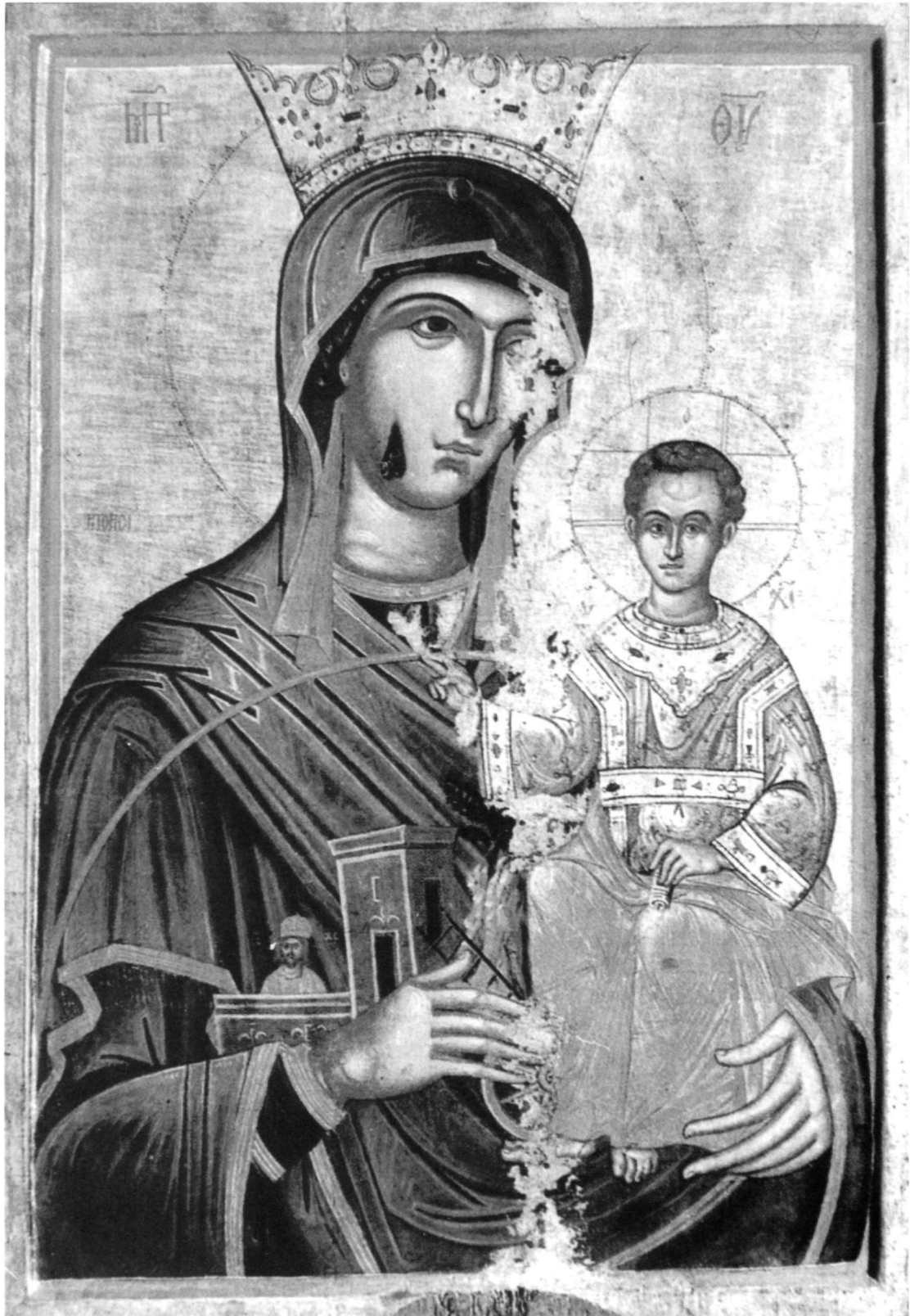
Abb. 1. Die Ikone der Gottesmutter Rhetorissa aus dem Rožen-Kloster in der Nähe von Melnin.