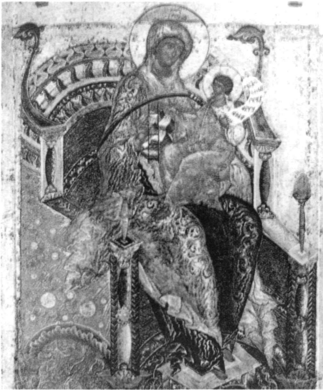
Abb. 2. Die Gottesmutter «Gora nerukosečnaja».

Die Ikonen der Gottesmutter «Gora nerukosečnaja» stellen die Gottesmutter thronend mit dem Jesuskind auf dem linken Arm dar (Abb. 2-3). In der rechten Hand hält sie einen Fels, eine Leiter und einen schmalen Bogen, der vor ihrer Brust verläuft. Ihr Maphorion ist wie aus Wolken gewoben, und auf dem Kopf und an der rechten Schulter sind kleine Medaillons abgebildet, die menschliche Gesichter einfassen, aus deren Mündern Strahlen austreten. Wie die Bezeichnung zeigt, wurden diese Ikonen durch die Episode vom ersten Traum Nabukadnezars und dessen Deutung durch den Propheten Daniel (Dan. 2, 34-35) inspiriert. In seinem Traum sah der König einen Stein, der von einem Berg herunterkam und ohne das Zutun von Menschenhänden das schreckliche Bild zermalmte. Der Stein selbst wurde zu einem großen Berg, der die ganze Welt erfüllte. Traditionell wird diese Episode als Prophezeiung der ewigen Jungfräulichkeit der Gottesmutter gedeutet. Sie ist