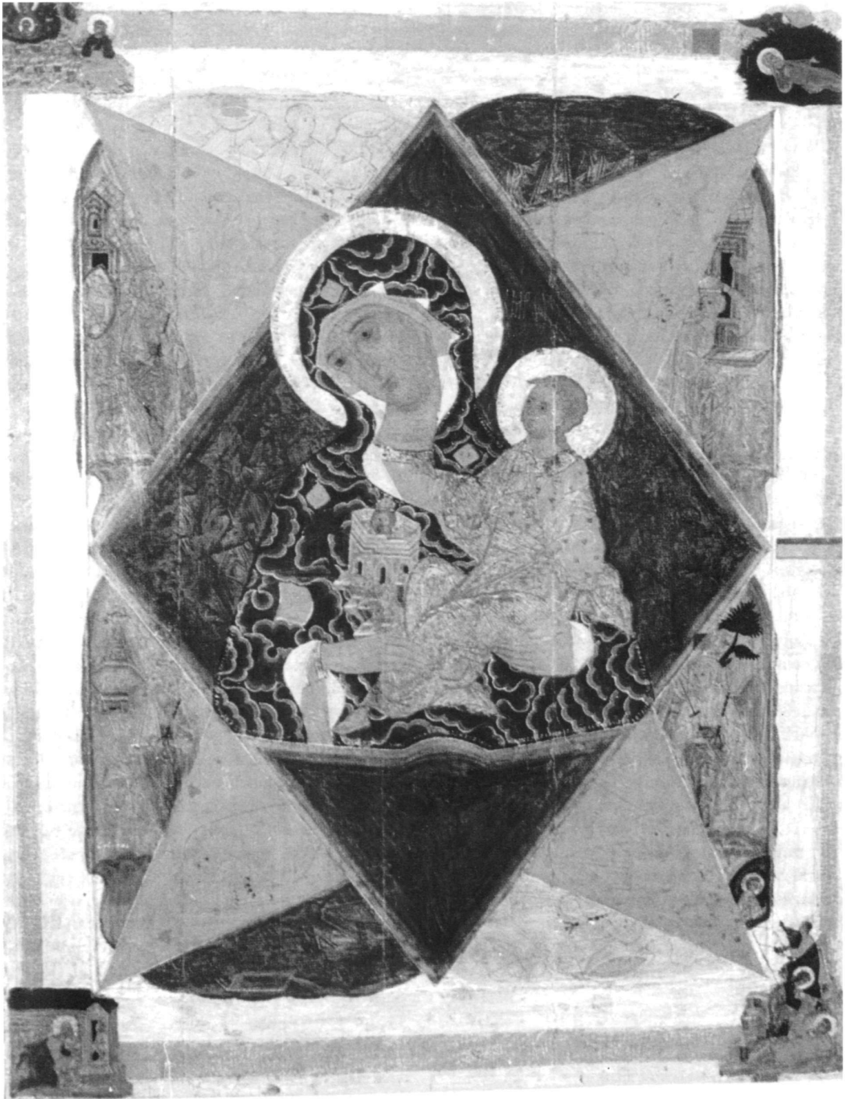
Abb. 4. Die Gottesmutter «Neopalmaja kupina».