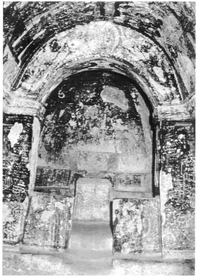
Εικ. 4. Karabas kilise, άποψη της αψίδας (1060-1061).

Στους τοίχους του Ιερού εκτυλίσσεται κυρίως ο δογματικός κύκλος, με σκηνές ιδιαίτερα συμβολικές, όπως η Μετάληψη και η Μετάδοση των αποστόλων 61 ή η νοητή παρουσία των ιεραρχών στον χώρο γύρω από την αγία τράπεζα 62 , ενώ αντίθετα, στους τοίχους και στους θόλους του κυρίως ναού προβάλλονται οι κατά κύριο λόγο αφηγηματικές σκηνές από τον χριστολογικό και από τον θεομητορικό κύκλο. Έτσι, ανάμεσα στους δύο χώρους υπάρχει ένα νοητό «χάσμα», το οποίο έρχεται να γεφυρώσει στα παραπάνω μνημεία η σκηνή του Ευαγγελισμού, για να άρει την αυτονομία των δύο χώρων και να δείξει ότι τα εικονογραφικά τους προγράμματα αποτελούν ενιαίο σύνολο. Η σκηνή αυτή επομένως, που πλέον απλώνεται και δεσπάζει στον χώρο, αποβαίνει ο συνδετικός κρίκος ανάμεσα στους δύο κύκλους, αφού φαντάζει να μετέχει και στο πρόγραμμα του Βήματος και σ' εκείνο του κυρίως ναού.