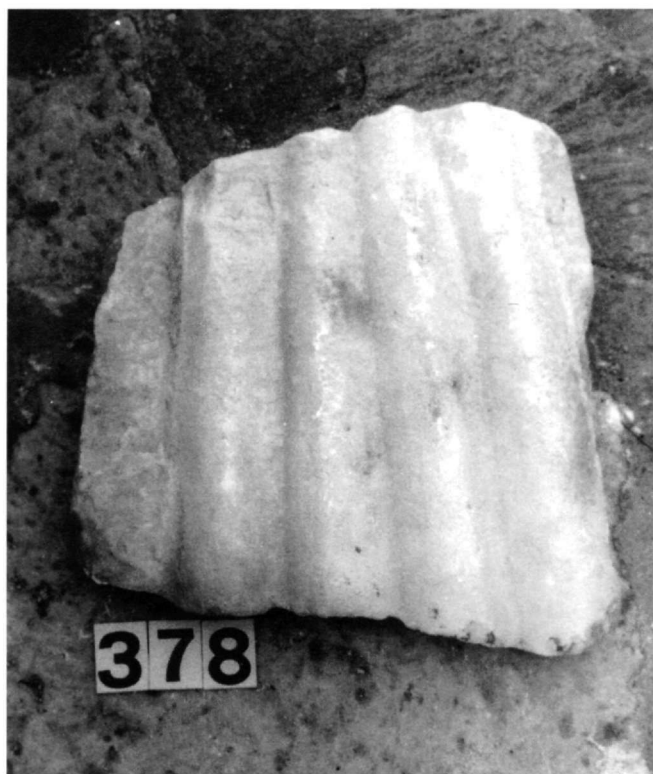
Εικ. 2. Συλλογή Καταπολιανής. Θραύσμα: E378.

μέταξου λεπτού πολυτελούς υφάσματος, υποκίτρινου χρώματος 6 . Πράγματι η μεγάλη σταυρική τρουλαία βασιλική της Παναγίας φέρει σειρές κίωνων από λευκό με ελαφρά γκριζωπές νευρώσεις μάρμαρο Προκοννήσου 7 , ενώ οι σωζόμενες ορθομαρμαρώσεις στο κεντρικό κλίτος του ναού είναι κατασκευασμένες από λευκό παριανό μάρμαρο.