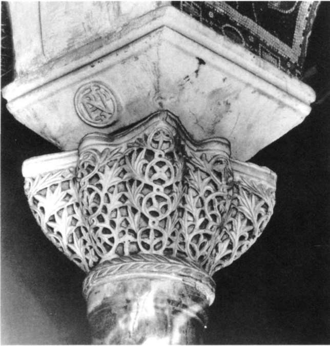
Εικ. 10. Ραβέννα, Άγιος Βιτάλιος. Πτυχωτό κιονόκρανο (από Fr. W. Deichmann, Ravenna, III, πίν. 306).

χωτό σχήμα, ενώ εκεί όπου έχει αποκρουσθεί η εύθραυστη διακοσμημένη επιφάνεια διακρίνονται τα λεπτά σημεία επαφής με το κυρίως σώμα του κιονοκράνου που την συγκρατούσαν. Ο άβακας με τη βοήθεια μιας οριζόντιας γλυφής, χωρίζεται σε δύο κυμάτια, ενώ στη μέση κάθε πλευράς προβάλλει το άνθος. Το