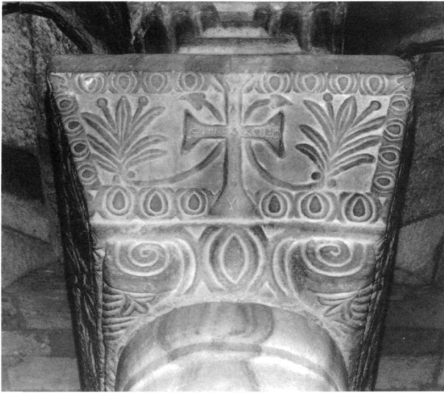
Εικ. 12. Καταπολιανή, κυρίως ναός. Ιωνικό κιονόκρανο με συμφυές επίθημα.

του βου αιώνα και μάλλον γύρω στο 540, χρονολόγηση που ενισχύεται άλλωστε και από τα λοιπά αρχαιολογικά δεδομένα του ναού. Όπως φαίνεται επίσης και από τα σωζόμενα παραδείγματα πτυχωτών κιονοκράνων έχουμε κάθε λόγο να υποθέσουμε ότι τα κιονόκρανα του κιβωρίου ελαξεύθησαν στην Κωνσταντινούπολη από όπου και εστάλησαν έτοιμα μαζί με τους κίονες από προκονηήσιο μάρμαρο. Είναι γεγονός επίσης ότι στην Καταπολιανή τέτοιου τύπου κωνσταντινουπολίτικα κιονό-