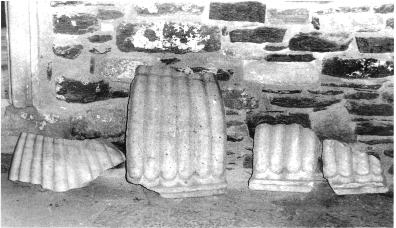
Εικ. 1. Συλλογή Καταπολιανής. Θραύσματα: E23, E24, E25, E26.

χνίτου, ὅς καὶ τὸ κάλλος ἐφιλονείκησε τῇ φύσει προσ- νεῖμαι». Ο συγγραφέας περιγράφει τον ερειπωμένο και έρημο τότε ναό ο οποίος τον εντυπωσιάζει καθώς δια- σώζει ακόμη λείψανα της παλαιάς ωραιότητάς του. Πληροφορεί ότι ο ναός είναι κτισμένος συμμετρικά και