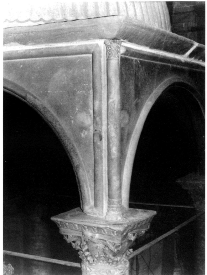
Εικ. 11. Καταπολιανή, κιβώριο. Λεπτομέρεια ανωδομής, γωνιαίος κιονίσκος.

είναι ημιτελές 29 . Τα ιουστινιάνεια πτυχωτά κιονόκρανα που επιστέφουν κίονες στον Άγιο Μάρκο της Βενετίας έχουν μεταφερθεί από την Κωνσταντινούπολη 30 . Στη Μικρά Ασία βρέθηκε ένα πτυχωτό κιονόκρανο από προκοννήσιο μάρμαρο στη Υαλονα της Βιθυνίας, στο οποίο ο άβρακας καθώς επίσης ο μεσαίος δίσκος του καλάθου παραμένει ακόσμητος 31 , όπως στα αντίστοιχα κιονόκρανα της Καταπολιανής. Η διακόσμηση του πτυχωτού κιονοκράνου στο Τέμενος των Ομεΐαδών στη Δαμασκό παρουσιάζει επίσης ομοιότητες με τα αντίστοιχα της Καταπολιανής, όσον αφορά το σύνολο της διακόσμησης 32 . Αλλά ο καλάθος των κιονοκράνων του κιβωρίου μας παρουσιάζει ομοιότητες και με τα κωνσταντινουπολίτικα από προκοννήσιο μάρμαρο κιονόκρανα του Αγίου Βιταλίου της Ραβέννας. Τα δύο κιονόκρανα του Αγίου Βιταλίου στο τρίβλο του βόρειου υπερώου προς το ιερό του ναού, μπορούν να χρονολογηθούν στα χρόνια 538-545 από τα μονογράμματα του επισκόπου Βίκτωρος που φέρουν στο επίθημά τους 33 (εικ. 10). Πρόσθετο ενδιαφέρον παρουσιάζει το φαινόμενο του συνδυασμού και εδώ πτυχωτών κιονοκράνων και κίωνων από προκοννήσιο μάρμαρο της ειδικής κοπής που μιμείται ελικοειδείς ραβδώσεις. Επομένως τα κιονόκρανα του κιβωρίου της Καταπολιανής μπορούν να τοποθετηθούν μέσα στο δεύτερο τέταρτο