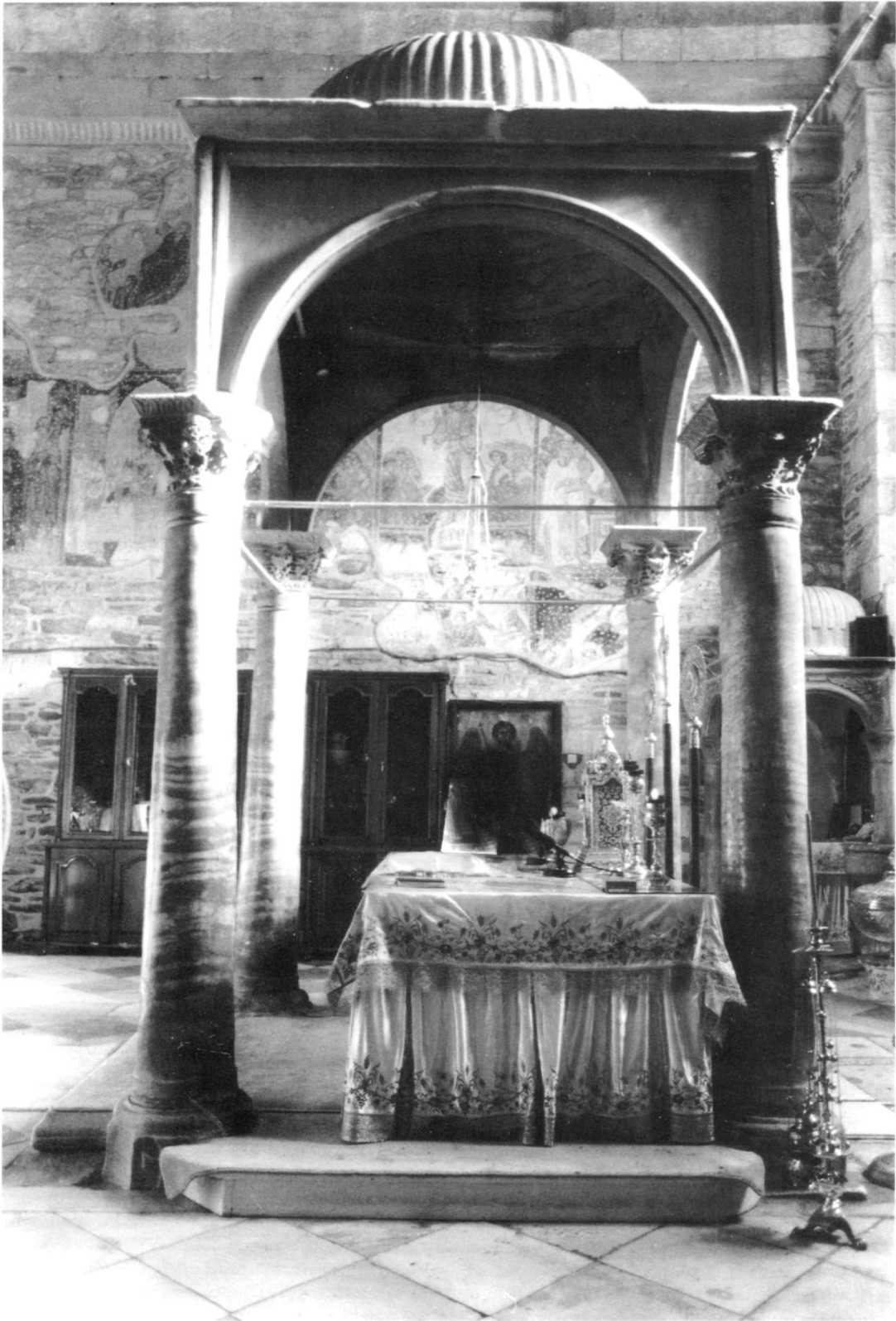
Εικ. 3. Καταπολιανή, το παλαιοχριστιανικό κιβώριο. Νότια όψη.