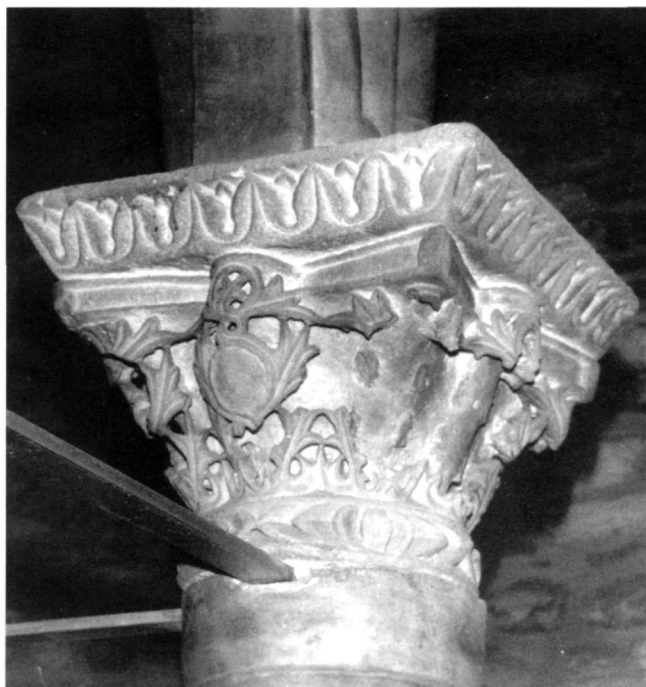
Εικ. 9. Καταπολιανή, κιβώριο. Πτυχωτό κιονόκρανο.

in Classe στη Ραβέννα 20 , μνημείο της εποχής του Ιουστινιανού, και εκείνοι των κιονοστοιχιών του ιουστινιανείου επίσης Αγίου Ιωάννη στην Έφεσο της Μικράς Ασίας 21 .