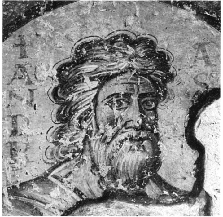
Εικ. 5. Ρώμη, Santa Maria Antiqua. Ο απόστολος Ανδρέας, λεπτομέρεια (705-707).

τοιχογραφίες αυτές μπορούν να ενταχθούν αφ' ενός κοντά στην κλασικίζουσα, μπρεσιονιστική τάση με τις ψηλόλιγνες μορφές, με το μικρό κεφάλι, το απαλό πλάσιμο (Εικ. 2) και τη σχετικά ρευστή πτυχολογία και κίνηση που βρίσκουμε σε έργα του α' μισού του 7ου αιώνα, όπως στη Santa Maria Antiqua στη Ρώμη, γύρω στο 630-650 18 , έργο ανατολικών προσφύγων, στο σπάραγμα της Υπαπαντής από το Kalenderhane Camii στην Κωνσταντινούπολη 19 , την εγκαυστική εικόνα της Βρεφοκρατούσας με αγίους και αγγέλους στη μονή του Σινά 20