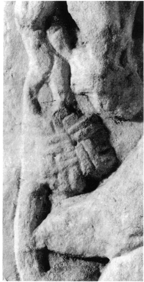
Εικ. 2. Λεπτομέρεια της Εικ. 1.

σχέση τους με τον ποιμένα και το περιβάλλον αποτελούν θέματα που, με μικρές παραλλαγές, κοσμούν τις σαρκοφάγους από τον 3ο αιώνα 9 . Συχνά κληματίδα με ευχαριστιακό περιεχόμενο αποδίδει το παραδεισιακό τοπίο στο οποίο βρίσκεται ο ποιμήν 10 .