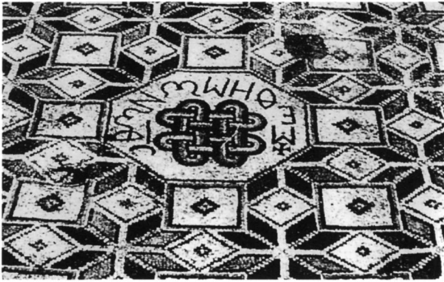
Εικ. 3. Ψηφιδωτό δάπεδο ναού στην Ιορδανία (Maguire 1990).

ραδείγματα εκφράζουν το νόημα των παλαιοχριστιανικών προτύπων τους 12 .