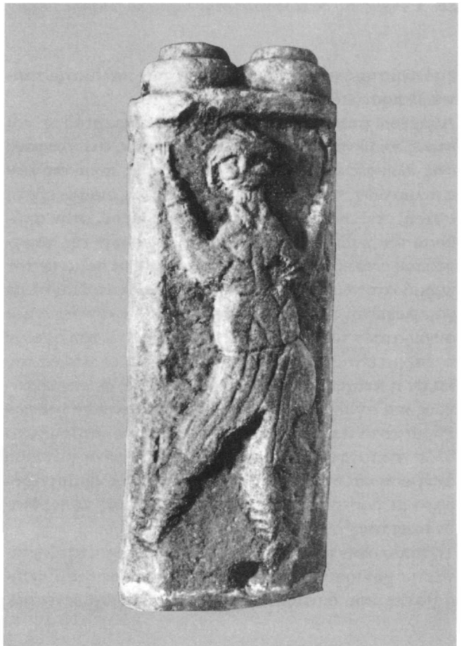
Εικ. 7. Μαρμάρινος πεσσίσκος με παράσταση χορευτή. Αρχαιολογικό Μουσείο Κωνσταντινούπολης (Grabar 1976).

Ο τρόπος επεξεργασίας του αναγλύφου, η απόδοση της μορφής του ποιμένος και του φυτικού θέματος του βάθους, αλλά και η επιλογή των προτύπων οδηγούν σε χρονολόγηση της παράστασης στα τέλη του 13ου αιώνα. Η τεχνική επεξεργασία της παράστασης με τον ποιμένα σε ελαφρά υψηλότερο ανάγλυφο από του βάθους παραπέμπει στην τεχνική των δύο επιπέδων στην ίδια επιφάνεια, με εποχή ακμής το 12ο-13ο αιώνα, της οποίας και αποτελεί πιθανώς ακραίο χρονολογικά παράδειγμα σε φθίνουσα μορφή. Από το φυτικό θέμα του βάθους, που αποτελείται από βλαστούς με ελάχιστα ημίφυλλα, λείπει η ζωηρή και καλλιγραφική απόδοση, χαρακτηριστική στα μεσοβυζαντινά γλυπτά. Η έλλειψη αναλογιών και πλαστικότητας, οι χαμηλωμένοι