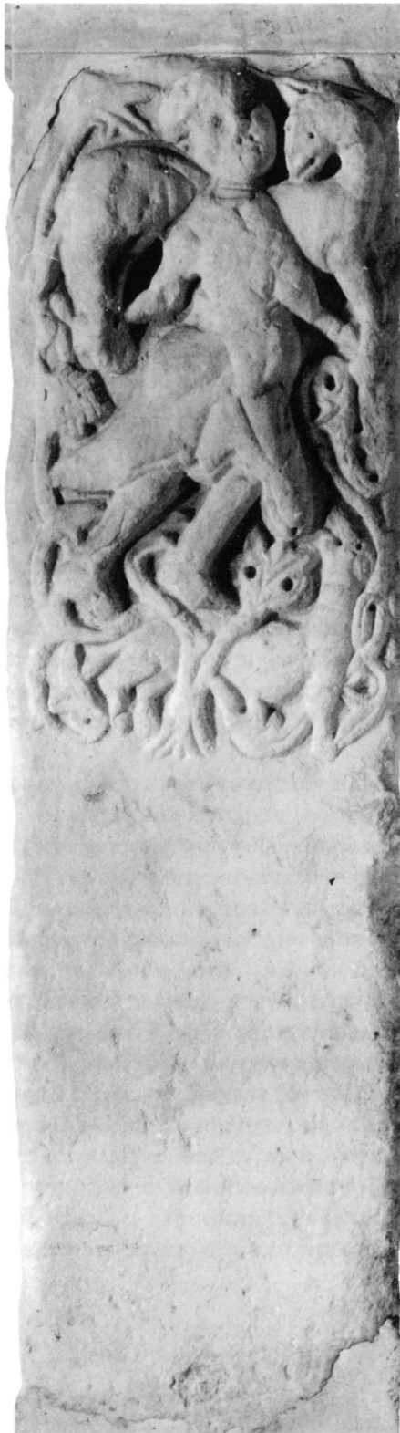
Εικ. 1. Μαυμάρινη παραστάδα. Βυζαντινό Μουσείο Αθηνών, T 180.