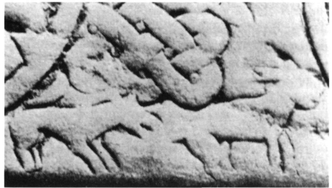
Εικ. 4. Λεπτομέρεια υπερθύρου από την Κόρινθο (Πάλλας 1960).

Ο ταινιωτός κόμβος ή «κατάδεση» (από το καταδέω ) ανήκει στα λεγόμενα «μαγικά» σύμβολα με υπερφυσική δύναμη, σχήματα χρήσιμα στο συνεχή αγώνα του λαϊκού ανθρώπου για την προστασία του από πονηρά πνεύματα και κακά δαιμόνια. Οι ομόκεντροι κύκλοι, το γράμμα Δ ή το τρίγωνο μόνο του αλλά και σε διάφορα συμπλέγματα αποτελούν αρχαίες μορφές προστασίας 14 που, όπως και οι ταινιωτοί κόμβοι, χρησιμοποιήθηκαν στα ρευστά όρια θρησκείας και μαγείας, ευνοημένα από ένα συγκεκριμένο επίπεδο ζωής, στο οποίο κυριαρχούσαν οι δεισιδαμονικές αντιλήψεις και δοξασίες 15 . Οι κόμβοι, από τα πιο διαδεδομένα αποτροπαϊκά σύμβολα, εθεωρείτο ότι απομάκρυναν τα πονηρά πνεύματα, τα κατάδεσαν, τα καθιστούσαν ανίκανα προς ενέργεια και παρεμπόδιζαν την είσοδό τους 16 . Απεικονίστηκαν σε ψηφιδωτά δάπεδα και γλυπτά, και χρησιμοποιήθηκαν ως προστατευτικά οικοδομημάτων, όπως και για την προστασία ζώντων και νεκρών, σε αντικείμενα καθημερινής χρήσης αλλά και σε επιτύμβια.