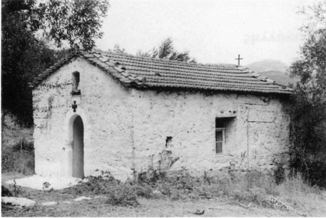
Εικ. 1. Παναγίτσα Βαλύρας. Άποψη από ΝΔ.