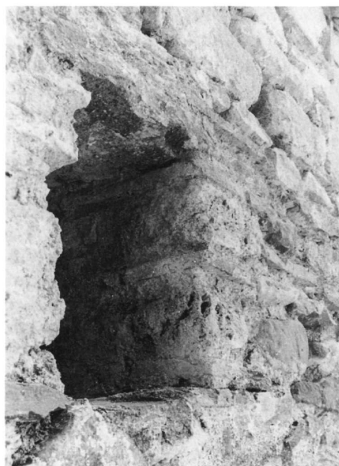
Εικ. 4. Παναγίτσα Βαλύρας. Παράθυρο βόρειας ὄψης.

13. Ἐνδεικτικά: Ἄη-Στράτηγος Μπουλαριῶν (N. Δρανδάκης, Βυζαντινὰ τοιχογραφία τῆς Μέσα Μάνης , Ἀθήναι 1964, σ. 18), Ταξιάρχης Χαροῦδας Μάνης (N. Δρανδάκης, Ὁ Ταξιάρχης τῆς Χαροῦδας καί ἡ κτιτορική ἐπιγραφή του, ΛακΣπουδ Α' (1972), σ. 278, πίν. ΙΖ' β), Προφήτης Ἡλίας Κονιδίτσας (Α. Ὁρλάνδος, Ἄγνωστος βυζαντινός ναός τῆς Λακωνίας, Ἑλληνικά ΙΕ' (1957), σ. 91, εἰκ. 2), Ἅγιος Ἰωάννης ὁ Θεολόγος Παλαιοῦ Λυγουριοῦ (Στ. Μαμαλοῦκος, Ἐνας ἄγνωστος βυζαντινός ναός στήν Ἀργολίδα. Ὁ Ἅγιος Ἰωάννης ὁ Θεολόγος Παλαιοῦ Λυγουριοῦ, ΔΧΑΕ ΙΒ' (1984), σ. 429, εἰκ. 18/11), Παναγία Λουτρῶν Ἡραίας (N. Μουτσόπουλος, Ἡ ἀρχιτεκτονική τῶν ἐκκλησιῶν καί τῶν μοναστηριῶν τῆς Γορτυνίας , Ἀθήναι 1956, σ. 35), Ἅγιος Νικόλαος στό Πλατάνι Ἀχαΐας (Βοκοτόπουλος, ἔ.ά., σ. 400), Ἅγιος Δημήτριος τῆς Βαράσοβας Αἰτωλίας (Α. Ὁρλάνδος, ABME A' (1935), σ. 106), Ὅσιος Λουκάς Φωκίδος (A.H.S. Megaw, The Chronology of Some Middle-Byzantine Churches , BSA 32 (1931-32), πίν. 30/51), Ἅγιος Νικόλαος Αὐλίδος (Μπούρας, ἔ.ά., σ. 240), Παναγία ἡ Κρήνα Χίου (P. Vocotopoulos, The Concealed Course Technique: Further Examples and a Few Remarks , JÖB 28 (1979), εἰκ. 1), Προφήτης Ἡλίας Σταροπάζαρου Ἀθηνῶν, Ἅγιοι Θεόδωροι Σερβίων, Κοίμησις τῆς Θεοτόκου στό Λάμποβο τῆς Βορείου Ἡπείρου, Ἅγιος Ἀχιλλεῖος τῆς Πρέσπας καί τουλάχιστον ἕξι ναοί τῆς Καστοριάς (Μουτσόπουλος, ἔ.ά. (ὑπόσημ. 6), σ. 516 καί 519).