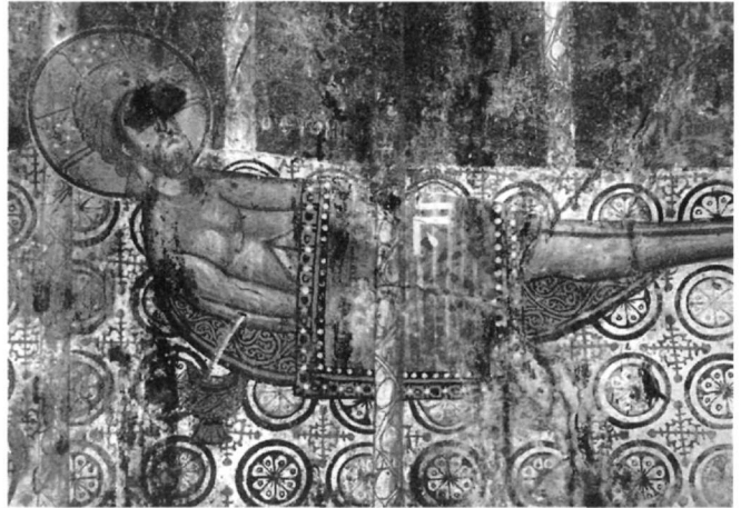
Εἰκ. 8. Μαλέας, Ἁγιος Γεώργιος. Ὁ Χριστός-θυόμενος ἢ μελιζόμενος.

Ἡ ἴδια ἀντίληψη ἀκολουθεῖται καί στίς ἐρμηνεῖες τῆς θείας λειτουργίας τοῦ Θεοδώρου Ἀνδίδων (1054-1067 περ.) καί τοῦ Νικολάου Καβάσιλα (1322-1392/97 περ.)· στήν πρώτη ἀναφέρεται: ...τά ἐν τῇ θείᾳ ἱερουργίᾳ τελούμενα τύπον εἶναι τοῦ σωτηρίου πάθους καί τῆς ταφῆς καί τῆς ἀναστάσεως τοῦ Χριστοῦ καί θεοῦ ἡμῶν καί στή δεύτερη: ὁμοίως ὁ οἶνος, αὐτό τό αἷμα τό ἐκπηδήσαν ἐσφαττομένον τοῦ σώματος 59 . Ἐπίσης, στίς ἐρμηνεῖες πού ἄπτονται τῶν συμβολισμῶν τῶν χώρων τοῦ ναοῦ καί τῶν λειτουργικῶν ἀντικειμένων, ἡ κόγχη, ἡ πρόθεση καί ἡ ἁγία τράπεζα συνδέονται μέ τό σπήλαιο ὅπου ἐτάφη ὁ Κύριος ἢ τόν Κρανίου τόπον 60 . Τό εἰλητό σχετίζεται μέ τή σινδόνή μέ τήν ὁποία τυλίχθηκε καί ἐνταφιάσθηκε ὁ Χριστός 61 , ἡ λόγχη καί ὁ σπόγγος μέ τή Σταύρωση 62 , τό κάλυμμα μέ τό σουδάριον καί τήν ταφή του, καί ὁ ἀέρας μέ τή σινδόνή 63 . Ὡς ἐκ τούτου καί ἡ εἰκονογραφική λεπτομέρεια στήν ἀψίδα τοῦ Ἁγίου Παντελεήμονα, ὅπου ἡ ἁγία τράπεζα, πάνω στήν ὁποία εἶναι ξαπλωμένος ὁ εὐχαριστιακός Χριστός, μοιάζει μέ νεκροκρέβατο (Εἰκ. 1, 3), ἀκολουθεῖ τόν πατερικό συμβολισμό, σύμφωνα μέ τόν ὁποῖο ἡ ἁγία τράπεζα τάφος Χριστοῦ ἐπικέκληται 64 . Πιο συγκεκριμένα, ἡ εἰκόνιση τοῦ εὐχαριστιακοῦ Χριστοῦ νεκροῦ θυομένου-μελιζομένου στό θέμα τοῦ Μελισμοῦ μεταφέρει σέ εἰκόνα ὀρισμένες στιγμές ἀπό τό κείμενο καί τό τυπικό τῆς θείας λειτουργίας. Εἶναι ἡ στιγμή κατά τήν ἀκολουθία τῆς προσκομιδῆς, ὅταν ὁ ἱερέας λογχίζει τό λειτουργικό ἀμνό στή δεξιά πλευρά του λέγοντας: εἷς τῶν στρα-