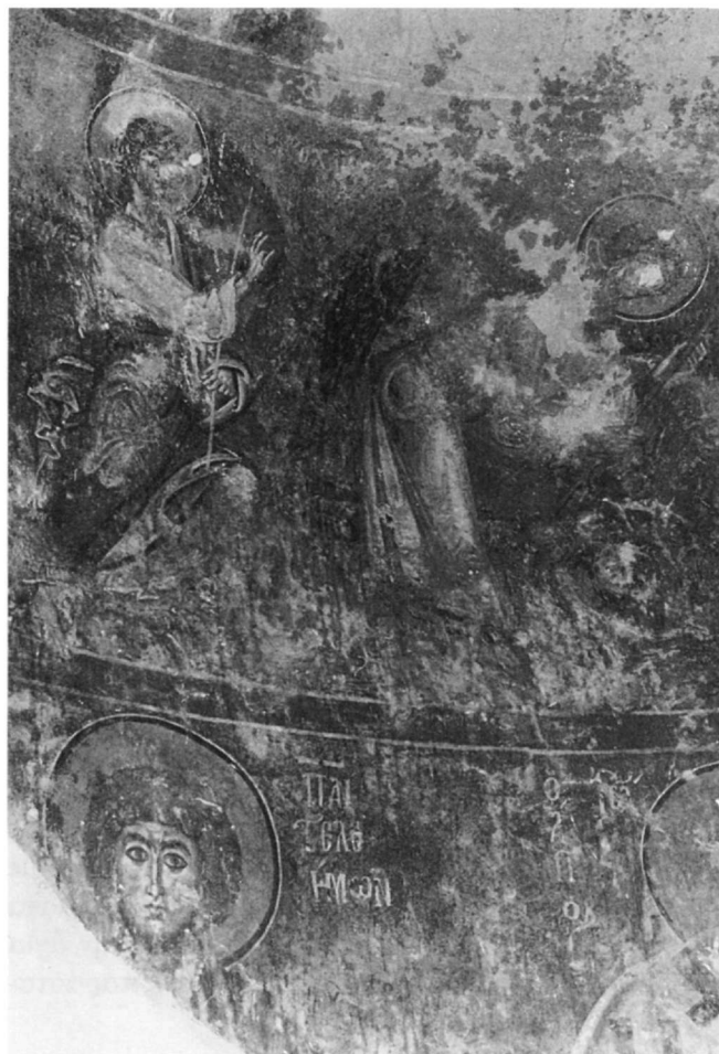
Εἰκ. 2. Βελανίδια, Ἅγιος Παντελεήμονας. Βόρειο ἄκρο τοῦ ἡμικυλίνδρου τῆς ἀψίδας.

Ὁ ἐπώνυμος ἅγιος τοῦ ναοῦ 15 , τοῦ ὁποῦ διασώζεται μόνον ἡ κεφαλή, ταυτίζεται ἀπό τήν ἐπιγραφή ἀλλά καί ἀπό τά φυσιογνωμικά του χαρακτηριστικά (Εἰκ. 2) 16 . Ἡ μετωπική μορφή τοῦ ἁγίου πού εἰκονίζεται πίσω ἀπό τό Χρυσόστομο, ἔχει καταλάβει τή θέση ὅπου, κατά τό καθιερωμένο εἰκονογραφικό πρόγραμμα, θά ἔπρεπε νά εἰκονίζεται ἕνας ἀκόμη συλλειτουργῶν ἱεράρχης ἀπό τήν παράσταση τοῦ Μελισμοῦ. Παρόμοια ἀπόκλιση παρατηρεῖται στήν ἀψίδα δύο κοντινῶν μνημείων τοῦ δεύτερου μισοῦ τοῦ 13ου αἰώνα, τοῦ Ἁγίου Νικολάου στόν Ἅγιο Νικόλαο Μονεμβασίας (δεύτερο μισό τοῦ 13ου αἰ.) 17 καί τοῦ Ἁι-Πάννη Ποταμίτη ἔξω ἀπό τήν Κοκκάλα τῆς Προσηλιακῆς Μάνης (1275-1300) 18 . Ἀπό τήν ἴδια ἐποχή ἐντοπίζονται στόν ἡμικύλινδρο τῆς ἀψίδας παραστάσεις διαφόρων κατηγοριῶν ἁγίων, εἴτε ἀνάμεσα σέ ἱεράρχες, ὅπως στό ναό τῆς Παναγίας «στῆς Παλλοῦς» στή Νάξο (1288/89) 19 , εἴτε χωρίς τήν