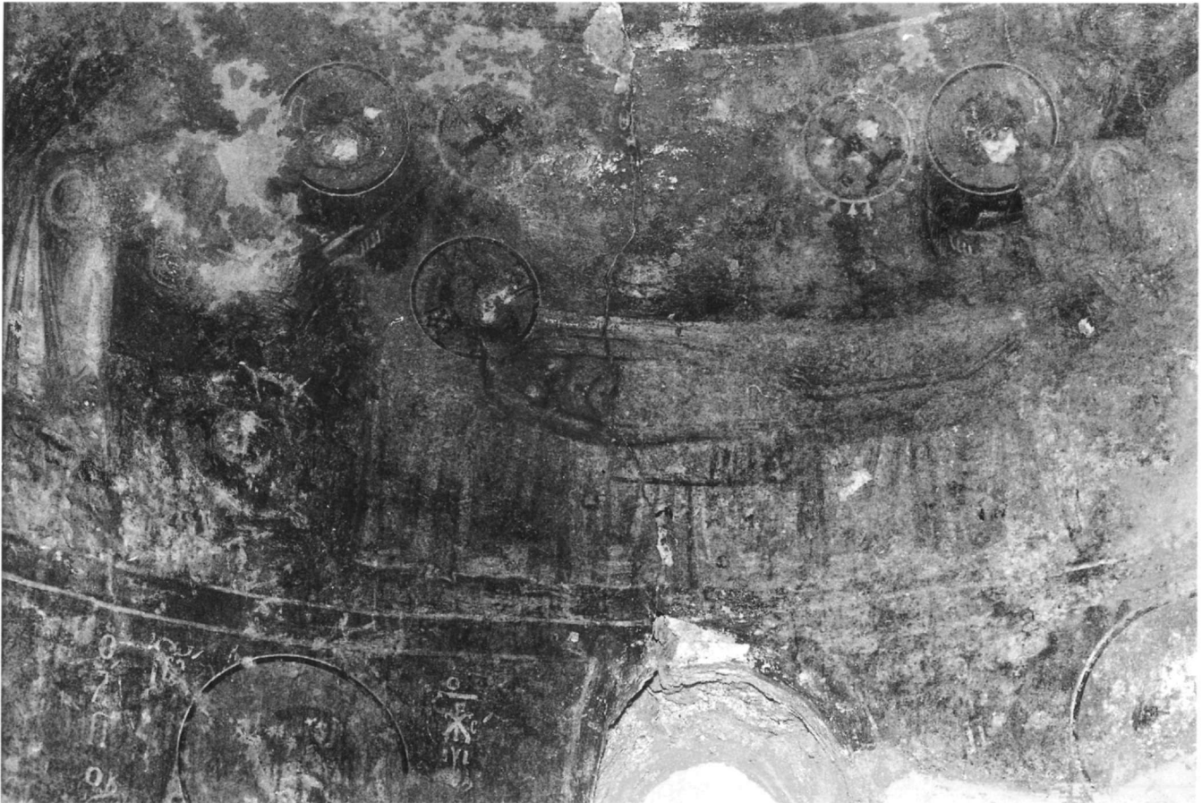
Εἰκ. 3. Βελανίδια, Ἅγιος Παντελεήμονας. Ὁ Χριστός-θνόμενος ἢ μελιζόμενος.

δρου 31 ἢ καταλαμβάνει καί τις δύο ζῶνες του, ὅπως στόν Ἅγιο Παντελεήμονα 32 , μιά θέση πού στάθηκε μεταβατική καί ὀφειλόταν μᾶλλον στήν ἐπιθυμία νά μήν ἐμποδίζεται ἡ θέαση τῆς παράστασης ἐξαιτίας τοῦ τέμπλου τοῦ ναοῦ 33 . Στίς δίζωνες αὐτές συνθέσεις, ὁ εὐ-