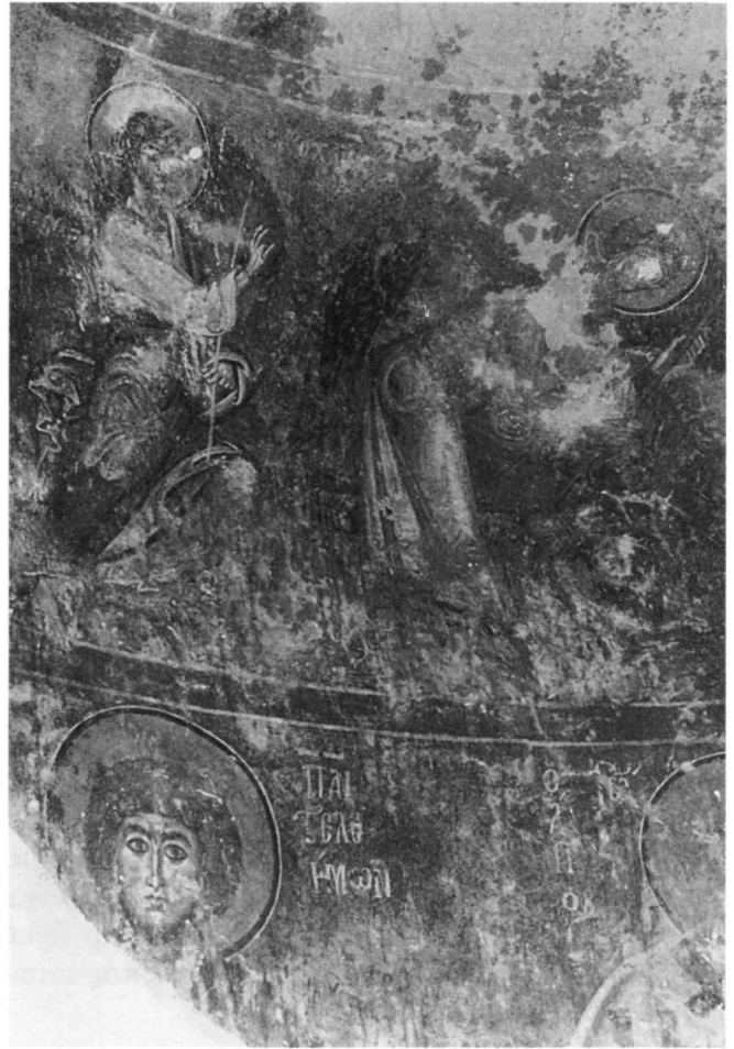
Εἰκ. 2. Βελανίδια, Ἅγιος Παντελεήμονας. Βόρειο ἄκρο τοῦ ἡμικυλίνδρου τῆς ἀψίδας.

Ὁ ἐπώνυμος ἅγιος τοῦ ναοῦ 15 , τοῦ ὁποῦ διασώζεται μόνον ἡ κεφαλή, ταυτίζεται ἀπό τήν ἐπιγραφή ἀλλά καί ἀπό τά φυσιογνωμικά του χαρακτηριστικά (Εἰκ. 2) 16 . Ἡ μετωπική μορφή τοῦ ἁγίου πού εἰκονίζεται πίσω ἀπό τό Χρυσόστομο, ἔχει καταλάβει τή θέση ὅπου, κατά τό καθιερωμένο εἰκονογραφικό πρόγραμμα, θά ἔπρεπε νά εἰκονίζεται ἕνας ἀκόμη συλλειτουργῶν ἱεράρχης ἀπό τήν παράσταση τοῦ Μελισμοῦ. Παρόμοια ἀπόκλιση παρατηρεῖται στήν ἀψίδα δύο κοντινῶν μνημείων τοῦ δεύτερου μισοῦ τοῦ 13ου αἰῶνα, τοῦ Ἁγίου Νικολάου στόν Ἅγιο Νικόλαο Μονεμβασίας (δεύτερο μισό τοῦ 13ου αἰ.) 17 καί τοῦ Ἁι-Πάννη Ποταμίτη ἔξω ἀπό τήν Κοκκάλα τῆς Προσηλιακῆς Μάνης (1275-1300) 18 . Ἀπό τήν ἴδια ἐποχή ἐντοπίζονται στόν ἡμικύλινδρο τῆς ἀψίδας παραστάσεις διαφόρων κατηγοριῶν ἁγίων, εἴτε ἀνάμεσα σέ ἱεράρχες, ὅπως στό ναό τῆς Παναγίας «στῆς Παλλοῦς» στή Νάξο (1288/89) 19 , εἴτε χωρίς τήν