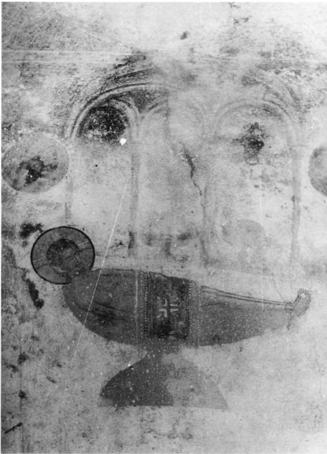
Εικ. 6. Κάτω Καστανιά, Άγιος Άνδρέας. Ό Μελισμός.