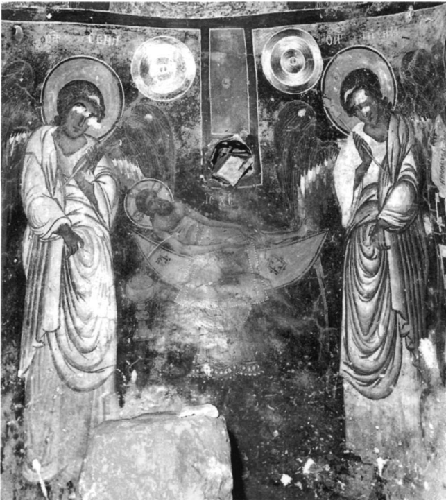
Εικ. 4. Καφιόνα, Άγιοι Θεόδωροι. Ο Μελισμός.

μενη βιβλιογραφία). Κωνσταντινίδη, Ο Μελισμός , σ. 343 κ.έ.