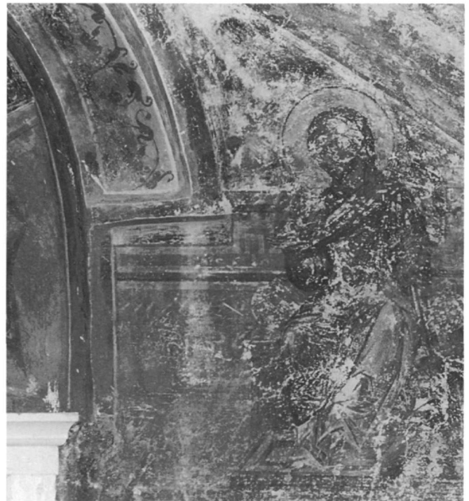
Εικ. 2-3. Ο Ευαγγελισμός της Παναγίας.

αναβιώνουν στη ζωγραφική έργων της κρητικής τέχνης. Έτσι, η πλούσια πτυχολογία του μανδύα που ανεμίζει, η περίτεχνη στρατιωτική ενδυμασία με τους θώρακες και τις μεταλλικές λάμες που τους συγκρατούν, οι ταινίες με τις οποίες τυλίγουν το κάτω μέρος των ποδιών και η ασπίδα με τη μάσκα απαντούν σε φορητές εικόνες κρητικής τέχνης του 15ου αιώνα 10 , οι οποίες είναι έργα του ζωγράφου Άγγελου ή συνδέονται με το εργαστήριο του Ανδρέα Ριτζου.