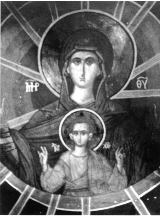
Εικ. 1. Μεγίστη Λαύρα. Παρεκκλήσιο Αγίου Νικολάου. Ἡ Βλαχερνίτισσα.

καί οἱ τροῦλοι στούς νάρθηκες τῶν ναῶν τῆς Μολδαβίας τοῦ Homo 10 καί τῆς Vatra Moldovitei 11 (16ος αἰ.). Δέκα προφήτες μέ σύμβολα τῆς Θεοτόκου πλαισιώνουν, στόν ἴδιο χῶρο, ἔνθρονη Βρεφοκρατούσα σέ τοιχογραφία τοῦ δυτικοῦ τμήματος τῆς καμάρας τοῦ