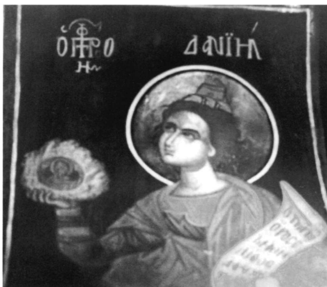
Εἰκ. 3. Ὁ προφήτης Δανιήλ.

μακρὸ λαίμω. Φορεῖ καὶ αὐτὸς τὸ προφητικὸ πιλίδιο· ὁ χιτώνας του κυανὸς καὶ τὸ ἱμάτιο κεραμιδί. Μὲ τὸ ὑψοῦμενο δεξιὸ χέρι κρατεῖ κίτρινο μεγάλο λίθο, μέσα στὸν ὁποῖο ὁ τεφρὸς δίσκος μὲ τὸ στηθάριο· μὲ τὸ ἄλλο χέρι ὁ Δανιήλ κρατεῖ εἰλητάριο, ὅπου διαβάζεται: Οτι ἀπὸ / ὄρους ἐτμήθη / λίθος / ἀγνή / ῥω 26 .