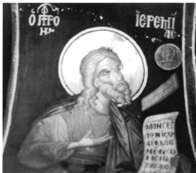
Εἰκ. 4. Ὁ προφήτης Ἱερεμίας.

Οἱ στίχοι παραλλάσσουν λίγο ἀπὸ τοὺς σημειούμενους στὴν Ἑρμηνεία (σ. 146): Ἐγὼ σε εἶδον Ἰσραήλ, κόρη, νέον / ζωῆς πρὸς τρίβους ὀδγοῦσας, παρθένε , ἐνῶ εἶναι σχεδὸν ὅμοιοι πρὸς τοὺς ἀναγραφόμενους ἄλλοῦ στὸ ἴδιο βιβλίον (στὴ σ. 282, Στίχοι εἰς τὸ Ἄνωθεν οἱ Προφῆται ). Ἐπάνω ἀπὸ τὸ εἰλητό συμβολικὴ παράσταση δρόμου σάν μετέωρο, λοξό, σταρόχρωμο, παραλ-