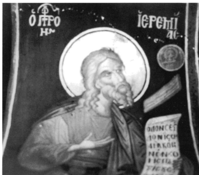
Εἰκ. 4. Ὁ προφήτης Ἱερεμίας.

ληλόγραμμα, μὲ κυματιστὲς γραμμὲς καὶ ψηλότερα ὁ γνωστὸς τεφρὸς δίσκος.