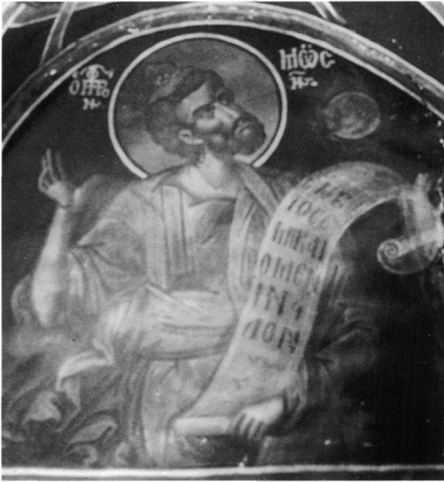
Εικ. 2. Ο προφήτης Μωυσής.

ρος μικρός, τεφρός δίσκος με τήν προτομή της δεομένης Θεοτόκου σε μονοχρωμία· από τόν δίσκο ξεπετιώνται κόκκινες φλόγες. Καί στόν τροῦλο τῆς Περιβλέπτου τοῦ Μυστραῶ ὁ ὀλόσωμος προφήτης Μωυσῆς κρατεῖ στό δεξιό χέρι μικροσκοπική βάτο, στό μέσον τῆς ὁποίας εἰκονίζεται μέσα σέ κύκλο μέ γκριζωπό κάμπο τό στηθάριο τῆς Παναγίας 17 . Κρατεῖ ἀκόμη ὁ προ-