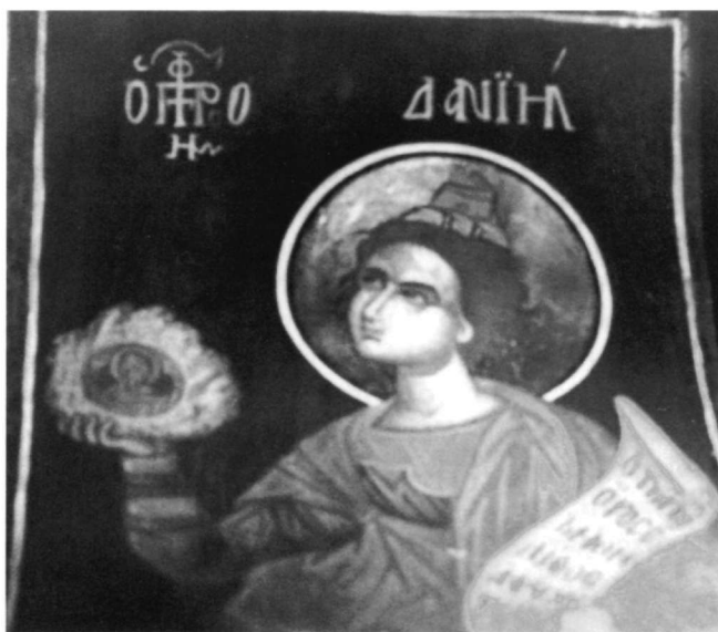
Εἰκ. 3. Ὁ προφήτης Δανιήλ.

μακρὸ λαίμω. Φορεῖ καὶ αὐτὸς τὸ προφητικὸ πιλίδιο· ὁ χιτώνας του κυανὸς καὶ τὸ ἱμάτιο κεραμιδί. Μὲ τὸ ὑψοῦμενο δεξιὸ χέρι κρατεῖ κίτρινο μεγάλο λίθο, μέσα στὸν ὁποῖο ὁ τεφρὸς δίσκος μὲ τὸ στηθάριο· μὲ τὸ ἄλλο χέρι ὁ Δανιήλ κρατεῖ εἰλητάριο, ὅπου διαβάζεται: Οτι ἀπὸ / ὄρους ἐτμήθη / λίθος / αἰγιχ / ρω 26 .