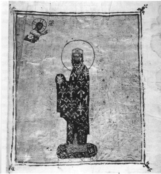
Fig. 5. Vat. gr. 666, fol. 2r (Cutler et Spieser 1996).

de ce verset – qui nous semble digne d’un commentaire – ne doit cependant pas être rattaché directement au καθαροτήριον πῦρ, question qui a jadis tenté l’Orient et qui entrera,