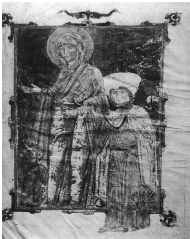
Fig. 2. Petrop. gr. 291, fol. 3v (Cutler et Spieser 1996).

En ce qui concerne la difficulté d'attribuer cet épigramme à Constantin Monomaque, l'acceptation du péché de la part d'un empereur étant une idée difficilement admissible 11 , il est à noter que ce n'est pas la première fois que la peur du Jugement Dernier – idée centrale de ce poème – est liée à