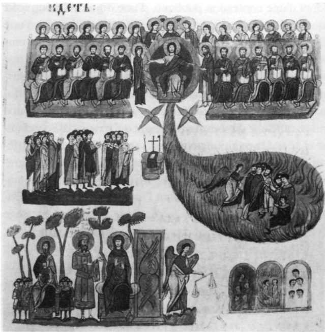
Fig. 4. B.M. Add. 39627, fol. 124r (Spatharakis 1976).

les sources hagiologiques autour des VIIIe-IXe siècles, est un sujet lié à l'empereur dans l'historiographie de l'époque des Macédoniens, puis proclamé avec insistance dans les Typica