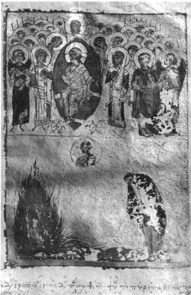
Fig. 6. Mont Athos, Dionysiou 65, fol. 11r (Photo Monastère Dionysiou).

qui ornait le même palais ? Voir Magdalino et Nelson, op.cit. (n. 17), p. 126-130. Pour une séquence iconographique analogue – peur du pécheur devant le jugement, puis figuration de sa mort – voir les fols 11r, 11v du psautier 65 de Dionysiou, supra n. 51.