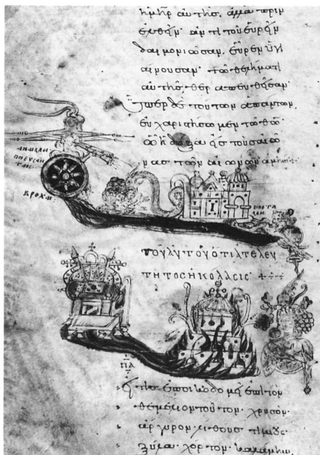
Fig. 7. Athènes B.N., codex 211, fol. 151v (Marava-Chatzinicolaou et Toufexi-Paschou 1997).

Nos deux Ekphrasis permettraient une connaissance, pas tant du “contenu” des compositions décrites que de ce que