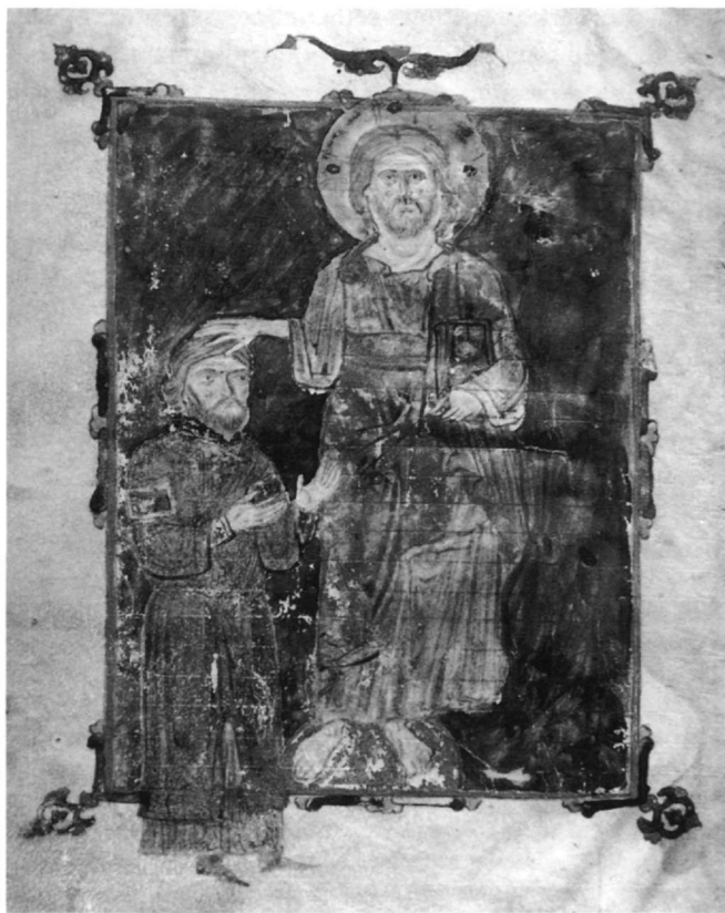
Fig. 1. Petrop. gr. 291, fol. 2v (Cutler et Spieser 1996).

pous dont le rôle dans le sens nouveau de la Deisis a été mis en relief 9 . De même, dans le premier épigramme, la prostration de l'empereur devant Dieu – εἰς πόδας, dit le texte de la description – connue dans l'iconographie des fondateurs mais rare pour le souverain, est également à retenir 10 .