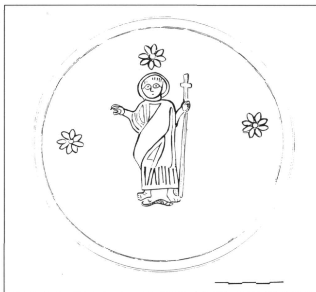
Εικ. 2. Σχεδιαστική αποτύπωση της διακόσμησης στον πυθμένα του πινακίου.

Όσον αφορά την ερμηνεία της παράστασης, δεν υπάρχει αμφιβολία ότι αυτή απεικονίζει το Χριστό θριαμβευτή, να κατατροπώνει τη δύναμη του κακού, προσωποποιημένη από το μικρό φίδι, που ταυτίζεται με το βασιλίσκο της Γραφής, το πιο επικίνδυνο από τα ιοβόλα φίδια, σύμβολο, κατά τους Πατέρες, του θανάτου, του διαβόλου και της αμαρτίας 12 . Η παράσταση του Χριστού νικητή των δυνάμεων του κακού, εμπνευσμένη από το κείμενο του ψαλμού 90, 13 ( ἐπὶ ἀσπίδα καὶ βασιλίσκον ἐπιβήσῃ καὶ καταπατήσῃ λέοντα καὶ δράκοντα ) εμφανίζεται στην παλαιοχριστιανική τέχνη από τον 4ο αιώνα. Ο Χριστός εικονίζεται συνήθως να καταπατεί τα τέσσερα «ζώδια» που αναφέρονται στον ψαλμό, δηλαδή την ασπίδα και το βασιλίσκο – δύο από τα πιο φαρμακερά είδη φιδιών –, το λέοντα και το δράκοντα 13 . Η παράσταση του Χριστού θριαμβευτή κατά των δυνάμεων του κακού, η οποία, όπως έχει παρατηρήσει ο Α. Grabar 14 , έχει ως πρότυπο την εικονογραφία του αυτοκράτορα, δεν αποτελεί συχνό θέμα στη μνημειακή τέχνη της παλαιοχριστιανικής εποχής. Τα περισσότερα παραδείγματά της απαντούν στη Ραβέννα, με αρχαιότερο τη σαρκοφάγο Pignata, του τέλους του 4ου-αρχών του 5ου αιώνα, και γνωστότερο το ψηφιδωτό στην ασπίδα του παρεκκλησίου του αρχιεπισκοπικού μεγάρου, του τέλους του 5ου-αρχών του 6ου αιώνα 15 . Πριν από τα μνημεία της Ραβέννας, το θέμα αυτό