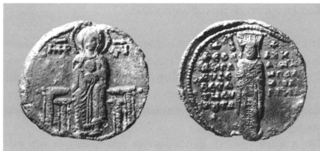
Εικ. 7. Μολυβδόβουλλο Θεοδώρας Δούκαινας Παλαιολογίνας (1259-1282) (Αθήνα, Νομισματικό Μουσείο: Κωνσταντόπουλος, αριθ. 284).

Η εικονογραφική επιλογή μολυβδοβούλλων που ανήκαν σε άρχοντες των μικρότερων αυτοκρατοριών που ιδρύθηκαν μετά το 1204 διέπεται από την ίδια φιλοσοφία. Για παράδειγμα ο στρατηλάτης άγιος Θεόδωρος απεικονίζεται σε σφραγίδα του Θεόδωρου Α΄ Κομνηνού Λάσκαρι, αυτοκράτορα της Νικαίας 31 , και ο άγιος Δημήτριος, ο πολιούχος της Θεσσαλονίκης, σε σφραγίδα του Ιωάννη Κομνηνού Δούκα (1237-1244) 32 . Η ύπαρξη και δεύτερου τύπου σφραγίδας του αυτοκράτορα Θεσσαλονίκης, με την παράσταση του ολόσωμου Ιησού στην κύρια όψη 33 , υποδηλώνει μια επιλογή βασισμένη σε προπαγάνδα μεγαλύτερης γεωγραφικής εμβέλειας με στόχο τον τονισμό του αυτοκρατορικού τίτλου και μια τάση επικυριαρχίας στην αυτοκρατορία της Νι-