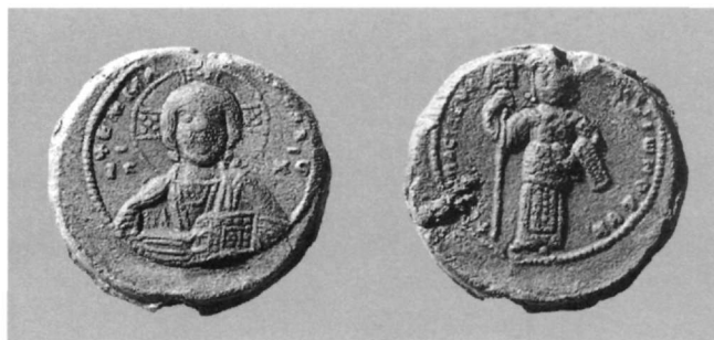
Εικ. 5. Μολυβδόβουλλο Κωνσταντίνου Γ' (1060-1067 μ.Χ.) (Αθήνα, Νομισματικό Μουσείο: Κωνσταντόπουλος, αριθ. 281).

Η παράσταση του ένθρονου Χριστού, η οποία στα νομίσματα εμφανίζεται παράλληλα και εναλλάσσεται κανονικά με αυτή της προτομής ήδη από το 1025, καθιερώνεται στα μολυβδόβουλλα με τη βασιλεία του Νικη-