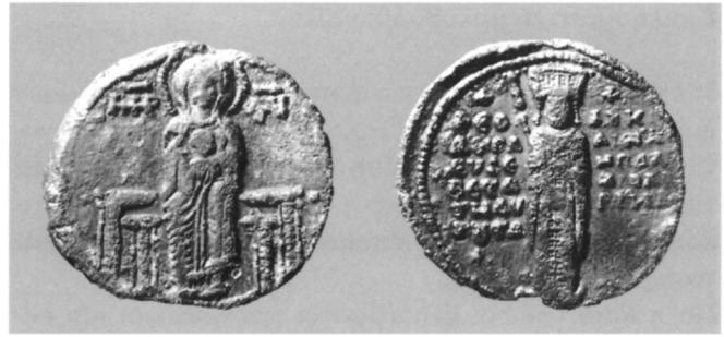
Εικ. 7. Μολυβδόβουλλο Θεοδώρας Δούκαινας Παλαιολογίνας (1259-1282) (Αθήνα, Νομισματικό Μουσείο: Κωνσταντόπουλος, αριθ. 284).

καίας. Αυτό άλλωστε επιβεβαιώνεται και από τη συνοδευτική επιγραφή, όπου ο Ιωάννης αναφέρεται ως ἐν Χριστῷ τῷ Θεῷ πιστὸς βασιλεὺς καὶ αὐτοκράτωρ Ῥωμαίων . Η συγκεκριμένη σφραγίδα χρονολογείται στην προ του 1242 περίοδο, προτού δηλαδή ο Ιωάννης αναγκαστεί, κάτω από την πίεση του Βατάτζη, να αποποιηθεί τον τίτλο του αυτοκράτορα και να κρατήσει τον τίτλο του δεσπότη.