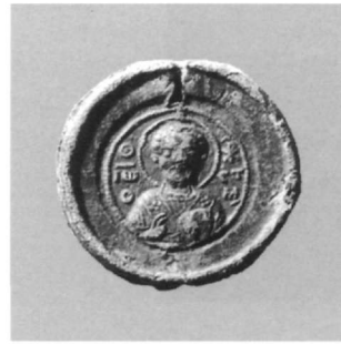
Εικ. 23. Μολυβδόβουλλο Ιωάννη του Ριζινού (Αθήνα, Νομισματικό Μουσείο: Κωνσταντόπουλος, αριθ. 686).