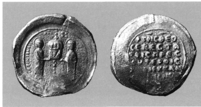
Εικ. 8. Μολυβδόβουλλο των θεοσεβεστάτων πρεσβυτέρων και εκκλησιαστικών της Αγίας Σοφίας (Αθήνα, Νομισματικό Μουσείο: 1913-14, ΝΘ'3).

Μέσα σε αυτό το πλαίσιο η μεγάλη συχνότητα της απεικόνισης κάποιου αγιολογικού προσώπου ή αγιολογικής σύνθεσης σε εκκλησιαστικές σφραγίδες μιας