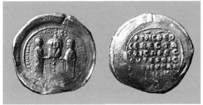
Εικ. 8. Μολυβδόβουλλο των θεοσεβεστάτων πρεσβυτέρων και εκκλησιεκδικών της Αγίας Σοφίας (Αθήνα, Νομισματικό Μουσείο: 1913-14, ΝΘ'3).

Μέσα σε αυτό το πλαίσιο η μεγάλη συχνότητα της απεικόνισης κάποιου αγιολογικού προσώπου ή αγιολογικής σύνθεσης σε εκκλησιαστικές σφραγίδες μιας