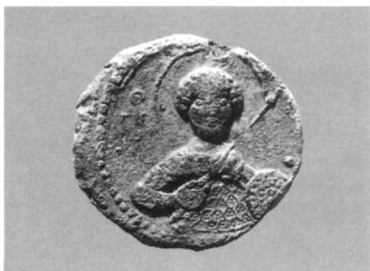
Εικ. 19. Μολυβδόβουλλο Ιωάννη Κομνηνού Κουροπαλάτη (Αθήνα, Νομισματικό Μουσείο: Κωνσταντόπουλος, αριθ. 386).

οικογένειας των Κομνηνών. Οι σφραγίδες του Ισαακίου Α' Κομνηνού, πριν γίνει αυτοκράτορας, όπως και οι σφραγίδες του αδελφού του Ιωάννη Κομνηνού, πατέρα του μετέπειτα αυτοκράτορα Αλεξίου Α', απεικονίζουν τον άγιο Γεώργιο 86 (Εικ. 19). Αντίθετα, ο Ισαάκιος, ο μεγαλύτερος αδελφός του μετέπειτα αυτοκράτορα Αλεξίου, διαφοροποιώντας τις σφραγίδες του από αυτές του ομώνυμου θείου του, προτίμησε την απεικόνιση του αγίου Θεοδώρου 87 . Η εικόνα του αγίου Γεωργίου, ολόσωμου αυτή τη φορά, επανεμφανίζεται στα μολυβδόβουλλα του Αδριανού Κομνηνού, νεότερου αδελφού του αυτοκράτορα Αλεξίου Α' Κομνηνού 88 (Εικ. 20), καθώς και άλλων μελών της οικογένειας (Εικ. 21).