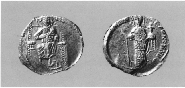
Εικ. 6. Μολυβδόβουλλο Αλεξίου Α΄ Κομνηνού (1081-1118) (Αθήνα, Νομισματικό Μουσείο: Κωνσταντόπουλος, αριθ. 282).

γενικότερες προσπάθειες κατοχύρωσης της αυτοκρατορικής του υπόστασης 30 . Στα νομίσματα η απεικόνιση του αγίου στην πίσω όψη, δίπλα στον αυτοκράτορα, με τη μορφή του Χριστού να δεσπάζει στην πρόσθια, υποδηλώνει μια «θεία χάριτι» μεταμόρφωση του αυτοκράτορα σε επίγειο βασιλιά. Αντίθετα η αυθύπαρκτη παρουσία του προστάτη αγίου στην πρόσθια όψη της σφραγίδας, αντικαθιστώντας την καθιερωμένη παράσταση του ένθρονου Ιησού, μετατρέπεται σε «λαλούν» σύμβολο της ταυτότητας του αυτοκράτορα.