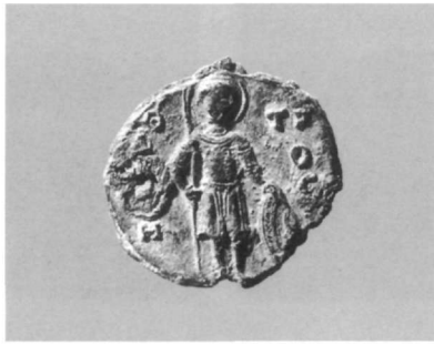
Εικ. 22. Μολυβδόβουλλο Δημητρίου Καλαμαρά (Αθήνα, Νομισματικό Μουσείο: Κωνσταντόπουλος, αριθ. 630).