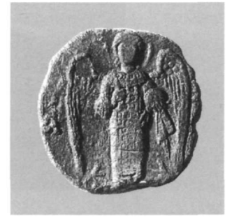
Εικ. 24. Μολυβδόβουλλο Μιχαήλ σεβαστού (Αθήνα, Νομισματικό Μουσείο: Κωνσταντόπουλος, αριθ. 493).

επιβεβαιώνει την ταύτιση του Γαβριήλ, πρωτοκουροπαλάτη, αμηρά και δούκα 95 , με τον Γαβριήλ, πρωτονωβελίσμο και δούκα πόλεως Μελωνύμου 96 . Η εικόνα της ολόσωμης Παναγίας προς τα αριστερά, με προτεταμένα τα χέρια σε στάση δέησης, αποδεικνύει ότι ο Μιχαήλ Βαρύς, μάγιστρος, μέγας χαρτουλάριος, κριτής του Ιπποδρόμου και των Βουκελλαρίων, είναι το ίδιο πρόσωπο με τον Μιχαήλ Βαρύ, πρόεδρο, κριτή του Βήλου και κοιαίστορα, καθώς και με τον Μιχαήλ κουροπαλάτη (Εικ. 25). Ωστόσο, είναι δύσκολο να ταυτίσουμε τον Μιχαήλ Βαρύ, πρωτοσπαθάριο, εξάκτορα και κριτή του Αιγαίου Πελάγους, με την παραπάνω προσωπικότητα δεδομένου ότι η σφραγίδα του είναι ανεικονική, δεν ακολουθεί δηλαδή την καθιερωμένη εικονογραφία 97 . Η επιλογή ανεικονικής σφραγίδας δεν προϋποθέτει βέβαια αναγκαστικά και ετεροπροσωπία του κατόχου της από τον κάτοχο των σφραγίδων με την απεικόνιση της ολόσωμης Θεοτόκου. Οι τίτλοι που αναφέρονται στην ανεικονική σφραγίδα την καθιστούν χρονολογικά πρώτη στη σειρά της καριέρας του Μιχαήλ Βαρύ και η συγκεκριμένη επιλογή θα μπορούσε επομένως να έγινε κάτω από διαφορετικά κριτήρια. Η παράσταση της Θεοτόκου πιθανόν να ανταποκρίνεται στην περίοδο μετά την ανάρρηση στο θρόνο του Νικηφόρου Βοτανειάτη, την περίοδο δηλαδή που ο Μιχαήλ Βαρύς εκτός από τα διοικητικά του αξιώματα, «αξίες διά λόγου» αποκτά σταδιακά και τιμητικούς τίτλους, «αξίες διά βραβείων».