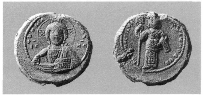
Εικ. 5. Μολυβδόβουλλο Κωνσταντίνου Γ' (1060-1067 μ.Χ.) (Αθήνα, Νομισματικό Μουσείο: Κωνσταντόπουλος, αριθ. 281).

Η παράσταση του έθρονου Χριστού, η οποία στα νομίσματα εμφανίζεται παράλληλα και εναλλάσσεται κανονικά με αυτή της προτομής ήδη από το 1025, καθιερώνεται στα μολυβδόβουλλα με τη βασιλεία του Νικη-