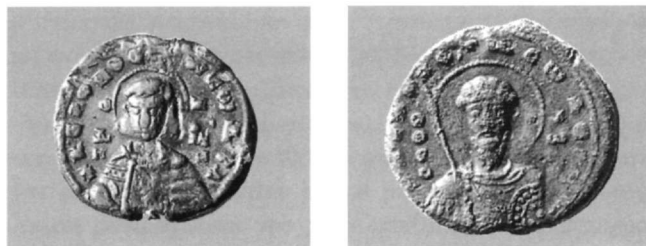
Εικ. 9. Μολυβδόβουλλο Ιακώβου, αρχιεπισκόπου Θεσσαλονίκης (Αθήνα, Νομισματικό Μουσείο: Κωνσταντόπουλος, αριθ. 8ε).