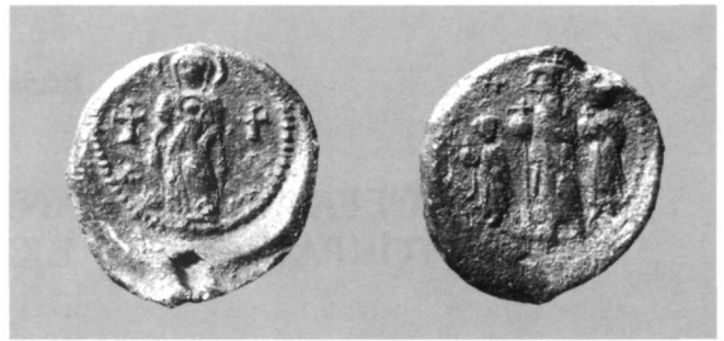
Εικ. 2. Μολυβδόβουλλο δυναστείας Ηρακλείου (Αθήνα, Νομισματικό Μουσείο: 1909-10, ΚΘ'1).

προφανώς πηγάζει από την επιθυμία του ανώτατου άρχοντα, στο πλαίσιο της ανθρώπινης ιδιοσυγκρασίας για την αναζήτηση του καθαρά προσωπικού, να επιλέγει, ταυτόχρονα με την επίσημη, και την ιδιωτική-προσωπική του σφραγίδα.