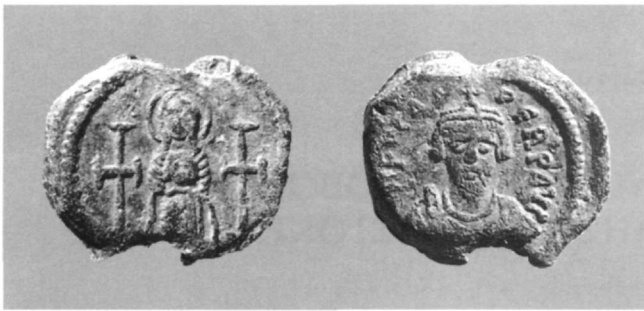
Εικ. 1. Μολυβδόβουλλο Φωκά (602-610 μ.Χ.) (Αθήνα, Νομισματικό Μουσείο: Κωνσταντόπουλος, αριθ. 275 ).