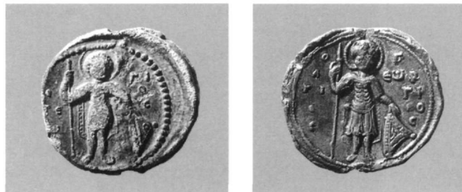
Εικ. 20. Μολυβδόβουλλο Αδριανού Κομνηνού πρωτοσεβαστου και μεγάλου δομέστικου πάσης Δύσεως (Αθήνα, Νομισματικό Μουσείο: Κωνσταντόπουλος, αριθ. 337).

Οι Cheynet και Morrisson, στην προσπάθειά τους να δώσουν όσο το δυνατό πιο ολοκληρωμένη εικόνα των παραγόντων που διαμόρφωσαν το εικονογραφικό περιεχόμενο των μολυβδοβούλλων, έχουν εντοπίσει ενδιαφέροντα παραδείγματα σχετικά με την εικονογρα-