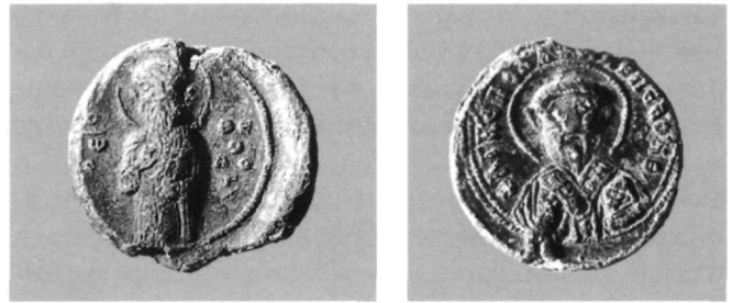
Εικ. 11. Μολυβδόβουλλο του προέδρου Εφέσου (Αθήνα, Νομισματικό Μουσείο: Κωνσταντόπουλος, αριθ. 136).

Υπάρχουν περιπτώσεις όπου οι κάτοχοι των σφραγίδων, μαζί με τον πάτριον άγιο της διοίκησης την οποία αναλαμβάνουν, παραθέτουν και την προσωπική τους επιλογή. Ενδεικτικά αναφέρουμε τη σφραγίδα του Στεφάνου, μητροπολίτη Σερρών, στην εικονογράφηση της οποίας θα επανέλθουμε, καθώς και του Λέοντος, μητροπολίτη Χαλκηδόνος, με την απεικόνιση της αγίας Ευφημίας στην πίσω όψη και της Σταύρωσης στην πρόσθια 52 . Η απεικόνιση σε σφραγίδες σκηνών από το χριστολογικό κύκλο είναι εξαιρετικά σπάνια και ακόμη σπανιότερη η παράσταση της Σταύρωσης 53 . Είναι δύσκολο να προσδιοριστεί το κίνητρο αυτής της επιλογής εκ μέρους του Λέοντα. Ωστόσο, η μεγάλη σπανιότητα του εικονογραφικού θέματος της Σταύρωσης οδηγεί στη σκέψη ότι πρόκειται για μια καθαρά προσωπική επιλογή του κατόχου της σφραγίδας, το κίνητρο της οποίας θα πρέπει να επικεντρωθεί σε συγκεκριμένο οικογενειακό λατρευτικό κεμήλιο. Ο Ιάκωβος Θεσσαλονίκης απεικονίζει στην κύρια όψη της σφραγίδας του παραλλαγή της Δέησης, αντικαθιστώντας τη μορφή του Βαπτιστή με αυτή του τοπικού μάρτυρα αγίου Δημητρίου 54 . Στην περίπτωση της σφραγίδας του Ιωάννη, μητροπολίτη της ίδιας πόλης, ο άγιος Δημήτριος συνδυάζεται με τη Θεοτόκο. Έχει προταθεί ότι