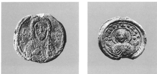
Εικ. 14. Μολυβδόβουλλο του Αγίου Θεοδώρου, ηγουμένου της Μονής Στουδίου (Αθήνα, Νομισματικό Μουσείο: Κωνσταντόπουλος, αριθ. 28).