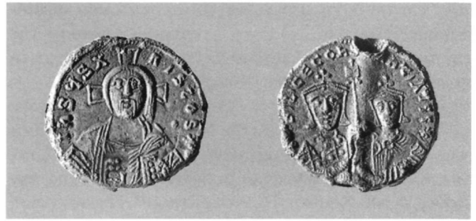
Εικ. 4. Μολυβδόβουλλο Βασιλείου Α' (867-886 μ.Χ.) (Αθήνα, Νομισματικό Μουσείο: Κωνσταντόπουλος, αριθ. 279).

Η οριστική αναστήλωση των εικόνων από τον αυτοκράτορα Μιχαήλ Γ' και τη μητέρα του Θεοδώρα (843) ανοίγει ένα νέο κεφάλαιο στην εικονογράφηση των αυτοκρατορικών μολυβδοβούλλων. Η μορφή της Θεοτό-