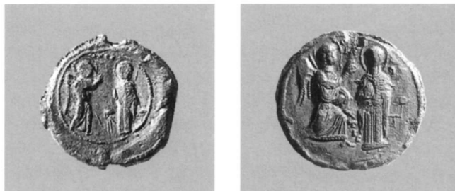
Εικ. 16. Μολυβδόβουλλο με παράσταση του Ευαγγελισμού, του Χριστοφόρου σεβαστοφόρου (Αθήνα, Νομισματικό Μουσείο: Κωνσταντόπουλος, αριθ. 498β).

Πολλές φορές η επιλογή των λατρευτικών προτύπων εναλλάσσεται ανάμεσα στα μέλη της ίδιας οικογένειας, υπακούοντας προφανώς σε καθαρά προσωπικές προτιμήσεις, οι οποίες διαμορφώνονται από ποικίλους παράγοντες: απόδοση ευχαριστίας σε αγίους που ήρθαν αρωγοί σε συγκεκριμένες δύσκολες στιγμές, αναζήτηση προ-