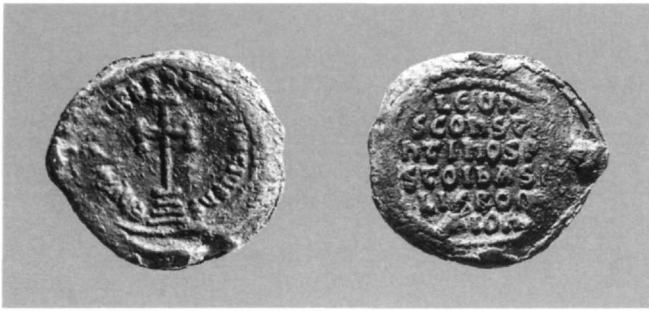
Εικ. 3. Μολυβδόβουλλο Λέοντος Γ' και Κωνσταντίνου Ε' (720-741 μ.Χ.) (Αθήνα, Νομισματικό Μουσείο: Συλλογή Σταμούλη, αριθ. 3183).

Η διαμάχη των εικόνων και στις δύο φάσεις της – 730-787 και 815-843 – επηρέασε, όπως είναι φυσικό, και την εικονογραφία των βυζαντινών αυτοκρατορικών σφραγίδων, η οποία, σε γενικές γραμμές, βρίσκεται σε παραλληλία με αυτή του μιλιαρέσιου, του ασημένιου νομίσματος της εποχής. Η μία όψη καλύπτεται από πολύστιχες επιγραφές με το όνομα του αυτοκράτορα ή του συναυτοκράτορα και με προσδιορισμούς του τύπου: Πιστός ή Πιστοὶ βασιλεῖς Ρωμαίων 8 . Η άλλη όψη απεικονίζει σταυρό σε βαθμιδωτό βάθρο που περιβάλλεται κυκλικά με τη θρησκευτική επίκληση: Ἐν ὀνόματι τοῦ Πατρὸς καὶ τοῦ Υἱοῦ καὶ τοῦ Ἁγίου Πνεύματος 9 (Εικ. 3). Η νοηματική διαφοροποίηση αυτής της επιγραφής από την αντίστοιχη επιγραφή του μιλιαρέσιου, με την επίκληση Ἰησοῦς Χριστὸς νικᾷ – μια ανταπάντηση στις θρησκευτικές αναφορές του ασημένιου αραβικού dirhem 10 – είναι ένα ακόμη ενδεικτικό στοιχείο του διαχωρισμού, νόμισμα έκφραση «πολιτικής» προπαγάνδας, μολυβδόβουλλο καθρέφτης επικαιρών αντιλήψεων.