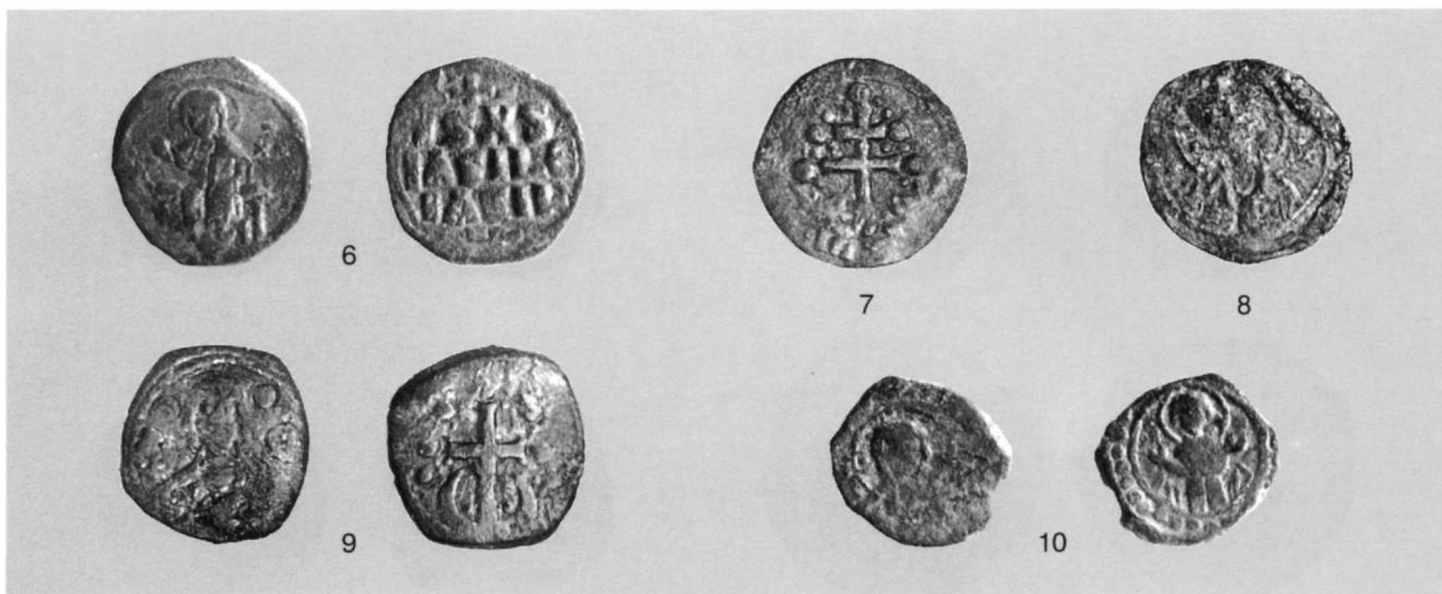
Εικ. 2: 6. Ανώνυμη φόλλις D (από το σύνολο Σ.ΙΙΙ). 7. Ανώνυμη φόλλις Η (από το σύνολο Β.Υ). 8. Ανώνυμη φόλλις Ι (από το σύνολο Β.ΥΙΙ). 9. Ανώνυμη φόλλις J (από το σύνολο Β.ΥΙΙΙ). 10. Ανώνυμη φόλλις Κ (από το σύνολο Σ.Υ).

13. Τεταρτηρό Αλεξίου Α΄ Κομνηνού, 1092-1118, Hendy 10 , 8.7 (N74).