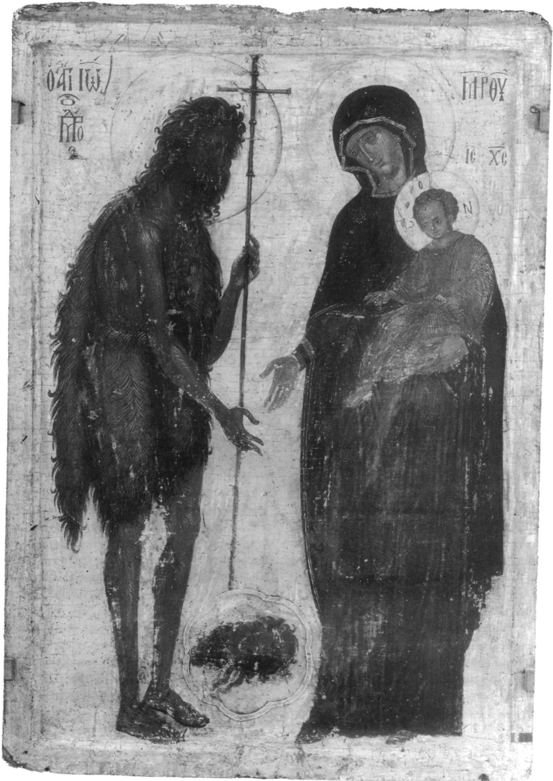
Εικ. 4. Άγιον Όρος, μονή Παντοκράτορος. Θεοτόκος Βρεφοκρατούσα και άγιος Ιωάννης ο Πρόδρομος στη δεύτερη όψη της Εικ. 3.