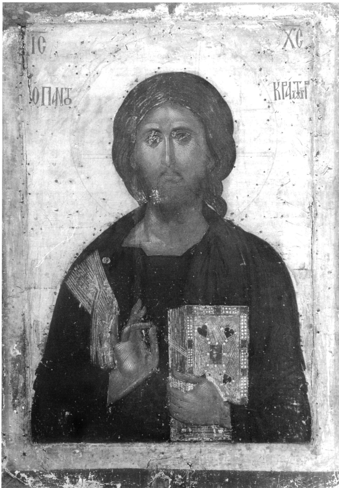
Εικ. 1. Άγιον Όρος, μονή Παντοκράτορος. Χριστός Παντοκράτορας.