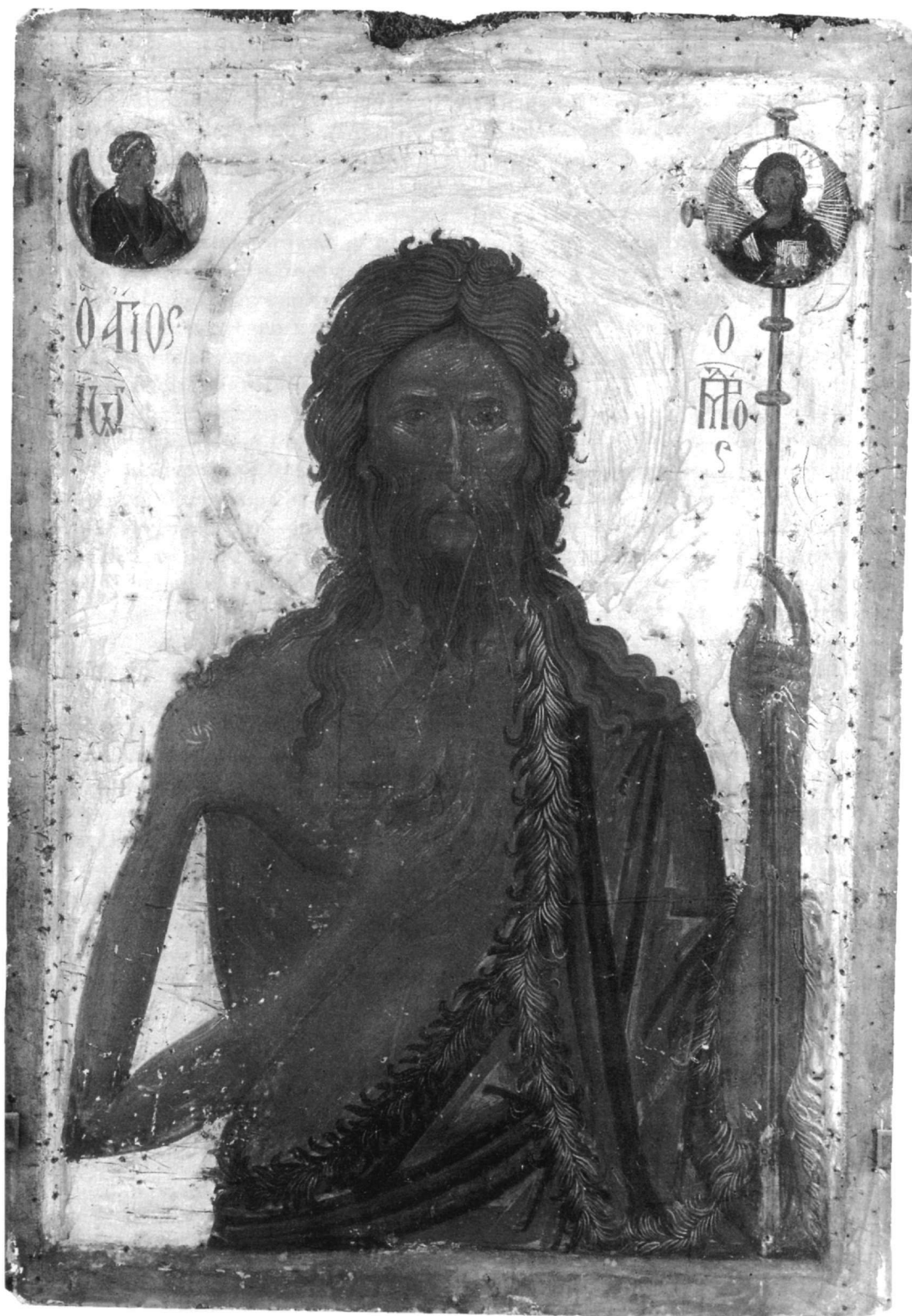
Εικ. 3. Άγιον Όρος, μονή Παντοκράτορος. Άγιος Ιωάννης ο Πρόδρομος.