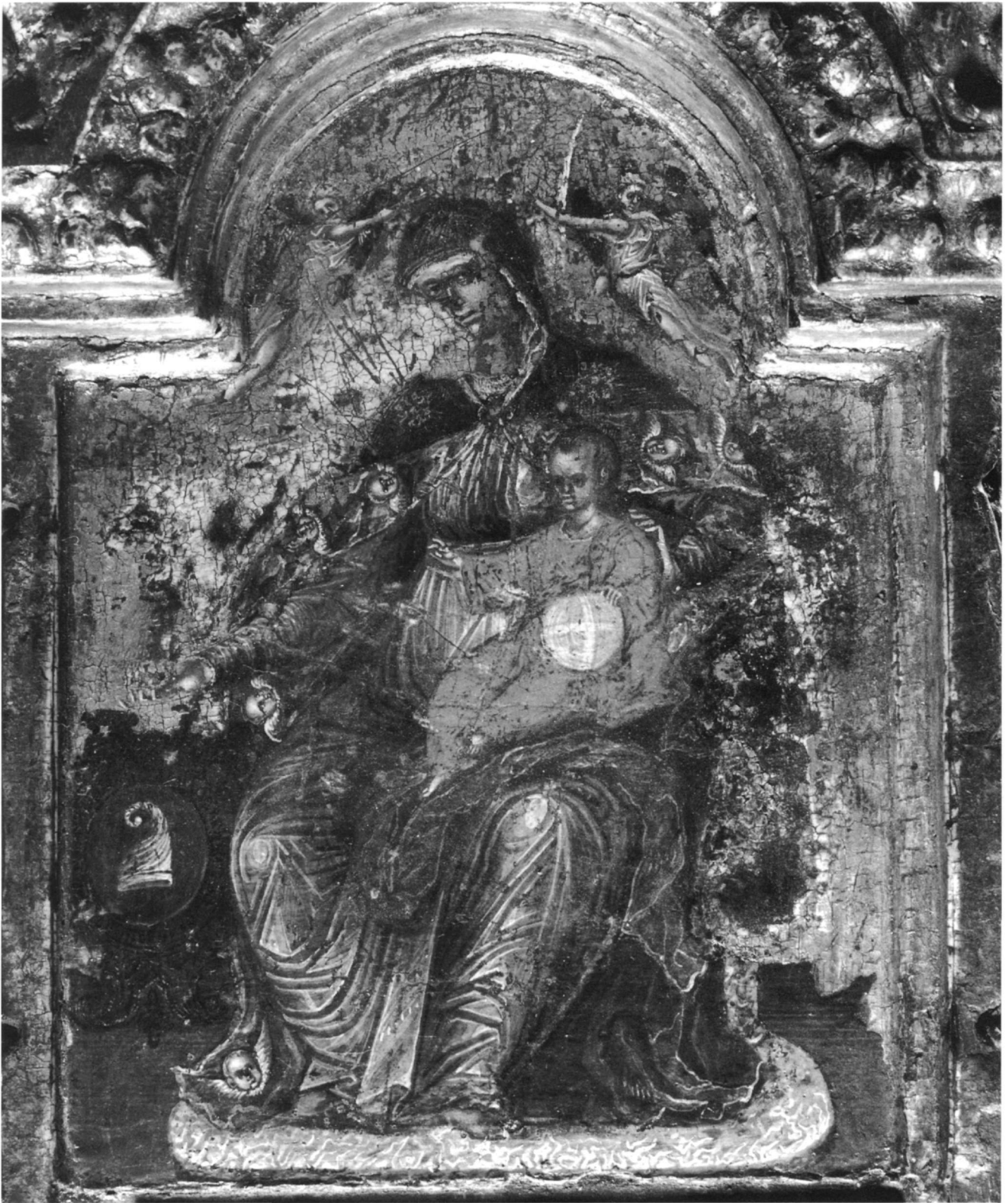
Είχ. 2. Ἡ κεντρική παράσταση τοῦ τριπτύχου. Λεπτομέρεια τῆς Είχ. 1.