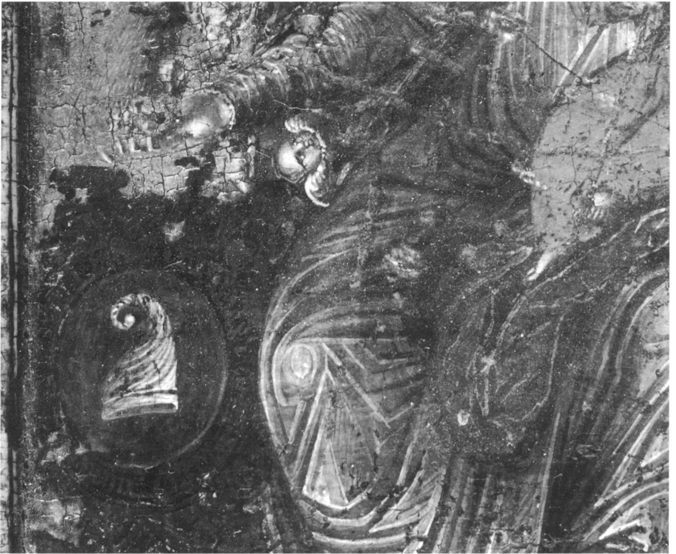
Εικ. 3. Τμήμα της μορφής της Θεοτόκου και τό οικόσημο. Λεπτομέρεια της Εικ. 1.

άνοιχτό λαδοπράσινο, αντίστοιχα, χιτώνια, ό όποϊός άφήνει άκάλυπτους τούς βραχιόνες και σχίζεται ψηλά στόν μηρό.