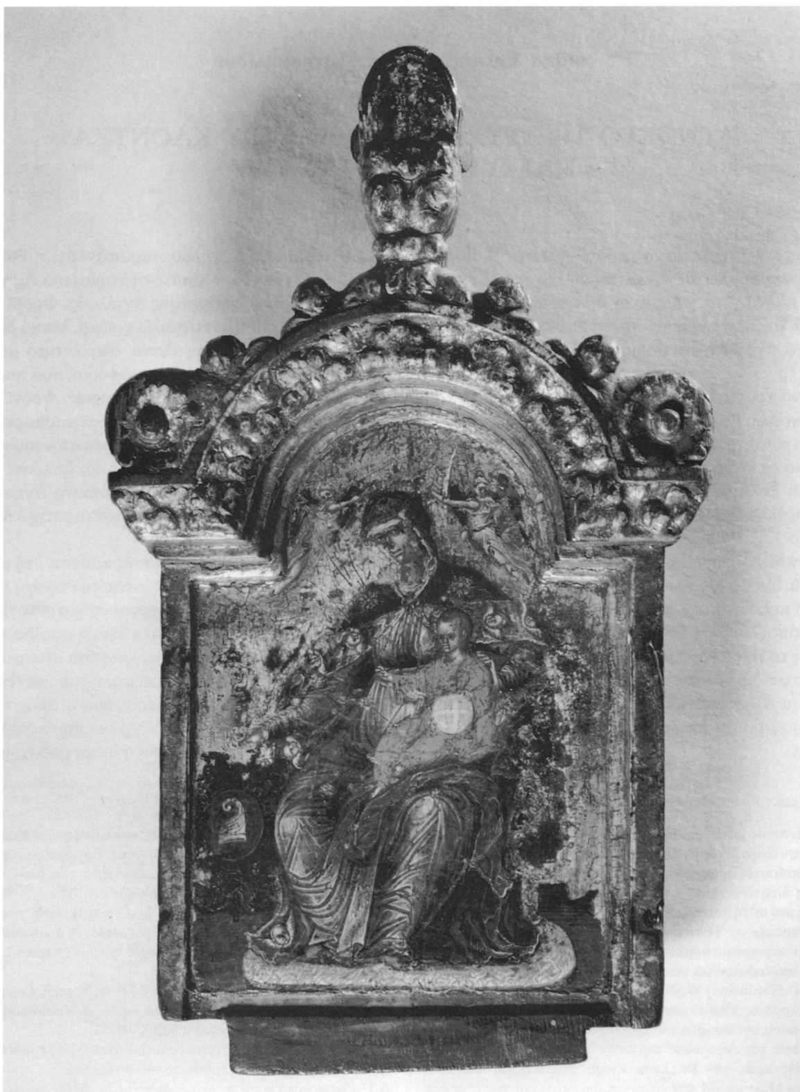
Εἰκ. 1. Γεωργίου Κλόντζα. Κεντρικό φύλλο τριπτύχου με ξυλόγλυπτη ἐπίστεψη: Παναγία ἔνθρονη βρεφοκρατούσα με το οἰκόσημο τῆς βενετικῆς οἰκογένειας Tiepolo. Frederikssund (Δανία), The J. F. Willumsens Museum.