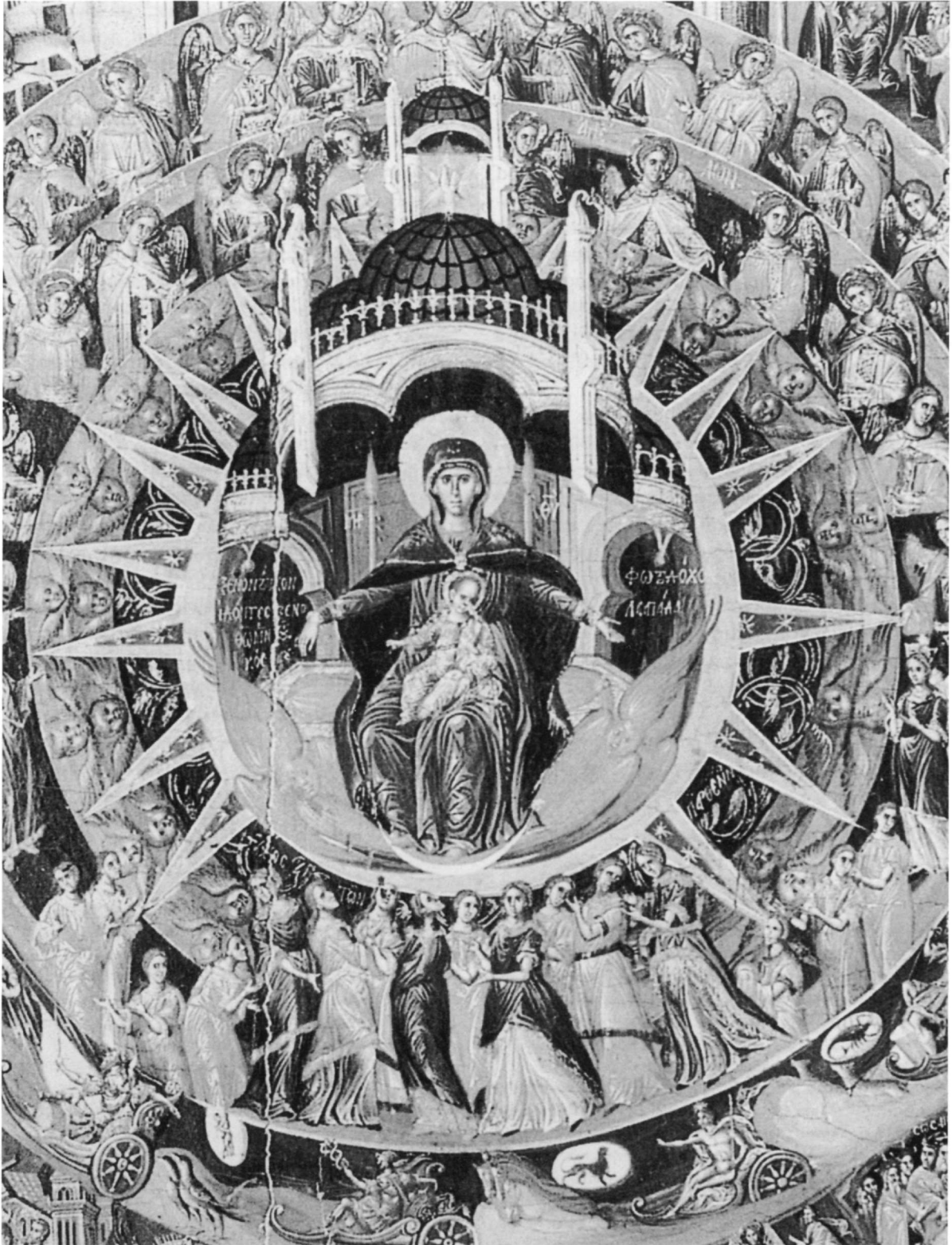
Είχ. 4. Γεωργίου Κλόντζα. Εικόνα με εικονογράφηση τοῦ ὕμνου «Ἐπί Σοί χαίρει, Κεχαριτωμένη...», σκηνές του Ἄκαθιστου Ὑμνου καί ἄλλα θέματα. Βενετία, Μουσεῖο Ἑλληνικοῦ Ἰνστιτούτου.