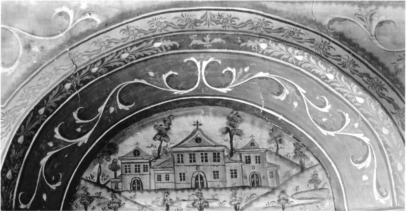
Εικ. 5. Καπέσοβο. Λαϊκή διακόσμηση εσωτερικού οικίας (λεπτομέρεια).

καθαρά θρησκευτικούς λόγους, αλλά περισσότερο αποτελεί δείγμα της πνευματικής συγκρότησης των φορέων αυτών, μεσ' απ' την οποία έβλεπαν την εθνική απελευθέρωση και την πορεία του ελληνισμού» 35 . Εξάλλου, ελάχιστη είναι η επαφή με την επίσημη Εκκλησία των Ιωαννίνων, αφού η χορηγία στέλνεται απευθείας στους επιτρόπους, οι οποίοι και τη διαχειρίζονται.