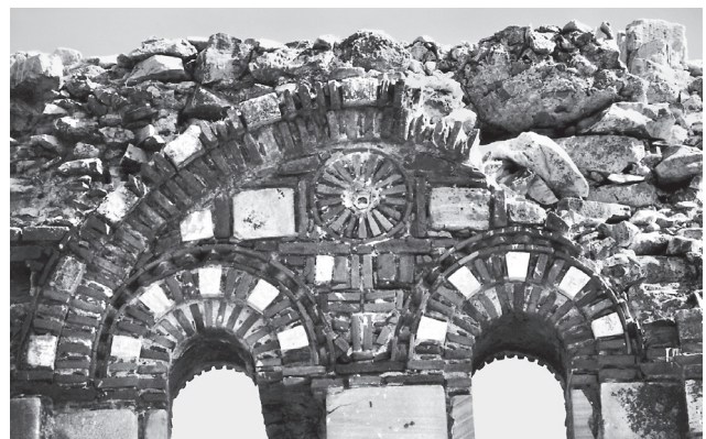
Εικ. 4. Λάτρος, ερειπωμένος ναός στη μικρότερη νησίδα των Ikiz Ada. Λεπτομέρεια παραθύρων βόρειας πλευράς (2000).