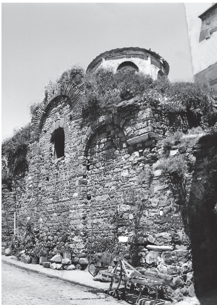
Εικ. 1. Τρίγλεια, Παντοβασίλισσα. Άποψη από νοτιοδυτικά (2001).

μορφολογικά και τυπολογικά ζητήματα του μνημείου χρήζουν περαιτέρω διευκρινίσεων.