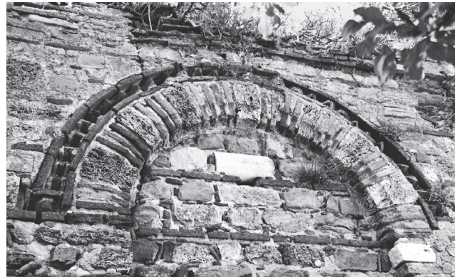
Εικ. 3. Τρίγλεια, Παντοβασίλισσα. Το τόξο του δυτικού αψιδώματος της βόρειας πλευράς (2001).