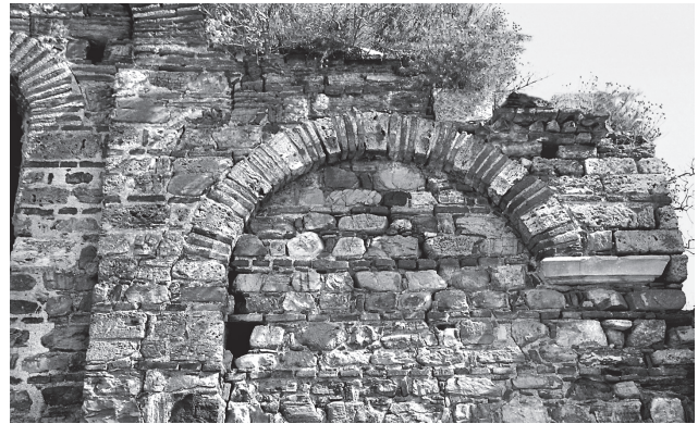
Εικ. 2. Τρίγλεια, Παντοβασίλισσα. Το τόξο του ανατολικού αψιδώματος της νότιας πλευράς (2001).

Η υιοθέτηση της μικτής τεχνικής σε εμφανή τόξα, κάνει δειλά την εμφάνισή της σε βυζαντινές εκκλησίες ήδη από τις αρχές του 11ου αιώνα 11 , αλλά θα υιοθετηθεί ευρέως από τα συνεργεία της αυτοκρατορίας της Νίκαιας κατά τη διάρκεια του 13ου αιώνα, με επιμέρους τεχνικές διαφοροποιήσεις 12 . Στα μνημεία του Λάτρου (Εικ. 4) που συνδέονται με την οικοδομική δραστηριότητα