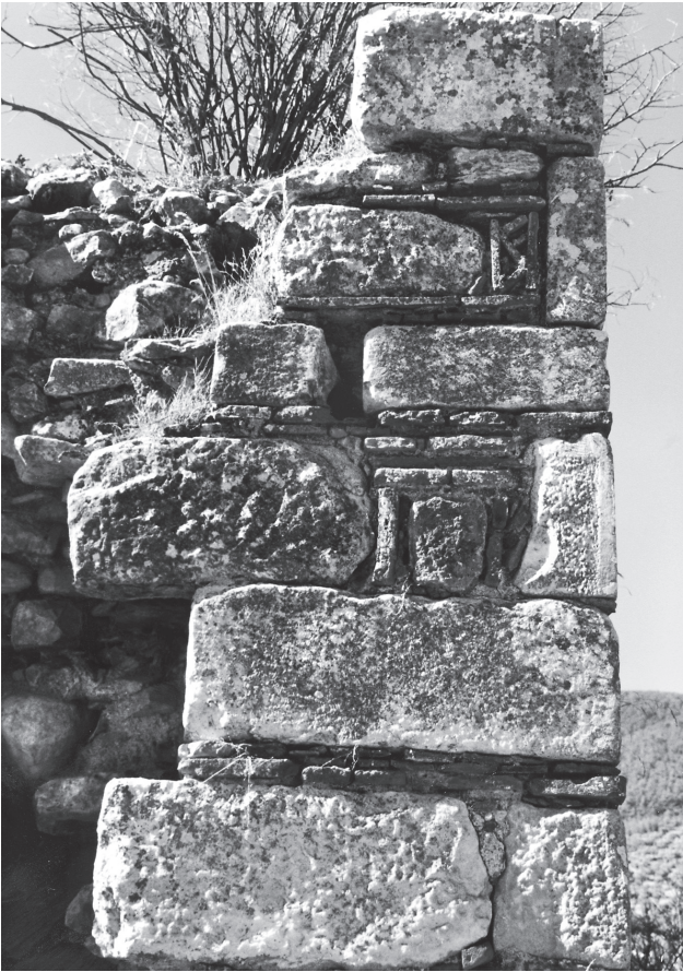
Εικ. 6. Λάτρος, ερειπωμένος ναός στο Kahve Asar Ada. Λεπτομέρεια τοιχοποιίας στη βορειοδυτική γωνία του ναού (2000).

διακρίνεται πλίνθινο κόσμημα που παραπέμπει σαφώς στα ψευδοκουφικά κεραμοπλαστικά θέματα ελλαδικών μνημείων 27 (Εικ. 6), με την μόνη διαφορά ότι το μικρασιατικό παράδειγμα έχει κατασκευαστεί με απλές και όχι με έγκοπτες πλίνθους. Με παρόμοιο τρόπο πρέπει να