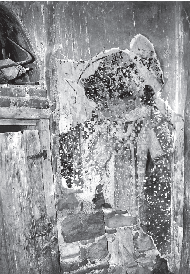
Εικ. 8. Τρίγλεια, Παντοβασιλίσα. Η τοιχισμένη δίοδος στον βόρειο τοίχο του κυρίως ιερού (2001).

Ε στις Σάρδεις 31 , ώθησε τον H. Buchwald στη διατύπωση της θεωρίας ότι ο συνδυασμός τρίκλιτης βασιλικής στο ισόγειο και σταυροειδούς εγγεγραμμένου με τρούλ-