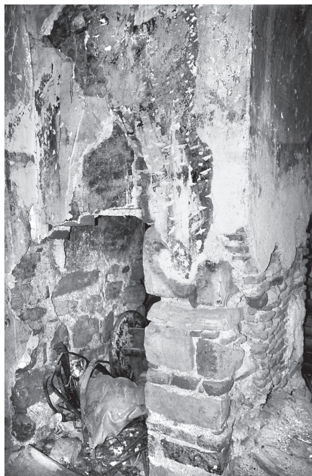
Εικ. 9. Τρίγλεια, Παντοβασίλισσα. Η τοιχισμένη διάδος στον νότιο τοίχο του κυρίως ιερού (2001).

37 Για περιπτώσεις παρεκκλησίων σε βυζαντινές εκκλησίες, βλ. G. Babić, Les chapelles annexes des églises byzantines , Paris 1969. S. Ćurčić, «Architectural Significance of Subsidiary Chapels in Middle Byzantine Churches», JSAH , XXXVI, 2 (May 1977), 94 110. Th. Chatzidakis Bacharas, Les peintures murales de Hosios Loukas, Les chapelles occidentales , Athènes 1982, 110 113. I. Sinkević, The Church of St. Panteleimon at Nerezi, Architecture, Programme, Patronage ,