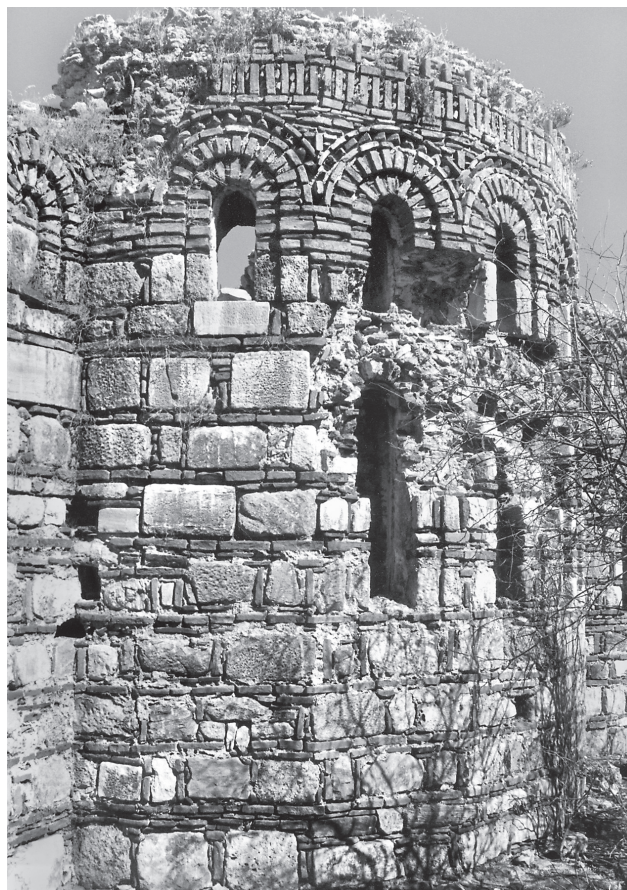
Εικ. 5. Λάτρος, ερειπωμένος ναός στο Kahve Asar Ada. Αποψη της αφίδας από νοτιοανατολικά (2000).

Η υπόθεση αυτή φαίνεται να ενισχύεται από τη μελέτη ορισμένων κατασκευαστικών λεπτομερειών κυρίως στα καθολικά των μονών του Λάτρου, που δέχτηκαν τις ευεργετικές χορηγίες των αυτοκρατόρων της Νίκαιας. Σε δύο τουλάχιστον μνημεία της λίμνης Ηράκλειας, στο ναό της νησίδας Kahve Asar Ada 25 (Εικ. 5) και στο καθολικό της μονής των Δύο Βουνών στη μικρότερη νησίδα των İkiz Ada 26 (Εικ. 4), οδοντωτές ταινίες οριοθετούν τόξα κατά τα ελλαδικά πρότυπα. Στο τελευταίο παράδειγμα, ένα μεγάλο τμήμα της τοιχοποιίας είναι δομημένο κατά το κυρίαρχο στην ελλαδική ναοδομία πλινθοπερίκλειστο σύστημα, με μονές πλίνθους στους κατακό-