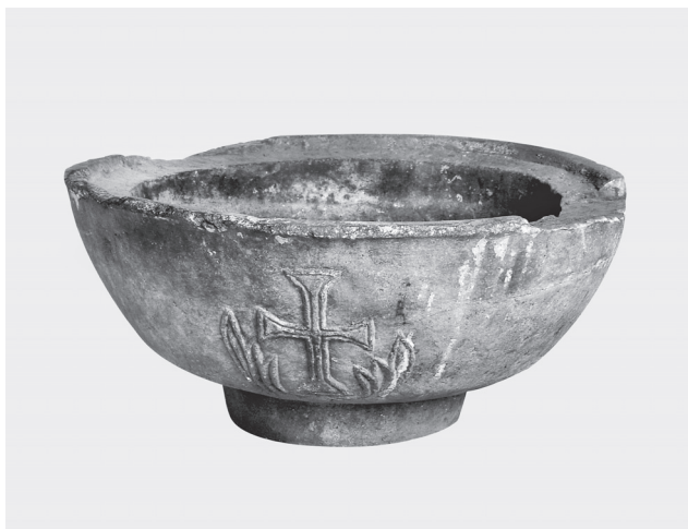
Εικ. 1. Η φιάλη της μονής Βατοπεδίου (Θησαυροί του Αγίου Όρους. Κατάλογος Έκθεσης, Θεσσαλονίκη 1997, 275).