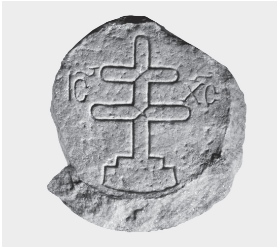
Εικ. 4. Σπάραγμα πυθμένα φιάλης από τον Πλαταμώνα (Μουσείο Βυζαντινού Πολιτισμού).