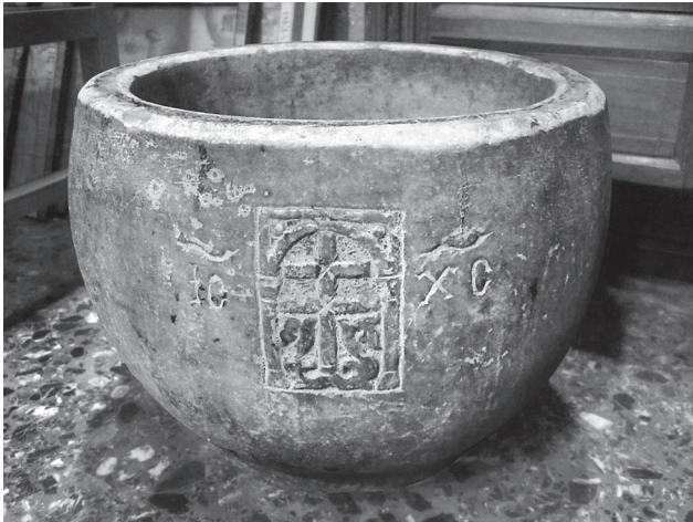
Εικ. 7. Η φιάλη της μονής Αγάθωνος Φθιώτιδας.

σταυρού εκφύονται παχείς βλαστοί που ελίσσονται και διακλαδίζονται με ανθεμοειδή φύλλα και οξύληκτα ημίφυλλα, καλύπτοντας όλη τη διαθέσιμη επιφάνεια. Στις δύο πλάγιες πλευρές της ίδιας φιάλης απλώνεται ψαθωτό ταινιωτό πλέγμα, ενώ το χείλος της περιτρέχει πλοχμός.