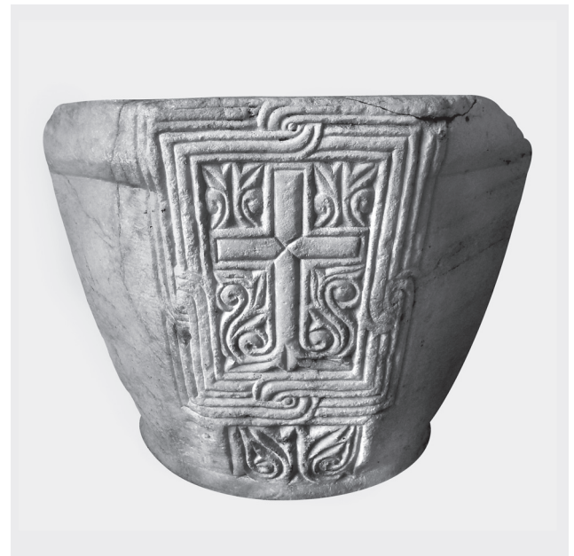
Εικ. 6. Η φιάλη της μονής Οσίου Μελετίου (Μ. Κωνσταντουδάκη-Κιτρομηλίδου).

Στη φιάλη της μονής Οσίου Μελετίου ο φυλλοφόρος σταυρός εγγράφεται σε πλατύ ορθογώνιο ταινιωτό