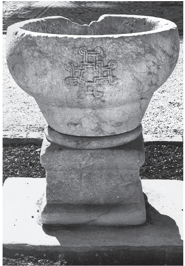
Εικ. 8. Η φιάλη από τον ναό των Αγίων Αποστόλων της αρχαίας Αγοράς των Αθηνών (Βυζαντινό και Χριστιανικό Μουσείο).

Μικρό σε αριθμό, διεσπαρμένο γεωγραφικά και κλιμακούμενο χρονολογικά από τα τέλη του 10ου μέχρι τον 14ο αι., το ξεταξζόμενο υλικό συγκροτεί όπως σημειώθηκε μια ιδιαίτερη ομάδα στη μεσοβυζαντινή και υστεροβυζαντινή γλυπτική. Η θέση του στο κεφάλαιο αυτό της τέχνης αποτιμάται μάλλον ως δευτερεύουσα, καθώς ο ανάγλυφος διάκοσμος είναι κατά κανόνα περιορισμένος σε έκταση και αναπαραγάγει επί το πλεί-