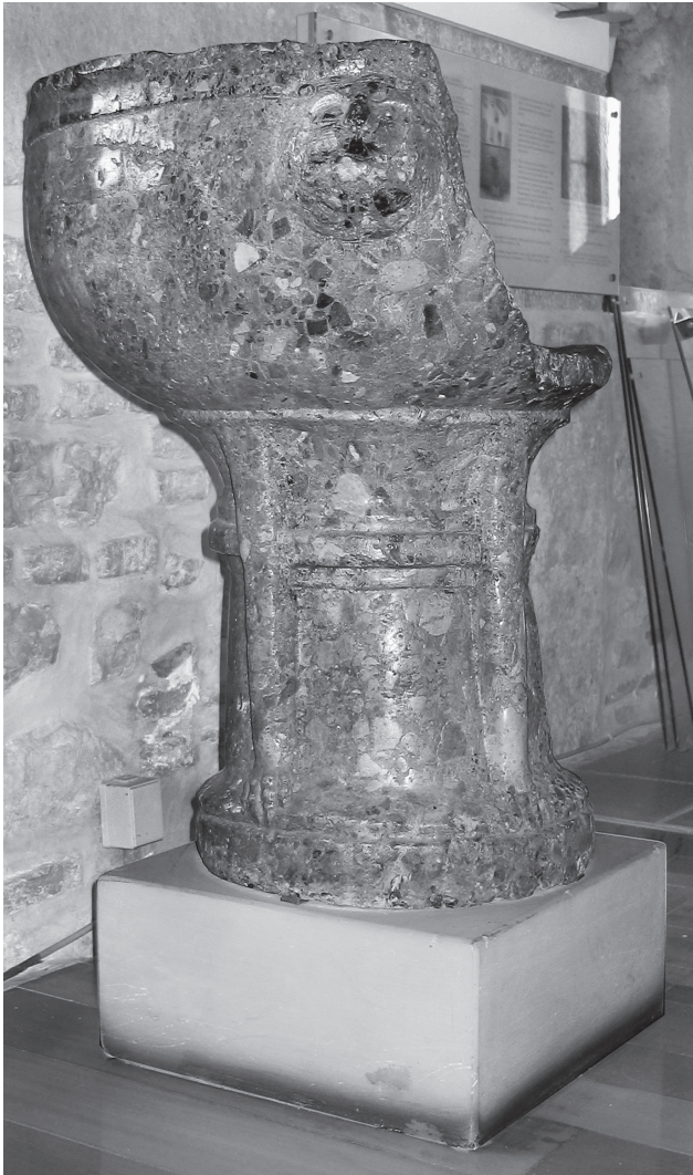
Εικ. 3. Η φιάλη της μονής του Οσίου Λουκά.

λους διαμορφώνεται με εσοχή, προκειμένου να υποδεχτεί κάλυμμα. Αυτό συμβαίνει τόσο σε φιάλες, όσο και σε κολυμβήθρες, όπως δείχνει η περίπτωση του Πλατα-