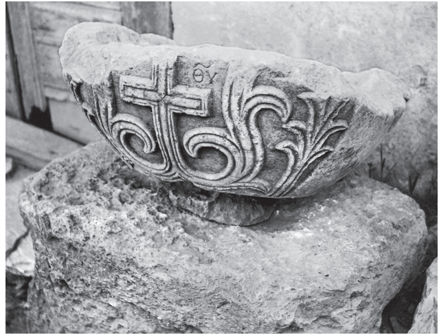
Εικ. 5. Η φιάλη από το παρεκκλήσιο του Αγίου Μηνά στη Λαμία (Βυζαντινό και Χριστιανικό Μουσείο, ΧΑΕ 5213).

Χριστού, η βάπτισμα του οποίου σημαίνει την αφετηρία τόσο του βαπτίσματος των χριστιανών όσο και του αγιασμού των υδάτων. Στις απλούστερες περιπτώσεις παρουσιάζεται μεμονωμένος, χωρίς συμπληρωματικά στοιχεία. Η φιάλη των Αγίων Αποστόλων στην Αθήνα φέρει μόνον έναν ισοσκελή ταινιωτό σταυρό με θηλειές στα άκρα, στο κέντρο του οποίου συμπλέκεται τετράγωνο. Στον Άγιο Νικόλαο Αχραγιά υπάρχει απλός ισοσκελής σταυρός με διχαλωτά άκρα. Τρεις ισοσκελείς σταυροί –ένας με τριγωνικά σκέλη ανάμεσα σε δύο άλλους με αποστρογγυλεμένες απολήξεις, ενταγμένους σε κυκλικά διάχωρα– κοσμούν τη φιάλη της μονής Παντοκράτορος. Τέσσερις λατινικούς σταυρούς με διαπλατυσμένα άκρα φέρει η κολυμβήθρα της μονής Βλατάδων.