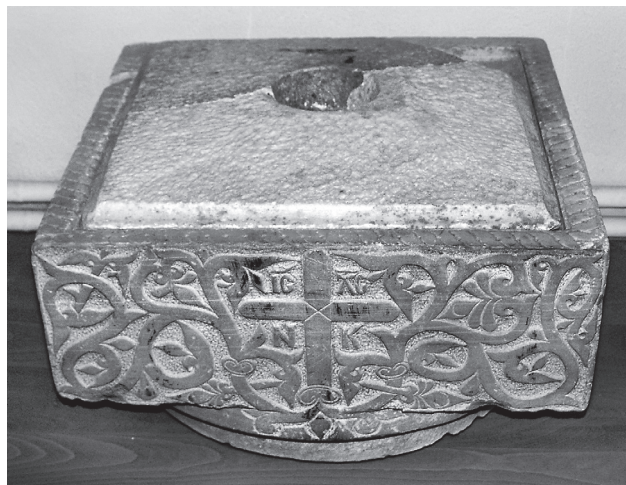
Εικ. 2. Η φιάλη του ναού του Αγίου Γεωργίου στη Βέροια (11η ΕΒΑ).

Θηβών 19 , στη μονή Δαφνίου, στον Ταξιάρχη Χαρούδας στη Μάνη (ακόσμητη) και στη Νέα Μονή Χίου 20 . Σε αυτές τις αδημοσίευτες ή ατελώς γνωστές περιπτώσεις προστίθενται τρεις επιπλέον φιάλες, από το Κάστρο του Πλαταμώνα, σήμερα στο Μουσείο Βυζαντινού Πολιτισμού στη Θεσσαλονίκη (10ος-11ος αι.), από το σκευοφυλάκιο της μεταβυζαντινής μονής Αγάθωνος – στην Υπάτη Φθιώτιδας (12ος αι.) και από τον ναό του Αγίου Νικολάου Αχραγιά στη Λακωνία (πιθανώς 14ος αι.) 21 – ίσως δε και το μεγάλο μαρμάρινο δοχείο (κολυμβήθρα;) που βρίσκεται στον αυλόγυρο του Μετοχίου του Παναγίου Τάφου στην Αθήνα (υστεροβυζαντινών χρόνων);).