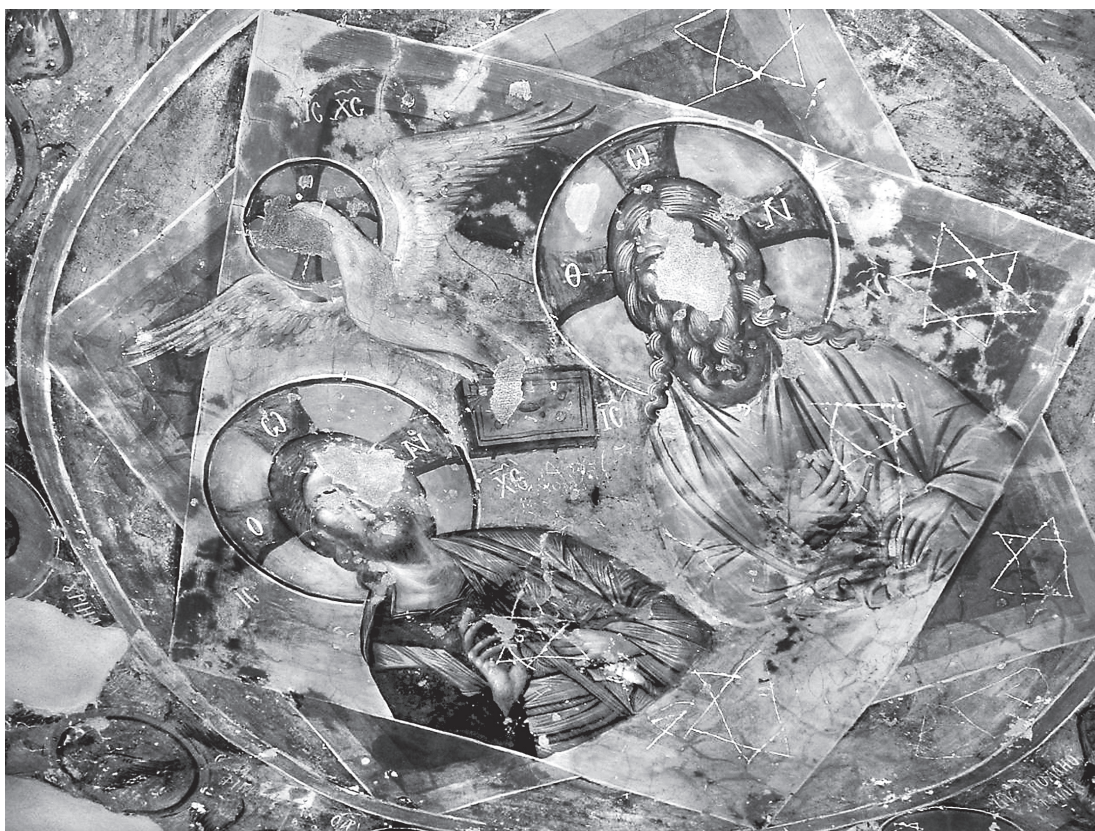
Εικ. 6. Κύπρος, Κούκλια Πάφου, «Παλαιά Έγκλειστρα»: Αγία Τριάδα.