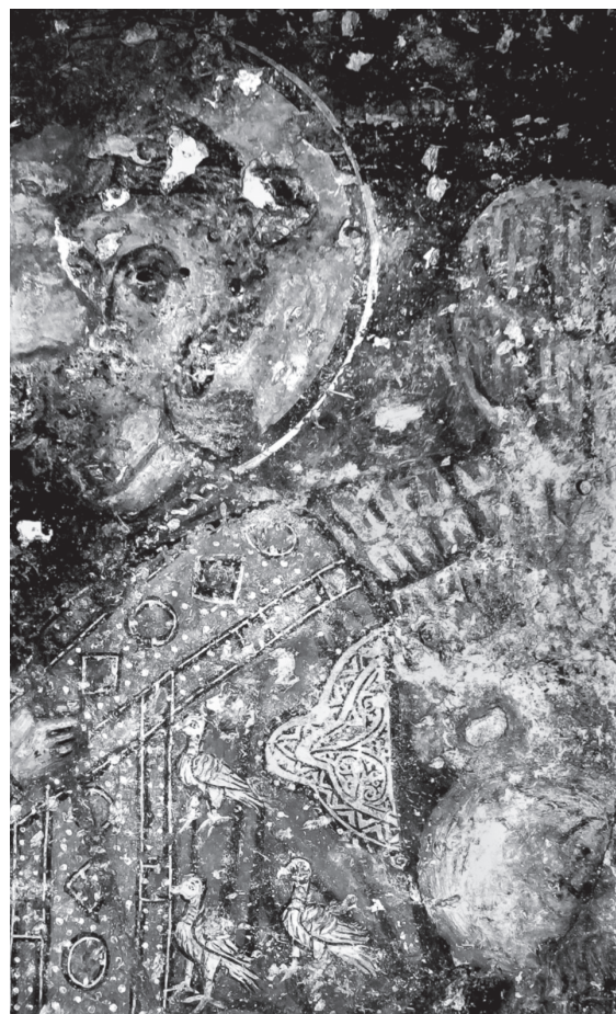
Εικ. 8β. Μέλαμπες, ο Αρχάγγελος Μιχαήλ (λεπτομέρεια).