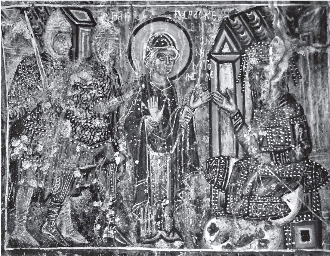
Εικ. 6. Αργουλές, βόρειος τοίχος. Η αγία Παρασκευή συνδιαλέγεται με τον βασιλέα.

τό άνοιγμα, στραμμένη προς τα δεξιά, με τα χέρια υψωμένα σε στάση προσευχής. Βρίσκεται στο εσωτερικό κτιρίου, η τοιχοποιία του οποίου αποδίδεται με κόκκινα τούβλα.