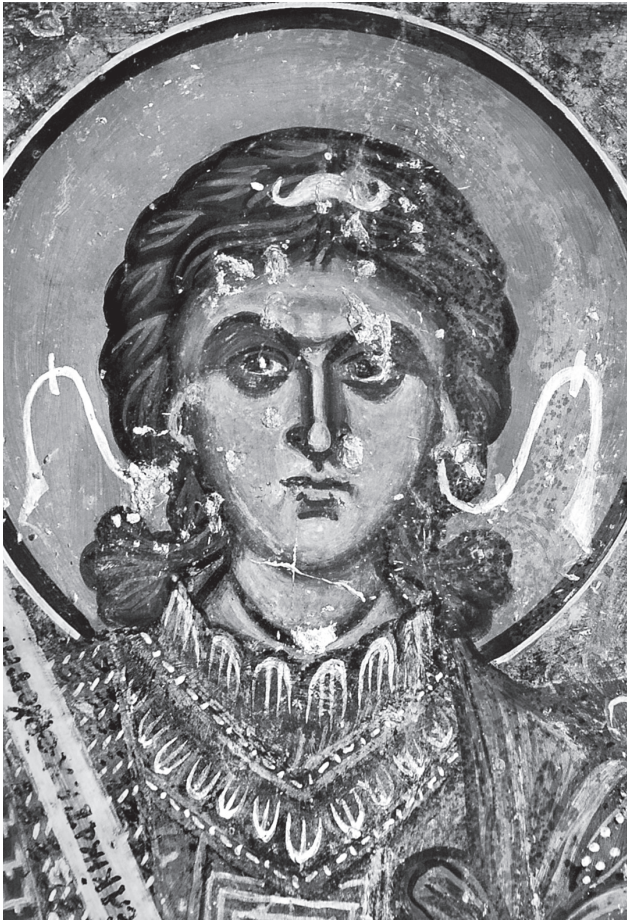
Εικ. 8α. Δρύμισκος, ο Αρχάγγελος Μιχαήλ (λεπτομέρεια).