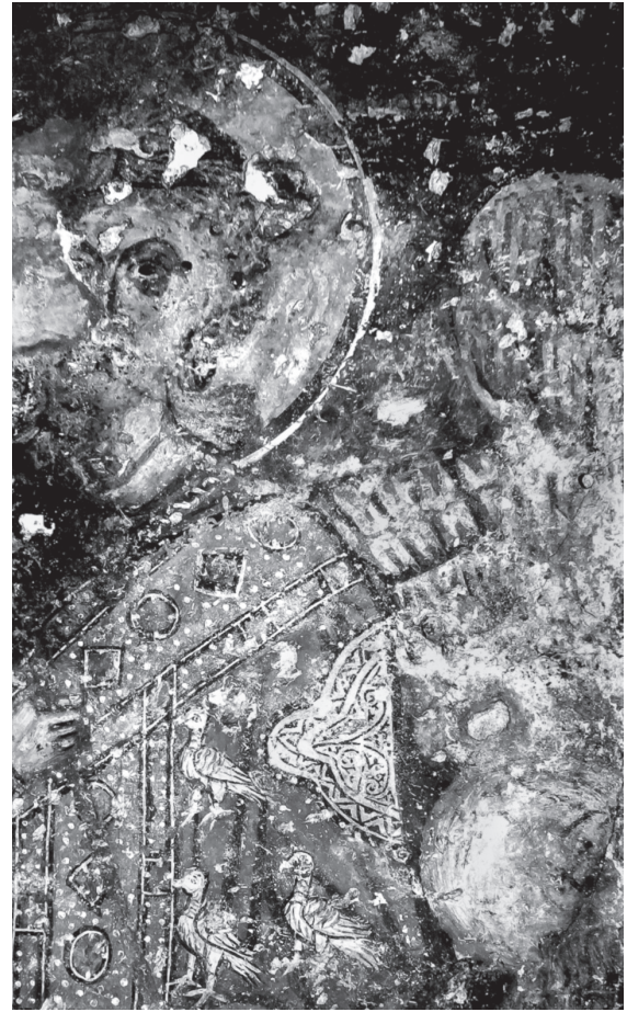
Εικ. 8β. Μέλαμπες, ο Αρχάγγελος Μιχαήλ (λεπτομέρεια).

τη δομή και τον τρόπο εργασίας των συνεργείων των ζωγράφων τοιχογραφιών στο νησί, στα τέλη του 13ου, μέχρι και τα μέσα τουλάχιστον του 14ου αι. Η πρώτη φορά που εντοπίζεται επιγραφικά ως ζωγράφος είναι το 1303, όταν μαζί με τον θείο του, Θεόδωρο Δανιήλ, υπογράφουν από κοινού, ως ισότιμοι δημιουργοί, την διακόσμηση του ναού του Σωτήρα Χριστού στα Μεσκλά 32 . Από τότε μέχρι και την τέταρτη περίπου δεκαετία του 14ου αι., οπότε και εντοπίζονται έργα του, σε μια αρκετά εκτεταμένη γεωγραφικά περιοχή, από τα δυτικά του νομού Χανίων, μέχρι τα ΝΔ του νομού Ρεθύ-