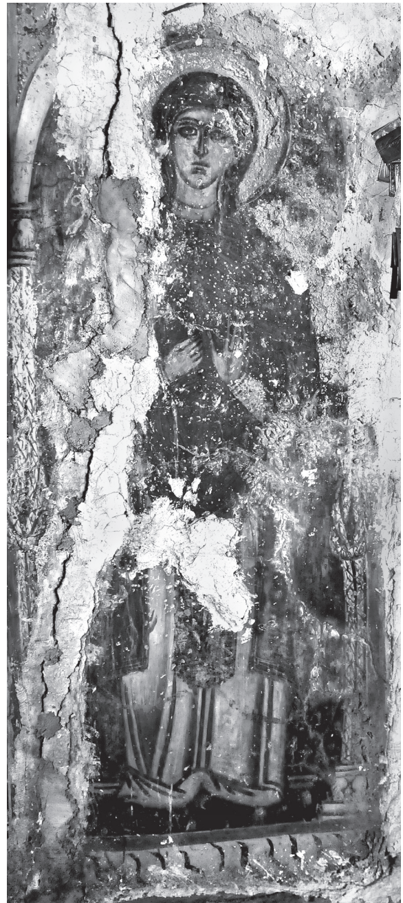
Εικ. 3. Αργουλές, βόρειος τοίχος. Η αγία Παρασκευή.

Ίχνη ενός κεφαλαίου ήτα: H , μαύρου χρώματος, στο