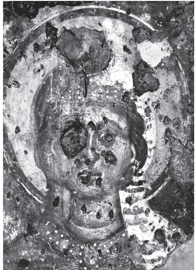
Εικ. 4β. Μέλαμπες, η αγία Κυριακή (λεπτομέρεια).

κέντρο περίπου του υφασπίδιου, μαρτυρούν την ύπαρξη μεγαλογράμματης επιγραφής, που έχει απολεπιστεί. Στο μέτωπο του σφενδονίου σώζονται υπολείμματα από διακοσμητική, γωνιώδη ταινία, αρκετά συνηθισμένη σε ναούς της Κρήτης.