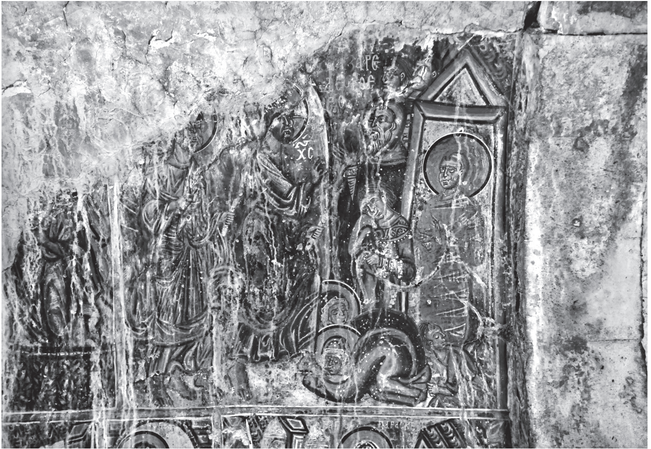
Εικ. 5. Αργουλές, βόρειος τοίχος. Η Έγερση του Λαζάρου.

γραφή ΛΑΖΑΡΕ/ΔΕΥΡΟ Ε/ΞΟ (Εικ. 5). Στο κέντρο περίπου της σκηνής ο Χριστός, ακολουθούμενος από τον Πέτρο, βαδίζει προς τον Λάζαρο, που στέκει σαβανωμένος ακόμα, μπροστά στο μνήμα. Δίπλα, ο όμιλος των Εβραίων και στα πόδια του οι γονυπετείς αδελφές του προσκυνούν τον Χριστό. Χαρακτηριστική φυσιογνωμία αποτελεί ο αγένειος νέος που τραβά τις κειρίες καλύπτοντας τη μύτη του, κατά τη συνήθη εικονογραφία. Στο διπλανό διάχωρο, εικονίζεται η Εισ Άδου Κάθοδος. Από τη σκηνή διασώζεται το κατώτερο τμήμα του ομίλου των μορφών που βγαίνουν από σαρκοφάγο, αριστερά του εξίτηλου Χριστού. Κάτω από τα πόδια του διακρίνονται ίχνη από τις σπασμένες πύλες του κάτω Κόσμου 16 .