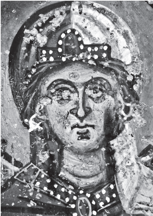
Εικ. 4α. Αργουλές, η αγία Κυριακή (λεπτομέρεια).