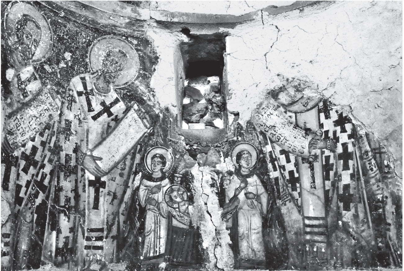
Εικ. 2. Αργουλές, κόγχη ιερού. Οι συλλειτουργούντες ιεράρχες και ο Αμνός.

Διακρίνεται μόνο το κάτω μέρος του σώματος του αρχαγγέλου, στη βόρεια πλευρά, ο οποίος στρέφεται με ανοιχτό διασκελισμό προς τα νότια, όπου και θα απεικονιζόταν η Παναγία.