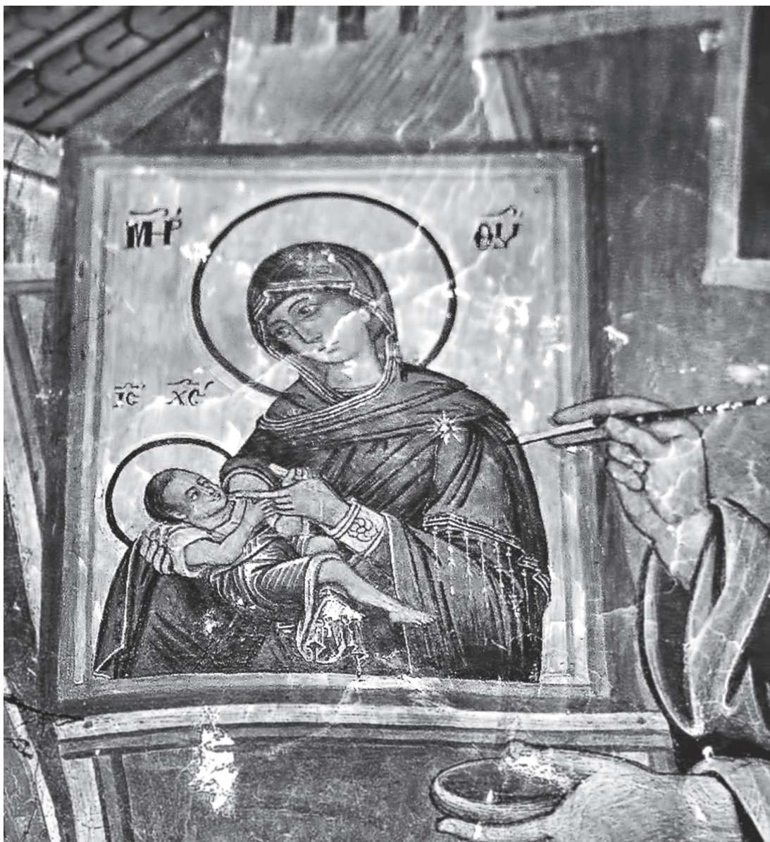
Εικ. 5. Καπέσοβο. Ναός Αγίου Νικολάου. Ο ευαγγελιστής Λουκάς ζωγραφίζει την εικόνα της Θεοτόκου, 1793 (λεπτομέρεια).

απηχεί τη θρυλική παράδοση που θέλει τη θαυματουργή εικόνα της Παναγίας της Μονής του Μεγάλου Σπηλαίου έργο του ευαγγελιστή Λουκά 37 ; Πολύτιμη, για