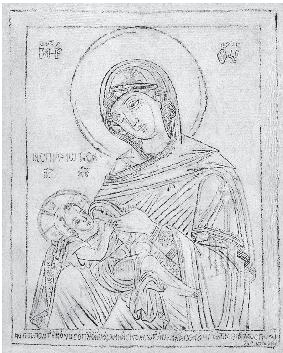
Εικ. 8. Μουσείο Μπενάκη, έκτυπο και διάτρητο ανθίβολο. Η Παναγία Γαλακτοτροφούσα η «Σπηλαιώτισσα», τέλη 18ου αι.

διερεύνηση του υδατοσήμου προέκυψε επίσης η κυκλοφορία του χαρτιού στα τέλη του 18ου αιώνα 53 ενθαρρύνοντας τη χρονολόγηση του ανθιβόλου στην ίδια περίοδο. Τα χρονολογικά δεδομένα και η εικονογραφική συνάφεια του ανθιβόλου του Μουσείου Μπενάκη, της εικόνας της Συλλογής Βελιμέζη και του σχεδίου της Συλλογής Γιαννούλη με τις εικόνες του Μακρίνου και των