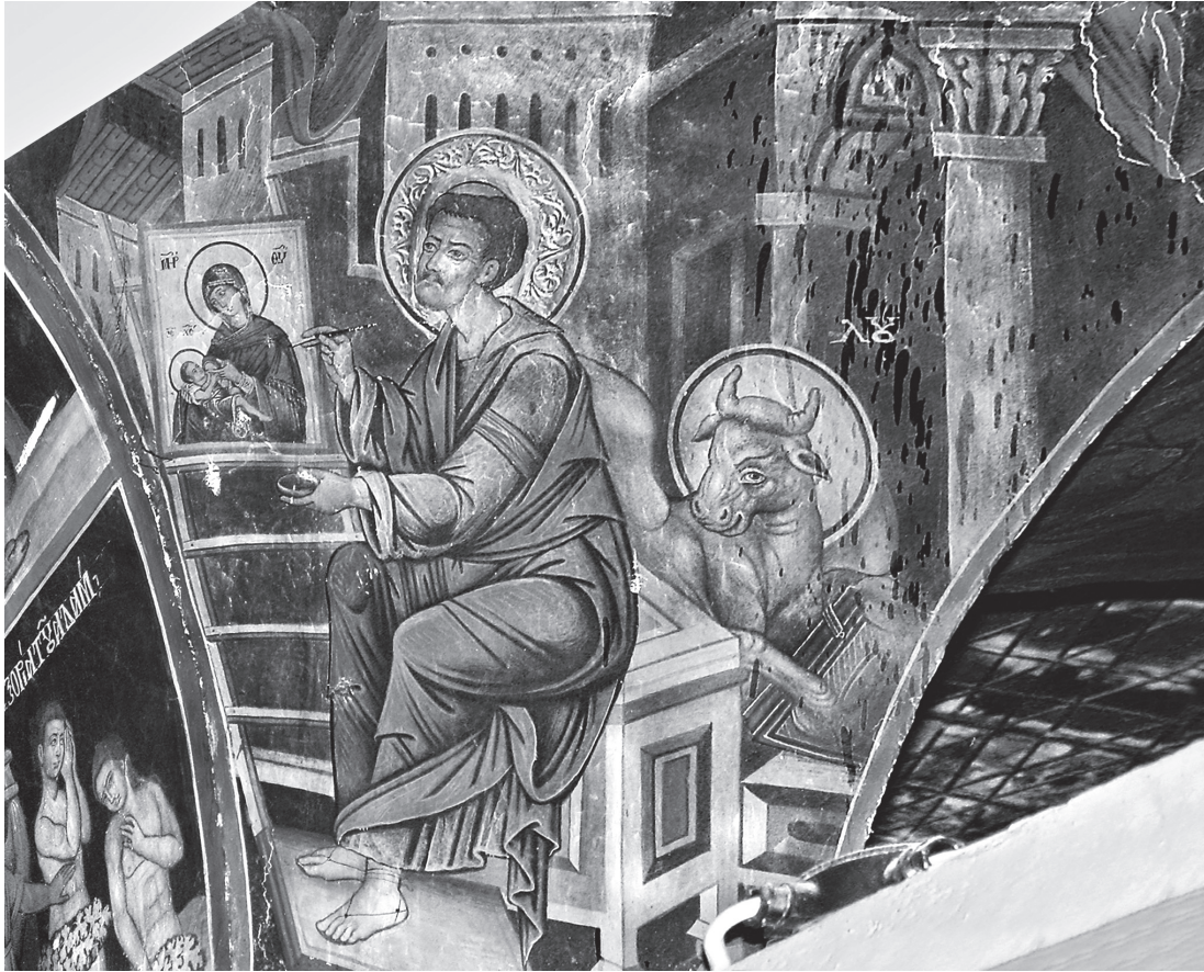
Εικ. 4. Καπέσοβο. Ναός Αγίου Νικολάου. Ο ευαγγελιστής Λουκάς ζωγραφίζει την εικόνα της Θεοτόκου, 1793.

της βορειοδυτικής Ελλάδας 35 γνωρίζουμε ότι στην παράσταση αυτή ο Λουκάς ζωγραφίζει συνήθως την εικόνα της Οδηγήτριας, την οποία οι ζωγράφοι μας αντικαθιστούν εδώ με αυτήν της Γαλακτοτροφούσας 36 . Πρόκειται για τυχαία επιλογή ή μήπως η συγκεκριμένη απεικόνιση συνδέεται με κάποια από τις θαυματοργές εικόνες της Θεοτόκου που αποδίδονται στον Λουκά και την οποία φαίνεται να είχαν υπόψη τους οι Καπεσοβίτες; Εάν ισχύει το δεύτερο, τότε εύκολα ερμηνεύεται η