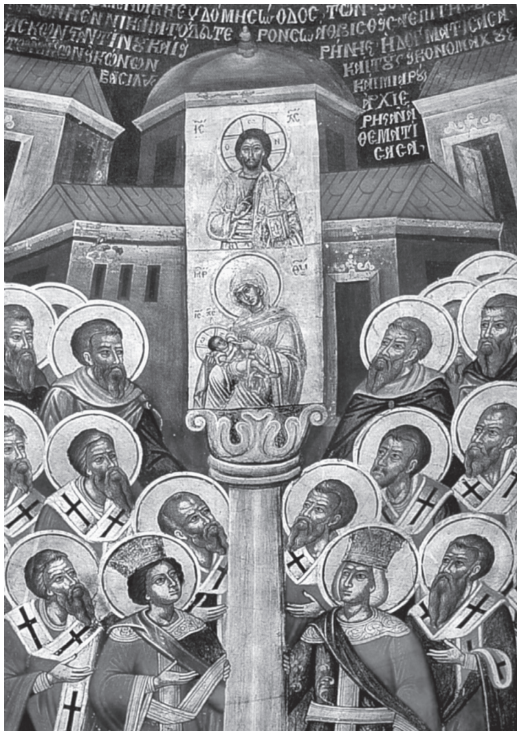
Εικ. 3. Τσεπέλοβο. Ναός Αγίου Νικολάου. Ζ' Οικουμενική Σύνοδος-Αναστήλωση των εικόνων, 1783 (λεπτομέρεια).

τριας, εικόνα-παλλάδιο της Μονής των Οδηγών στην Κωνσταντινούπολη, έργο – σύμφωνα με την παράδοση – του ευαγγελιστή Λουκά;