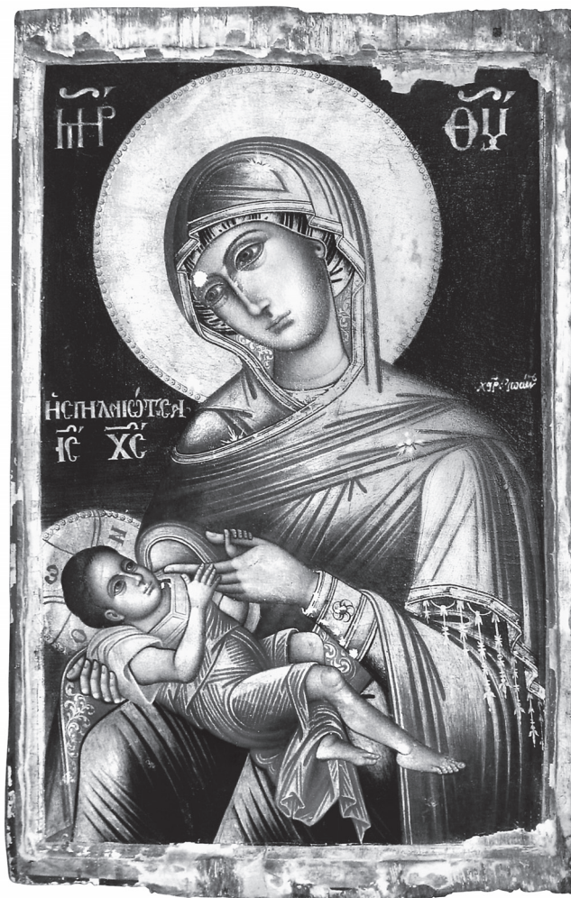
Εικ. 1. Μακρίνο. Ναός Αγίου Νικολάου. Παναγία Γαλακτοτροφούσα «η Σπηλαιώτισσα», 1782.

Ο εικονογραφικός τύπος της Γαλακτοτροφούσας Παναγίας, δημιούργημα της προεικονομαχικής περιόδου, απεικονίζεται σποραδικά στη βυζαντινή ζωγραφική, ενώ από τα τέλη του 13ου αιώνα διαδίδεται ευρύτατα σε βυζαντινίζουσες εικόνες δυτικών εργαστηρίων 14 . Εικονογραφικά στοιχεία της παράστασης που εξετάζουμε, όπως το ανακλινόμενο στην αγκαλιά της Παναγίας βρέφος με σταυρωμένα τα γυμνά του πόδια, εμφανίζονται ήδη στην αποτοιχισμένη τοιχογραφία της Γαλακτοτροφούσας από το μοναστήρι του Αγίου Ιερεμίου στη Saqqara (6ος αι.) 15 και επανέρχονται σε βυζαντινές απεικονίσεις του θέματος, όπως στις δύο εικόνες της Μονής Σινά (13ος αι.) 16 . Τυπολογικά οι δύο αυτές λεπτομέρειες παραπέμπουν σε εικόνες της Γλυκοφιλούσας και θεωρούνται ότι υπαινίσσονται το μελλούμενο Πάθος του Χριστού 17 . Στην Πατερική γραμματεία εξάλλου, η σκηνή του γαλακτισμού, κατεξοχήν δηλωτική της μητρικής ιδιότητας της Παρθένου αλλά και της ανθρωπίνης υπόστασης του Υιού, από νωρίς συνδέθηκε τόσο με την Ενσάρκωση του Θεού Λόγου όσο και με το επερχόμενο Πάθος 18 . Η Παναγία Γαλακτοτροφούσα