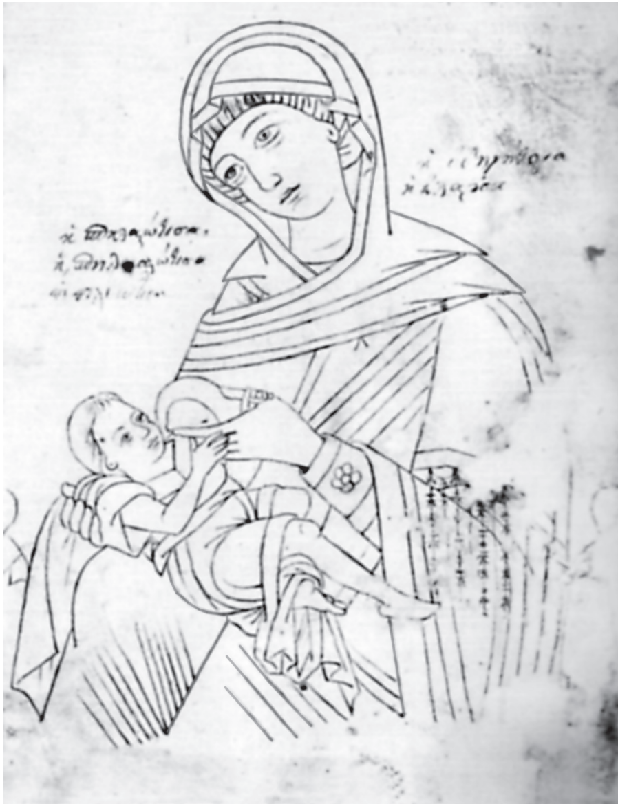
Εικ. 7. Συλλογή Γιαννούλη, σχέδιο με ελεύθερο χέρι. Η Παναγία Γαλακτοτρόφουσα η «Σπηλαιώτισσα», τέλη 18ου αι.

και το σχέδιο της Παναγίας «Σπηλαιώτισσας», λόγω των εικονογραφικών και υφολογικών αναλογιών που παρουσιάζει με συγγενείς παραστάσεις των Καπεσοβιτών, αλλά και της χρονολόγησής του με σχετική ακρίβεια στα τέλη του 18ου αιώνα, όπως επιβεβαιώνει και η διερεύνηση του υδατοσήμου που τοποθετεί την κυκλοφορία του χαρτιού την ίδια περίοδο 52 .