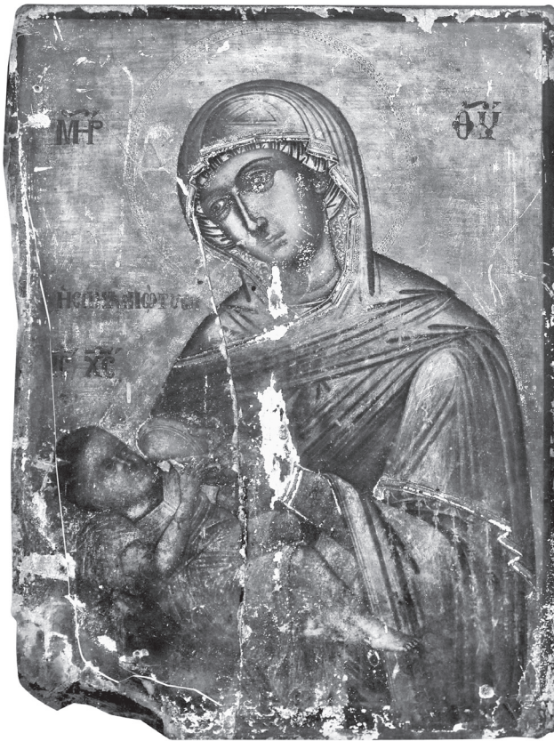
Εικ. 2. Νεγάδες. Ναός Αγίου Γεωργίου. Παναγία Γαλακτοτροφούσα «η Σπηλαιώτισσα», 1783.

που νοηματικά συμφύρεται με αυτήν του Πάθους αποτυπώθηκε σε ευάριθμα πρώια έργα της κρητικής ζωγραφικής, κυρίως με τρόπο υπαινικτικό, όπως στην εξαιρετική εικόνα της Συλλογής Ρ. Ανδρεάδη (τελευταίο τέταρτο 15ου αι.) 19 , και σπανιότερα με ενάρχεια εικαστική, όπως στην όμοιά της στο Μουσείο Μπενάκη (15ος αι.), όπου στη σκηνή παρίσταται άγγελος με τα σύμβολα του Πάθους 20 , χωρίς όμως ο μεικτός αυτός τύπος να γνωρίσει ιδιαίτερη επιτυχία 21 . Αντιθέτως, στα χρόνια που ακολου-