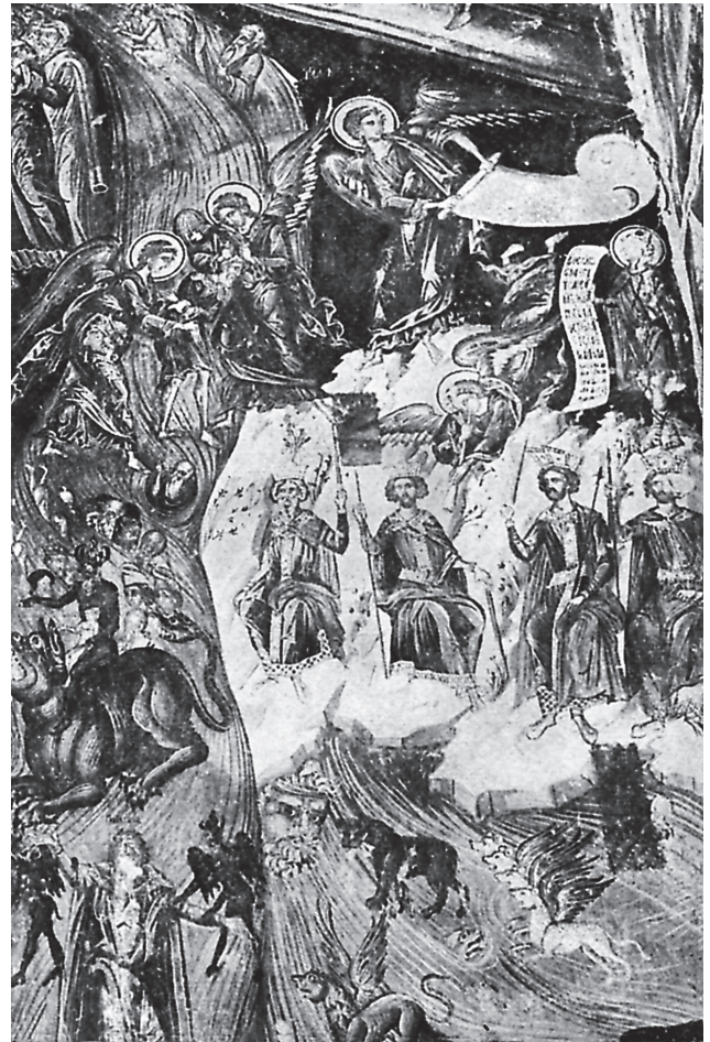
Εικ. 2. Το Όραμα του προφήτη Δανιήλ (λεπτομέρεια από την παράσταση της Δευτέρας Παρουσίας). Τοιχογραφία, καθολικό μονής Ντίλιου, Νησί Ιωαννίνων. 1543 (Θ. Λίβα-Ξανθάκη, Οι τοιχογραφίες της Μονής Ντίλιου , εικ. 81).

Πέρα, όμως, από τις περιπτώσεις ενσωμάτωσης στις παραστάσεις της Δευτέρας Παρουσίας, το σχετικό με τα τέσσερα θηρία επεισόδιο του οράματος ιστορήθηκε και αυτόνομο σε μεταβυζαντινά μνημεία, ενταγμένο σε ανεπτυγμένους κύκλους με θέμα τους παλαιοδιαθηκικούς προφήτες. Μια τέτοια παράσταση εικονίζεται στην ανατολική πλευρά του νότιου εξωνάρθηκα της μονής Φιλανθρωπηρών (1560, Εικ. 6) 27 , όπου έχουν απεικονιστεί και άλλες σκηνές από το Βιβλίο του προφήτη 28 . Η τοιχογραφία είναι σύγχρονη με εκείνη της Δευτέρας Παρουσίας, στον βόρειο τοίχο του ίδιου χώρου, στην οποία το όραμα αποτελεί, όπως προαναφέρθηκε, ένα από τα επεισόδιά της (Εικ. 1). Η παράσταση του ανατολικού τοίχου όμως αποκλίνει εικονογραφικά, καθώς η «θάλασσα» και τα θηρία έχουν παραλειφθεί και εικονίζονται μόνο οι τέσσερις βασιλείς, καθήμενοι ανά δύο σε έδρανα, το ένα πίσω από το άλλο. Επιπλέον, ο προφήτης δεν εικονίζεται κοιμώμενος, αλλά προβάλλει από την πλαγιά όρους, κρατώντας αναπεπταμένο ειλητό. Προφανώς η επιθυμία του καλλιτέχνη να αποφύγει την