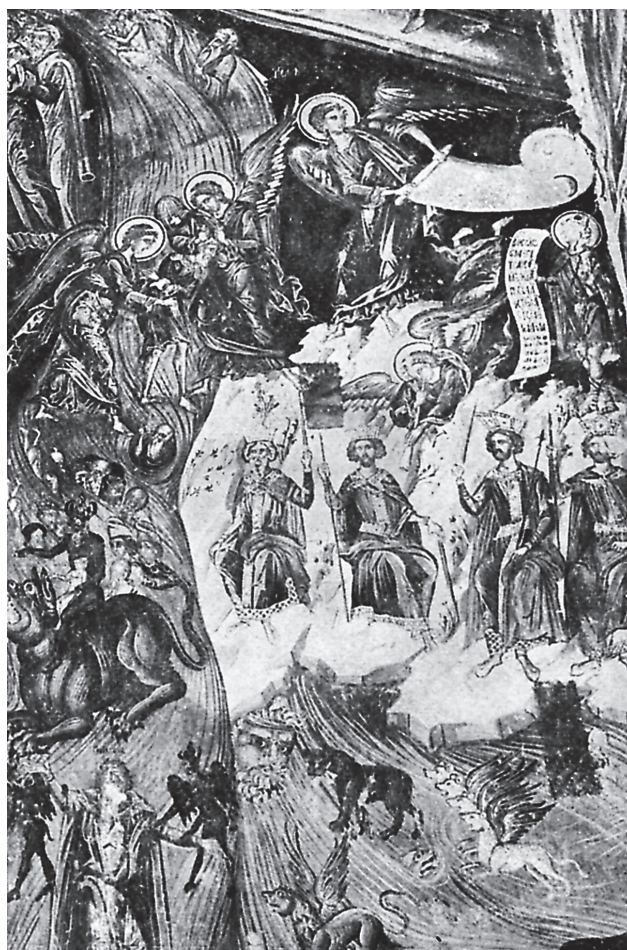
Εικ. 2. Το Όραμα του προφήτη Δανιήλ (λεπτομέρεια από την παράσταση της Δευτέρας Παρουσίας). Τοιχογραφία, καθολικό μονής Ντίλιου, Νησί Ιωαννίνων. 1543 (Θ. Λίβα-Ξανθάκη, Οι τοιχογραφίες της Μονής Ντίλιου , εικ. 81).

Πέρα, όμως, από τις περιπτώσεις ενσωμάτωσης στις παραστάσεις της Δευτέρας Παρουσίας, το σχετικό με τα τέσσερα θηρία επεισόδιο του οράματος ιστορήθηκε και αυτόνομο σε μεταβυζαντινά μνημεία, ενταγμένο σε ανεπτυγμένους κύκλους με θέμα τους παλαιοδιαθητικούς προφήτες. Μια τέτοια παράσταση εικονίζεται στην ανατολική πλευρά του νότιου εξωνάρθηκα της μονής Φιλανθρωπηρών (1560, Εικ. 6) 27 , όπου έχουν απεικονιστεί και άλλες σκηνές από το Βιβλίο του προφήτη 28 . Η τοιχογραφία είναι σύγχρονη με εκείνη της Δευτέρας Παρουσίας, στον βόρειο τοίχο του ίδιου χώρου, στην οποία το όραμα αποτελεί, όπως προαναφέρθηκε, ένα από τα επεισόδιά της (Εικ. 1). Η παράσταση του ανατολικού τοίχου όμως αποκλίνει εικονογραφικά, καθώς η «θάλασσα» και τα θηρία έχουν παραλειφθεί και εικονίζονται μόνο οι τέσσερις βασιλείς, καθήμενοι ανά δύο σε έδρανα, το ένα πίσω από το άλλο. Επιπλέον, ο προφήτης δεν εικονίζεται κοιμώμενος, αλλά προβάλλει από την πλαγιά όρους, κρατώντας αναπεπταμένο ειλητό. Προφανώς η επιθυμία του καλλιτέχνη να αποφύγει την