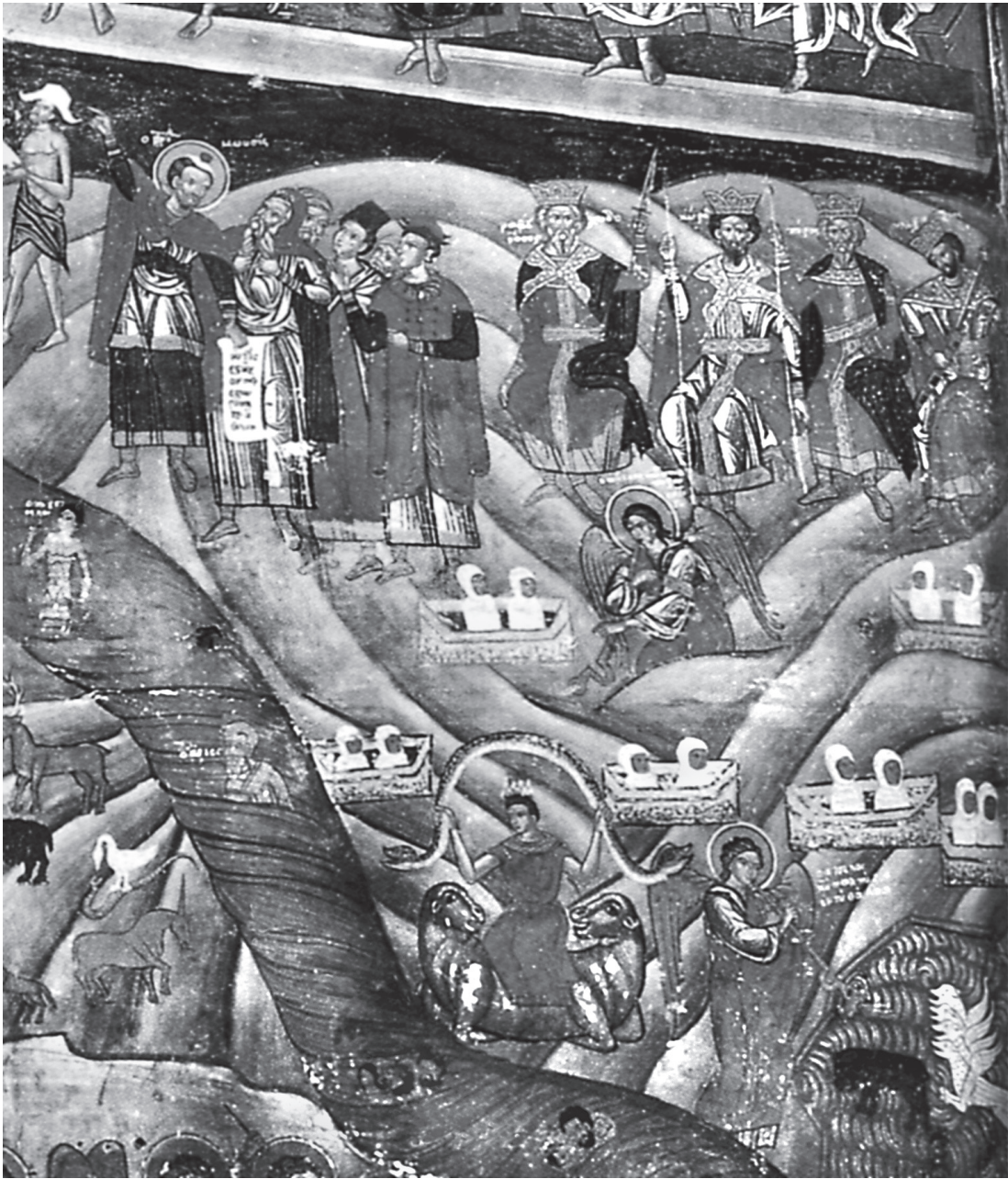
Εικ. 5. Το Όραμα του προφήτη Δανιήλ (λεπτομέρεια από την παράσταση της Δευτέρας Παρουσίας). Τοιχογραφία, ναός Αγίου Νικολάου της αρχόντισσας Θεολογίνας, Καστοριά. 1663 (Μ. Παϊσίδου, Οι τοιχογραφίες του 17ου αιώνα στους ναούς της Καστοριάς, πίν. 8).

Όμως, ο Κύριος δεν εικονίζεται στον τύπο του Παλαιού των Ημερών. Αυτή η απόκλιση ίσως οφείλεται στην επιθυμία του ζωγράφου να συνδέσει την παράσταση με μια άλλη, στο επάνω μέρος του δυτικού τοίχου του ναού, στην οποία ο Χριστός, εικονιζόμενος με τον ίδιο