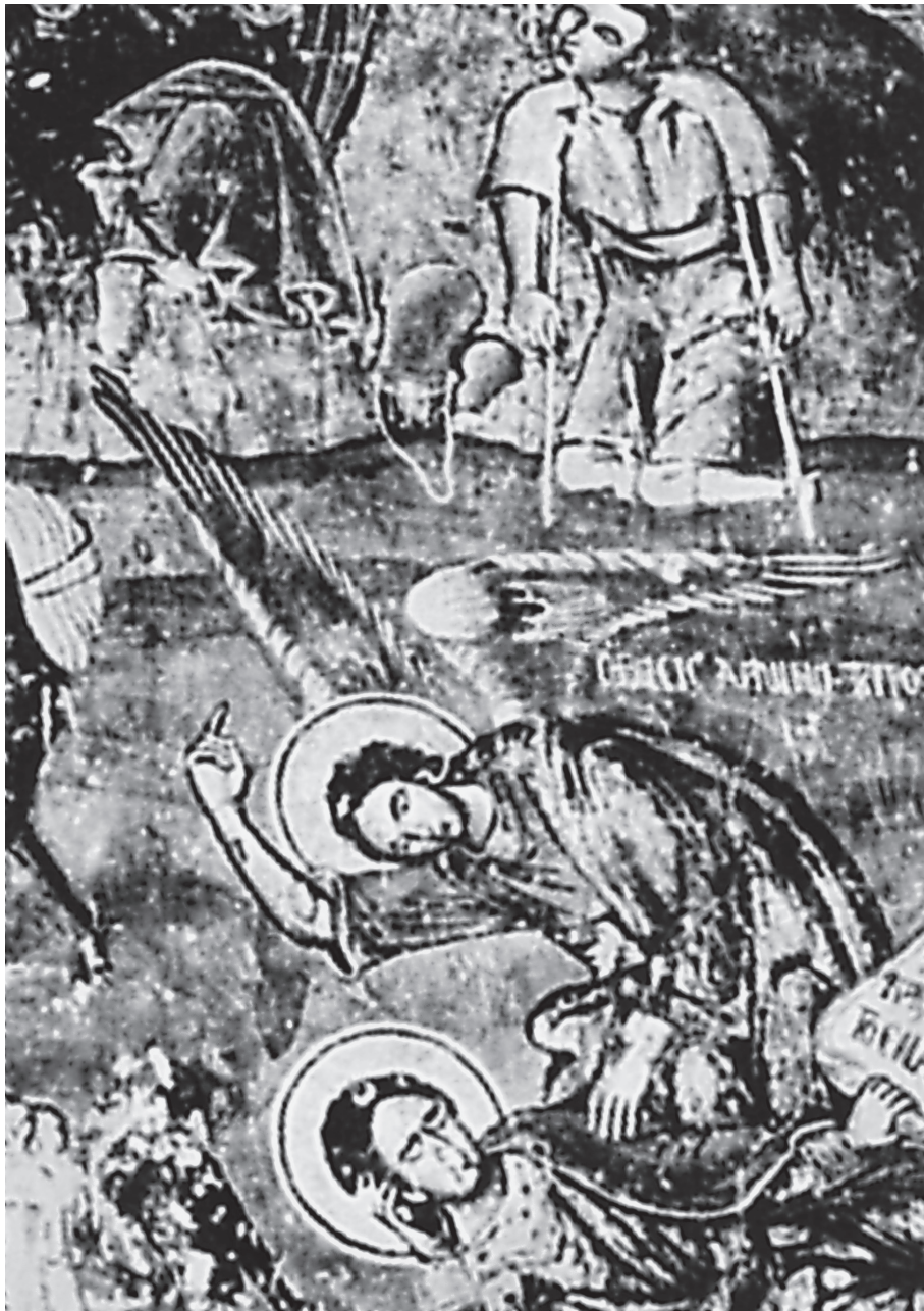
Εικ. 4. Το Όραμα του προφήτη Δανιήλ (λεπτομέρεια από την παράσταση της Δευτέρας Παρουσίας). Τοιχογραφία, καθολικό μονής Ρέθα, Αιτωλοακαρνανία. Τέλη 17ου-αρχές 18ου αι. (Α. Δ. Παλιούρας, Βυζαντινή Αιτωλοακαρνανία, εικ. 154).

προφήτου Δανιήλ». Σε αυτήν ο προφήτης εικονίζεται κοιμώμενος, ενώ άγγελος του δείχνει τη Θεοφάνεια στο επάνω μέρος της παράστασης. Ο Χριστός παριστάνεται ένθρονος, πλαισιωμένος από δύο σεραφείμ και δύο σεβίζοντες αγγέλους. Στο ειλητό του προφήτη αναγράφε-