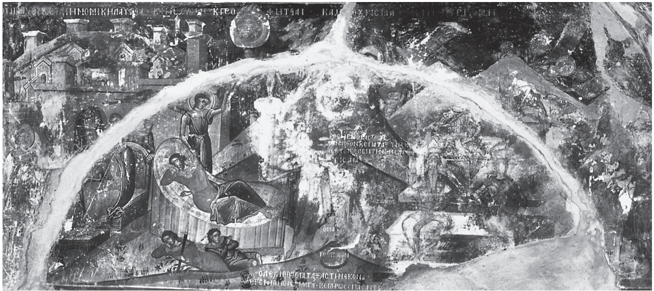
Εικ. 6. Το Όραμα του προφήτη Δανιήλ και άλλες σκηνές από τον βίο του. Τοιχογραφία, καθολικό μονής Φιλανθρωπηρών, Νησί Ιωαννίνων. 1560 (Μ. Αχειμάστου-Ποταμιάνου, Οι τοιχογραφίες της μονής Φιλανθρωπηρών , εικ. 166).

Δευτέρας Παρουσίας, στον ανατολικό τοίχο 30 . Σε συνδυασμό και με την τοιχογραφία που ιστορεί τον Ύμνο των Χριστουγέννων στη δυτική καμάρα 31 δημιουργείται ένα εικονογραφικό σύνολο που εξυμνεί το έργο της Θείας Οικονομίας από την εποχή των προφητών της Παλαιάς Διαθήκης έως την ημέρα της Δεύτερης Έλευσης, εξαιρώντας τη δόξα του σαρκωθέντος Χριστού 32 . Ίσως, λοιπόν, ο ζωγράφος θεώρησε ότι η απεικόνιση του Κυρίου ως Παλαιού των Ημερών θα διατάρασσε το θεολογικό νόημα που προκύπτει από την ομοιογένεια των προαναφερθεισών παραστάσεων, τη στιγμή μάλιστα που την εποχή εκείνη ο τύπος αυτός δήλωνε τον Θεό-Πατέρα σε παραστάσεις της Αγίας Τριάδος 33 .