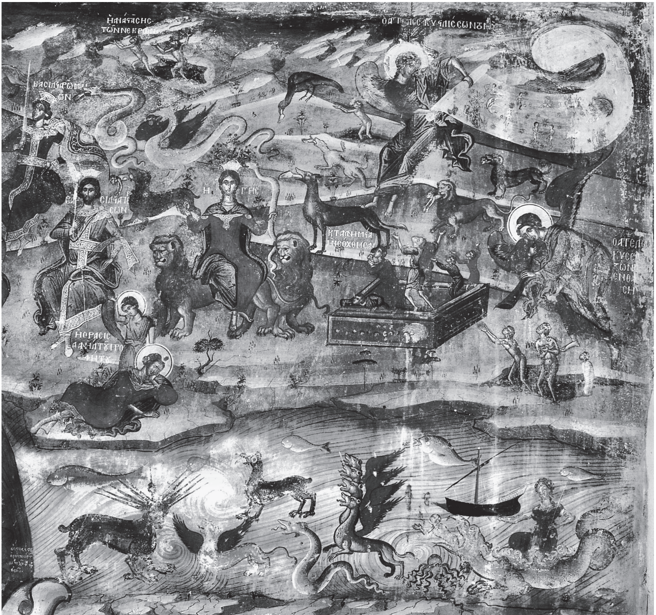
Εικ. 1. Το Όραμα του προφήτη Δανιήλ (λεπτομέρεια από την παράσταση της Δευτέρας Παρουσίας). Τοιχογραφία, καθολικό μονής Φιλανθρωπινών, Νησί Ιωαννίνων.1560 (Μ. Αχεμιάστου-Ποταμιάνου, Οι τοιχογραφίες της μονής Φιλανθρωπινών, εικ. 173).

Στην τοιχογραφία του καθολικού της μονής Ρέθα (τέλη 17ου-αρχές 18ου αι.) 22 , επίσης στην Αιτωλοακαρνανία, διακρίνεται και ο άγγελος που σκύβει πάνω από τον