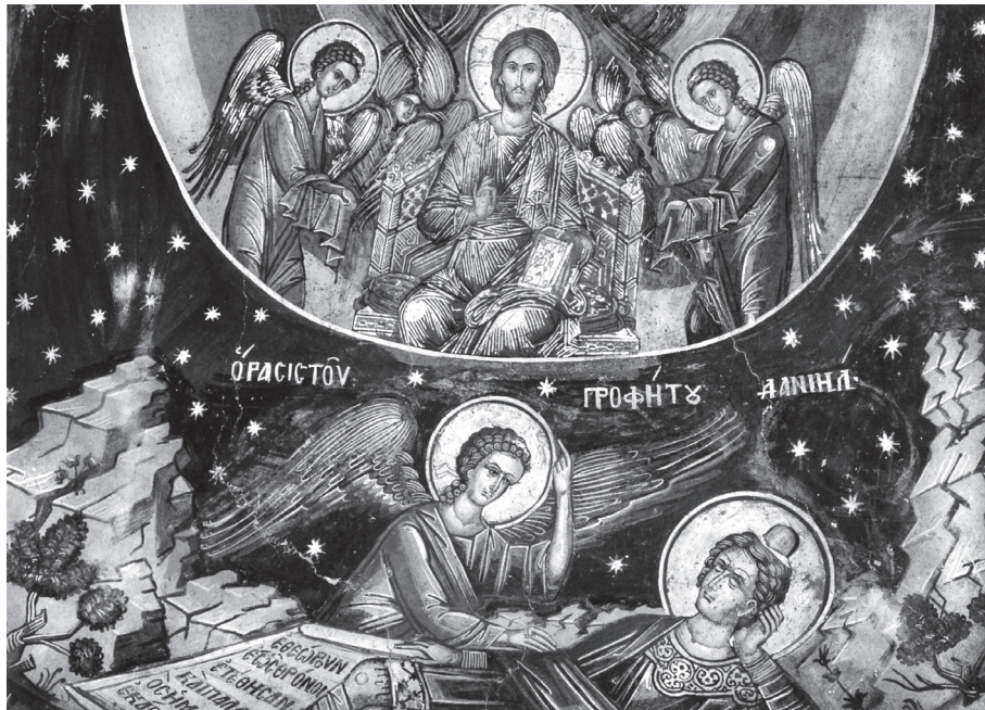
Εικ. 7. Το Όραμα του προφήτη Δανιήλ. Τοιχογραφία, καθολικό μονής Δοχειαρίου, Άγιον Όρος. 1568 (Α. Παλιούρας, «Οι τοιχογραφίες του Καθολικού», εικ. 19).

χωρίο αυτό, γεγονός που μαρτυρεί την εξοικείωση των πιστών με το όραμα του ζ' κεφαλαίου, επιβεβαιώνει και η σχετική αναφορά του Διονυσίου εκ Φουρνά στην Ερμηνεία του, όταν περιγράφει τον τρόπο «ιστόρησης» του τρούλου 37 .