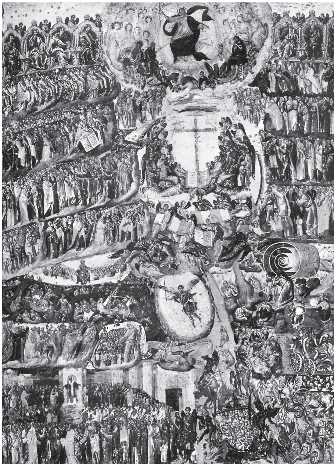
Εικ. 3. Γεωργίου Κλόντζα: Η Δευτέρα Παρουσία. Φορητή εικόνα, μονή Θεοτόκου Πλατυτέρας, Κέρκυρα. Τέλη 16ου-αρχές 17ου αι. (Π. Βοκοτόπουλος, Εικόνες της Κέρκυρας , εικ. 153).