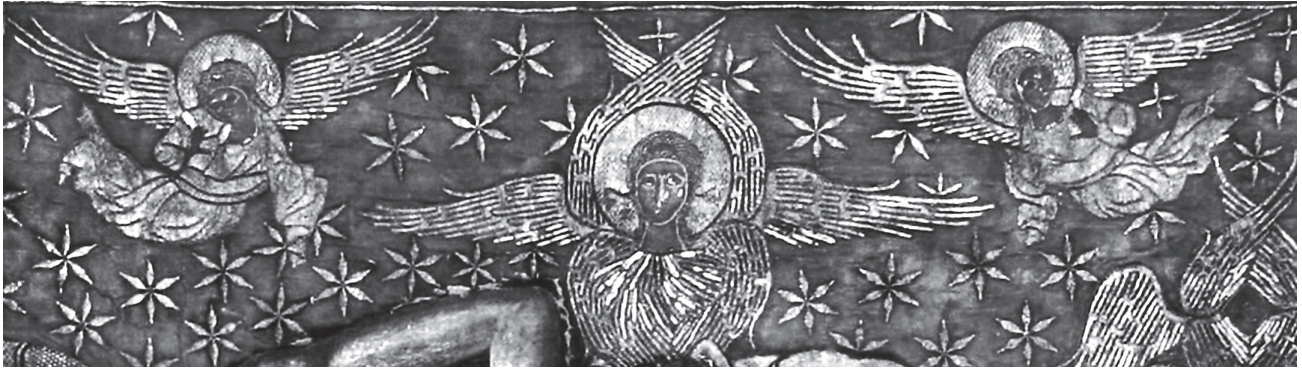
Εικ. 3. Άγγελοι με χερουβείμ και σεραφεΐμ.

αριστερό χέρι το αντίστοιχο μάγουλο, ενώ με το δεξί ακουμπάει το δεξί γόνατό της. Ο Ιωάννης φέρει το δεξί χέρι μπροστά στο στήθος του, ενώ με το αριστερό κρατάει τμήμα του ιματίου του. Η στάση και των δύο εκφράζει βαθιά θλίψη και περισυλλογή. Στο κατώτερο τμήμα της συνθέσεως και κάτω από το σώμα του Χριστού, στο μέσον εικονίζονται δύο θρόνοι, δηλαδή διπλοί πτερωτοί τροχοί, διάστικτοι με οφθαλμούς 11 .