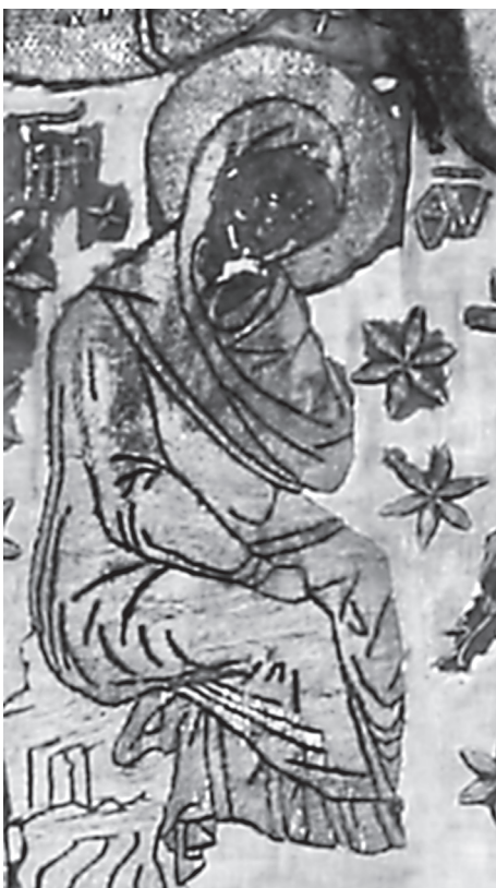
Εικ. 4. Η Θεοτόκος.