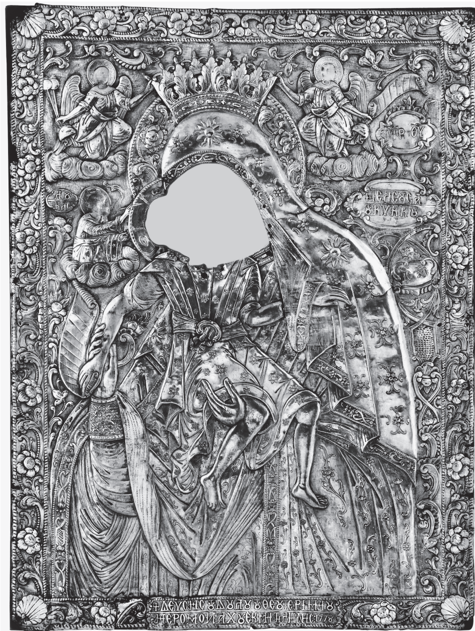
Εικ. 4. Αθήνα, Βυζαντινό και Χριστιανικό Μουσείο. Επένδυση εικόνας της Παναγίας Ελεούσας του Κύκκου ( ΒΧΜ 1485).

σιώνουν την αγία Παρασκευή, αν και πιο φυσιοκρατικοί στην απόδοσή τους, επαναλαμβάνονται και στο πλαίσιο της επένδυσης της Παναγίας με εντονότερη όμως εδώ διάθεση ροκοκό.