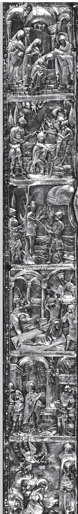
Εικ. 3. Αθήνα, Βυζαντινό και Χριστιανικό Μουσείο. Λεπτομέρεια της επένδυσης εικόνας με έξι σκηνές του βίου και του μαρτυρίου της Αγίας Παρασκευής.