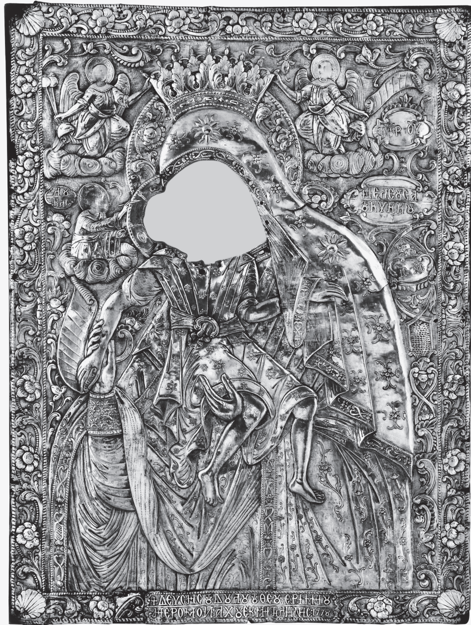
Εικ. 4. Αθήνα, Βυζαντινό και Χριστιανικό Μουσείο. Επένδυση εικόνας της Παναγίας Ελεούσας του Κύκκου ( ΒΧΜ 1485).

σιώνουν την αγία Παρασκευή, αν και πιο φυσιοκρατικοί στην απόδοσή τους, επαναλαμβάνονται και στο πλαίσιο της επένδυσης της Παναγίας με εντονότερη όμως εδώ διάθεση ροκοκό.