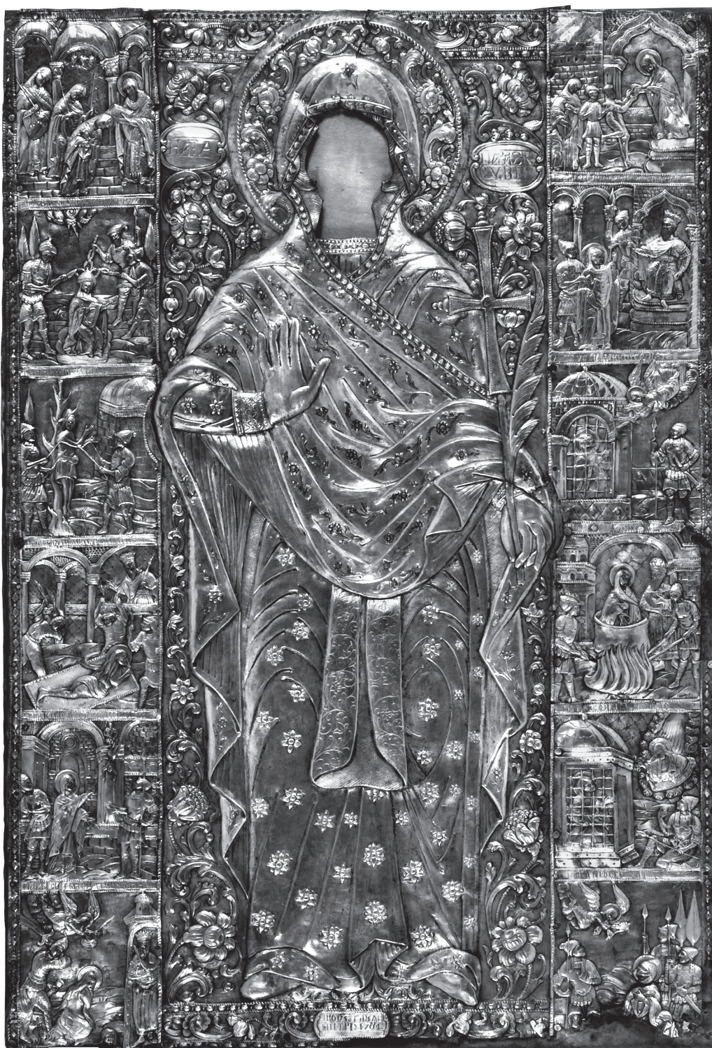
Εικ. 1. Αθήνα, Βυζαντινό και Χριστιανικό Μουσείο. Επένδυση εικόνας της Αγίας Παρασκευής της Ρωμαίας με δώδεκα σκηνές από τον βίο και το μαρτύριό της ΒΧΜ 1484.