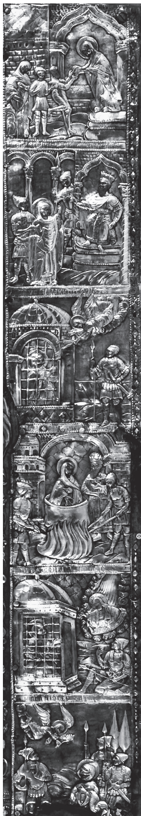
Εικ. 2. Αθήνα, Βυζαντινό και Χριστιανικό Μουσείο. Λεπτομέρεια της επένδυσης εικόνας με έξι σκηνές του βίου και του μαρτυρίου της Αγίας Παρασκευής.