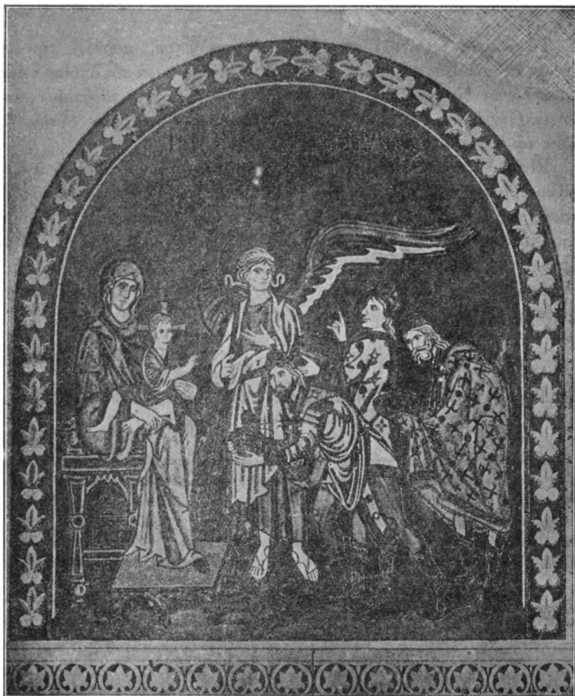
Ἡ προσκύνησις τῶν Μάγων. Θαυμάσιον ψηφιδωτὸν ἐν τῷ ναῷ τῆς Μονῆς Δαφνίου.

αὐτοῦ τε καὶ ἐμοῦ πρὸς τὸ Συμβούλιον τῆς Χριστιανικῆς Ἀρχαιολογικῆς Ἑταιρείας διὰ τὴν πρόσκλησιν, τὴν ὁποίαν εἶχε τὴν καλωσύνην νὰ μου ἀπευθύνη.