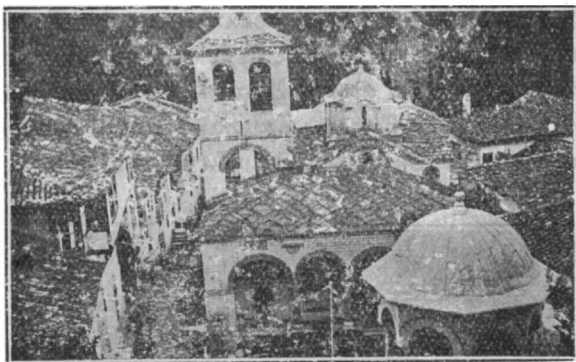
Ἐξωτερικὴ ἄποψις τοῦ Ναοῦ τῆς Μονῆς τοῦ Τιμίου Προδρόμου.

Ἄλλαι ὠραῖαι ἀρχαιότροποι ζωγραφίαι μετὰ πολυσταυρίων φελονίων ὁ Ἅγ. Βασίλειος καὶ Γρηγόριος ὁ Θεολόγος. Ἐν μικροτέραις κόγχαις οἱ Ἅγιοι Ἰγνάτιος καὶ Ἐλευθέριος. Ἐπὶ τοῦ νοτίου τοίχου οἱ Ἅγιοι Σπυρίδων καὶ Βλάσιος. Τῶν Ἁγίων τούτων τὰ φελόνια κοσμοῦνται καὶ διὰ γραμμάτων. Ὑπερθεν τῆς μεσαίας κόγχης, ὁ Εὐαγγελισμὸς, ἡ Ἐπίσκεψις τῆς Θεοτόκου πρὸς τὴν Ἐλισάβετ καὶ ἐξαισία ἢ Μεταμόρφωσις τοῦ Σωτήρος.