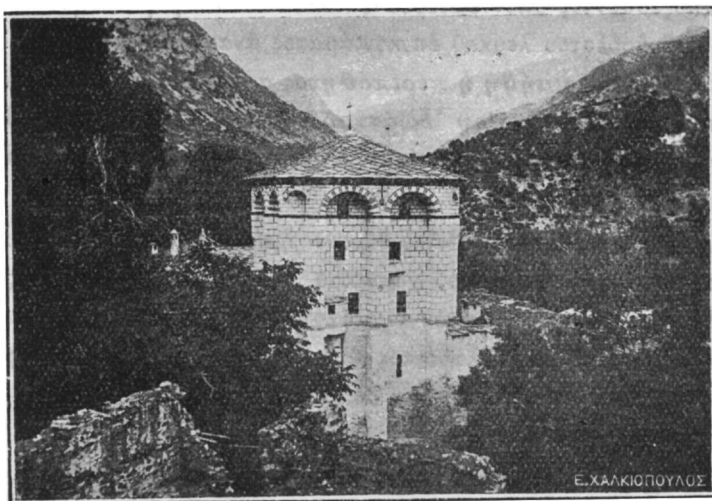
Ὁ Πύργος τῆς βιβλιοθήκης τοῦ Μοναστηρίου.

Διεσώθη ὡσαύτως πάμμεγας ἐπιτάφιος διακέντητος ἐκ χρυσοῦ καὶ μεγάλων πολυτίμων μαργαριτῶν, ἔργον τῶν χειρῶν διασήμων Βιενναίων