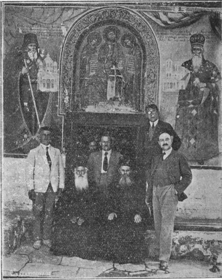
Ἡ εἴσοδος εἰς τὸ Μακρυναρῖκι τῆς Μονῆς τοῦ Προδρόμου.

πολιν, ὅπου τῇ μεσολαβῆσει τοῦ ἀπὸ Σερρῶν Πατριάρχου Χρυσάνθου ἀπελύθη μετὰ πεντάμηνον ἐν τοῖς Πατριαρχείοις περιορισμὸν μετὰ τοῦ πνευματικοῦ Ἰωακείμ, ἀρχιδιακόνου Ναθαναήλ καὶ ψάλτου Θεοκλήτου,