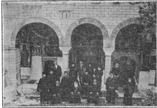
Ὁ πρόναος τοῦ ἀρχαίου ναοῦ τῆς Μονῆς.

τραπέζης πρὸς αὐτὸν ἀτενίζοντες, ἐπὶ δὲ τῆς τραπέζης καλλιτεχνικῆ ἀρχαία λήκυθος ἀριστερόθεν δὲ παρίσταται ἡ Θεομήτωρ ἐλαφρῶς πρὸς Αὐτὸν κύπτουσα καὶ ἠδέως προσμειδιώσα. Εἶναι ζωγραφία τῆς ὁποίας ἡ σύνθεσις καὶ ἡ τεχνοτροπία τόσον ἐλκύει τὸν ὀρῶντα ὥστε δὲν θέλει νὰ ἀπομακρυνθῇ αὐτῆς. Ἐν τῷ ἀπέναντι πλευρῷ ὑπὸ τὸ ἀρχιτεκτονικὸν τόξον, τὸ συμπόσιον τοῦ Ἡρώδου καὶ ὁ Πρόδρομος πρὸ αὐτοῦ ἐκφραστικώτατος· εἰκονίζεται δὲ θαυμασίως ἐν ποικιλίᾳ ζωηροτάτων χρωμάτων ἡ χλιδῆ τοῦ Παλατίου. Ἡ μετάληψις ὡσαύτως Μαρίας τῆς Αἰγυπτίας πολὺ φυσικῆ· ζωηροτάτη ὡσαύτως ζωγραφία εἶναι «ὁ προφήτης Ἡλίας τρεφόμενος ὑπὸ τῶν κοράκων» καὶ «ὁ Κύριος ἐπιβάλλων τὸν ὕδρωπικόν», (sic) ἦτοι τὸν ὕδρωπικόν. Περαιτέρω ὁ αὐτὸς ἐκδιώκων τοὺς πωλοῦντας καὶ