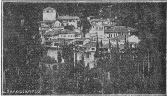
Γενικὴ ἀποψις τῆς Μονῆς τοῦ Τιμίου Προδρόμου.

Ἐκδραμόντες ἐπίτηδες πρὸς ἐξακρίβωσιν τῆς μετὰ τὴν ἐρήμωσιν δημιουργηθείσης θλιβεραῆς καταστάσεως τῆς Μονῆς, κατώδουνοι θαλαρροῖς κατεθρέξαμεν δάκρυσι τὸ κενὸν ἤδη —φεῦ!— Θησαυροφυλάκιον, ὅπερ ἦτο πλουσιώτατος θησαυρὸς Βυζαντινῶν ἀνεκτιμήτου ἀξίας κειμηλίων καὶ τὴν πενθίμως ἔρημον βιβλιοθήκην μὲ τὰς ὠραίας κυπαρισσίας θήκας τῆς, ἀλλ' ἄνευ