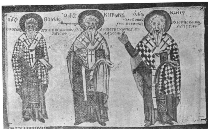
Ὁ Ἅγιος Θωμάς, ὁ χωριάτης, ὁ Ἅγιος Κυριακὸς, ὁ θαυματουργός, ὁ Ἅγιος Ἀντώνιος, ὁ νέος θεολόγος, ἀρχιεπίσκοποι Λαρίσης. Τοιχογραφία ναοῦ τῶν Ἁγίων Ἀναργύρων ἐν Τρικκάλοις.

βορείου πλευρᾶς τοῦ κυρίως ναοῦ καὶ κάτωθι τῆς ἐπιγραφῆς τῆς ἀνιστορήσεως αὐτοῦ κεῖται ἡ θύρα, δι' ἧς συγκοινωνοῦσι μετὰ τοῦ κατὰ μῆκος ἐκτεινομένου καὶ συνεχομένου ἀριστεροῦ κλίτους, ἢ γυναικωνίτου. Καὶ ἐνταῦθα ἔτεροι τοιχογραφίαὶ ἀγίων, ἐν οἷς καὶ οἱ Τρεῖς Ἱεράρχαι Βασίλειος, Ἰω. ὁ Χρυσόστομος καὶ Γρηγόριος ὁ Θεολόγος.