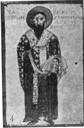
Ἄγιος Βησσαρίων, ὁ πρῶτον ἀρχιεπίσκοπος Δαρίας. Τοιχογραφία τοῦ ναοῦ τῶν Ἁγίων Ἀναργύρων ἐν Τρικκάλοις.

Κατὰ δὲ τὴν ἀνατολ. πλευρὰν τοῦ ἀριστεροῦ κλίτους κεῖται θύρα,