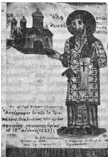
Ὁ Ἁρχιεπίσκοπος Λαρίσης Ἅγιος Νεόφυτος, ἀντιπὶς τοῦ Βησσαρίωνος

Βησσαρίωνος, ληφθεῖσα ἐκ τοιχογραφίας τοῦ ἱεροῦ Βήματος τοῦ ἐν Τρικκάλους ναοῦ τοῦ Ἁγ. Δημητρίου. Ἐν τῇ τοιχογραφίᾳ ταύτῃ, ἥτις ἀνάγεται εἰς τὸν ΙΖ' αἰῶνα, ὁ Νεόφυτος παρίσταται ὡς ἅγιος,