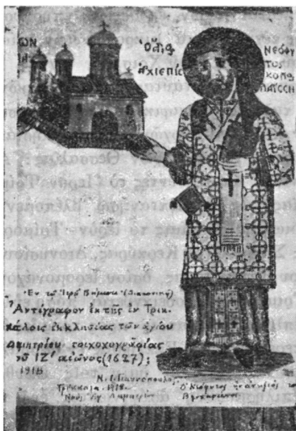
Ὁ Ἀρχιεπίσκοπος Λαρίσης Ἅγιος Νεόφυτος, ἀντιπὶς τοῦ Βησσαρίωνος

Βησσαρίωνος, ληφθεῖσα ἐκ τοιχογραφίας τοῦ ἱεροῦ Βήματος τοῦ ἐν Τρικκάλους ναοῦ τοῦ Ἁγ. Δημητρίου. Ἐν τῇ τοιχογραφίᾳ ταύτῃ, ἥτις ἀνάγεται εἰς τὸν ΙΖ' αἰῶνα, ὁ Νεόφυτος παρίσταται ὡς ἅγιος,